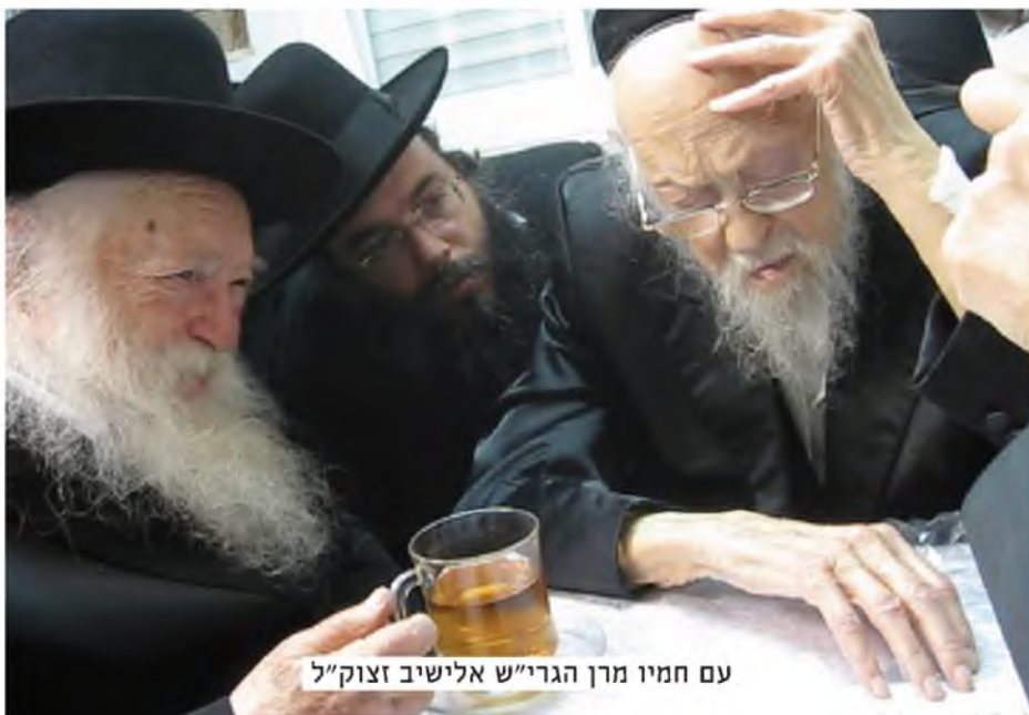
עם חמיו מרן הגרי"ש אלישיב זצוק"ל

אחד הנכדים שמע מהרבנית ע"ה דוגמאות מזהירות של רבינו מכל חשש איסור ריבית (כגון שמחזיק חשבון רק בבנק הדואר שאינם נותנים אשראי וממילא אין אפשרות לריבית). פעם אחת כיבדו אותו להיות סנדק, ושלחו רכב שיביא את הרב לברית. הנהג היה בעל תשובה. רבינו ירד מביתו לנסוע והרכב לא נסע בשום אופן. עד שרבינו נאלץ לעבור לרכב אחר. בדיעבד התברר כי אביו של בעל התשובה, רכש מכונית זו מכסף ריבית,