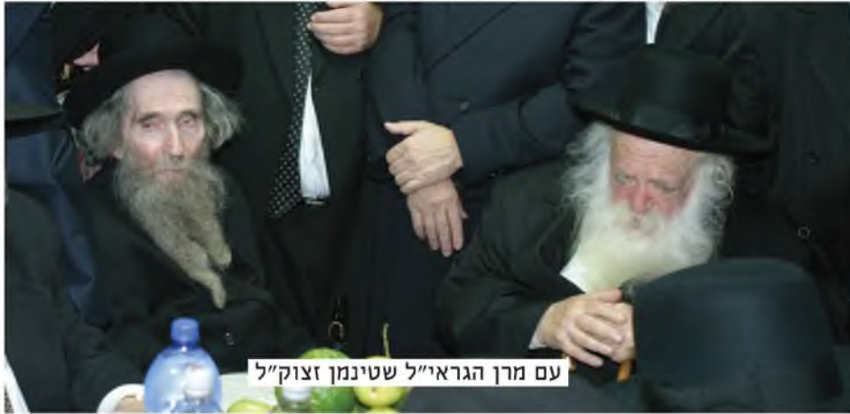
עם מרן הגראי"ל שטינמן זצוק"ל