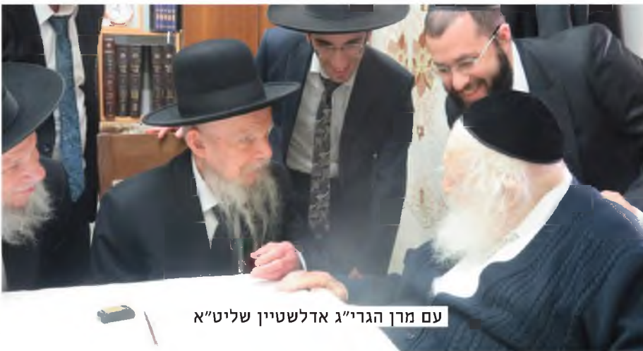
עם מרן הגרי"ג אדלשטיין שליט"א

רבנו כאשר משתתף בסעודות שמחה אצל אחרים, בדרך כלל הוא סומך ברוגע על עדות עד אחד דהיינו - בעל הבית שהכל בכשרות הראויה והפרשת תרומות ומעשרות וכו', אך מ"מ אם מתעורר נדנדוד ספק אינו אוכל, ובפרט אם זה בניגוד לפסקי החזון איש. אירע פעם שהתכבד בברכות תחת החופה בצותא עם אדמו"ר אחד שליט"א והיה נראה לו לרבינו כי אין בגביע שיעור רביעית לשיטת החזון איש כיון שהגביע לא היה בצורה רגילה, ומיאן לברך, והאדמו"ר הפציר שיברך בכוס זה שחשובה אצלו כי ירושה היא לו מזקניו הצדיקים ומשתמש בה רק בזמנים מיוחדים. אך לא הועילו הפצרותיו ונאלצו למלאות יין בכוס אחר ורק אז בירך, ומעניין כי למחרת האדמו"ר שלח לומר לרבינו כי