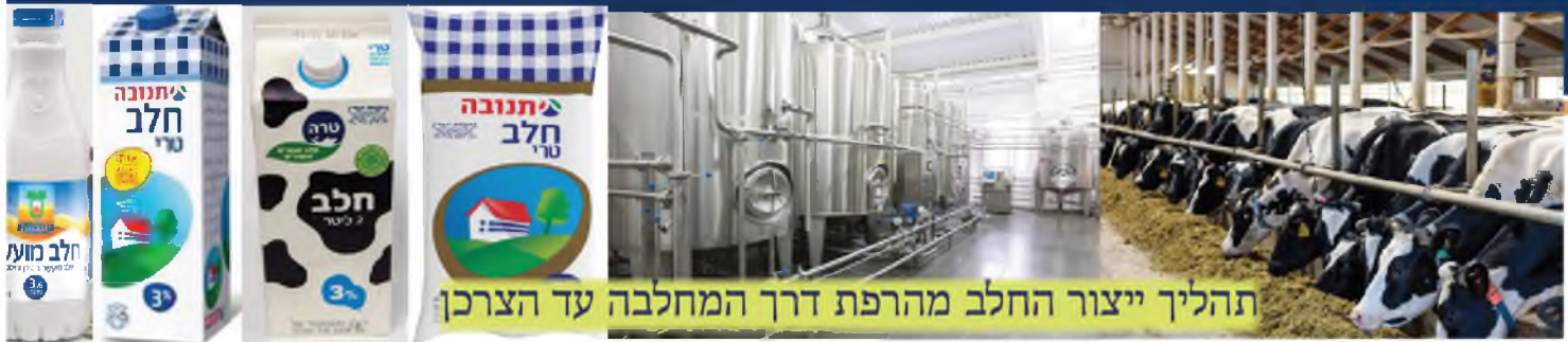
תהליך ייצור החלב מהרפת דרך המחלבה עד הצרכן

את שתיית חלבה, אף לבעלי נפש כיון שאף להרמ"א אין מקום לאסור, ובהמת יהודי שהאכילה חמץ מדינא אין לאסור שתיית חלבה, אך בזה יש מקום לבעל נפש להחמיר על עצמו.