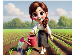
משקים את המחשבה מטפחים היטב