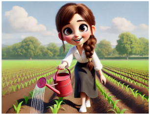
משקים את המחשבה מטפחים היטב