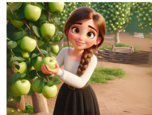
קוטפים את הפירות נהנים מהתוצאות