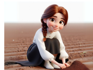
שותלים את המחשבה עם הרבה כוונה טובה