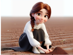
שותלים את המחשבה עם הרבה כוונה טובה