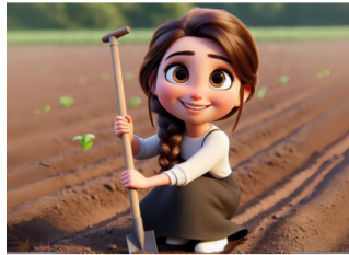
מדשנים את האדמה, ומכינים אותה לשתילה