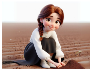
שותלים את המחשבה עם הרבה כוונה טובה