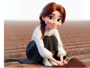
שותלים את המחשבה עם הרבה כוונה טובה