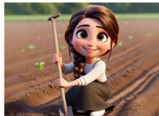
מדשנים את האדמה, ומכינים אותה לשתילה