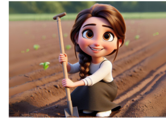
מדשנים את האדמה, ומכינים אותה לשתילה