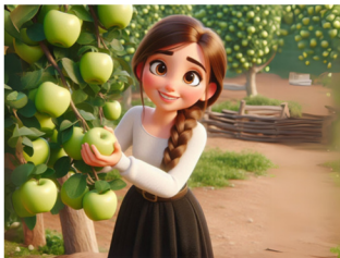
קוטפים את הפירות נהנים מהתוצאות