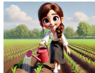
משקים את המחשבה מטפחים היטב