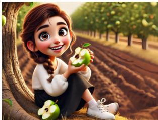
שותלים את הזרעים של הפירות מחדש באדמה