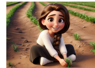
עוקרים את הספקות מסלקים את כל החששות