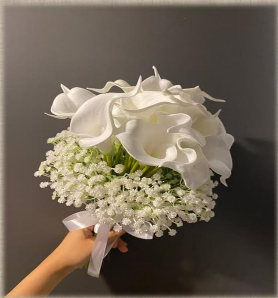
מחיר: 350 ₪