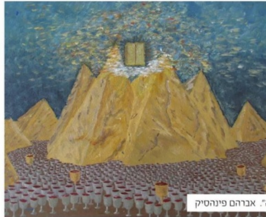
"משעבוד לגאולה". אברהם פינהטיק

מרץ 2018 ציור על בד קנבס ועם צבעי אקריליק Painting on canvas with acrylic paints: "From enslavement to redemption"