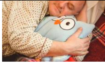
מבצע מטורף: קונים מזרן סימונס ומקבלים זוג כריות