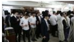
בשירה וריקודים: 'הלל' עם תלמידי ישיבת רש"י • צפו