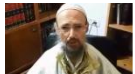
המקובל: לשרוף את תמונת הבבא סאלי. צפו