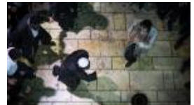
תיבת נוח: חוויה אמיתית לנשמה של קצב ותורה