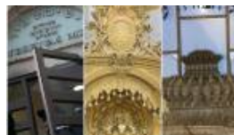
מהתפטרות רב ועד תרגיל רישום: הישיבות שחגגו