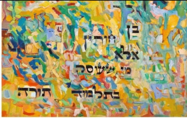
דוד וולק "אין לך בן חורין אלא מי שעוסק בתלמוד תורה"