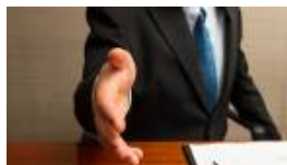
ההוצאות לפסח גדולות? הלוואות בתנאים מיוחדים