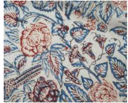
חירות ושמה איראן: האמנית אודליה במסע תרבותי

טיפול יעיל בפטרת ציפורניים ללא תופעות לוואי