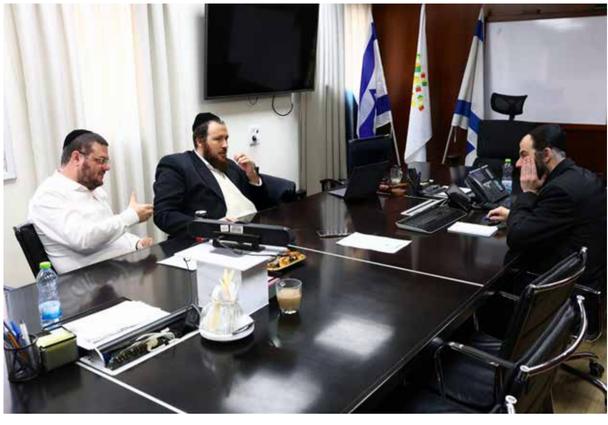
כתב אישום חסר תקדים בחריפותו. בראיון ל'משפחה'