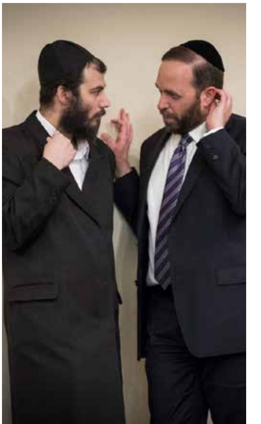
הראשון לזהות. עם אריאל אטיאס