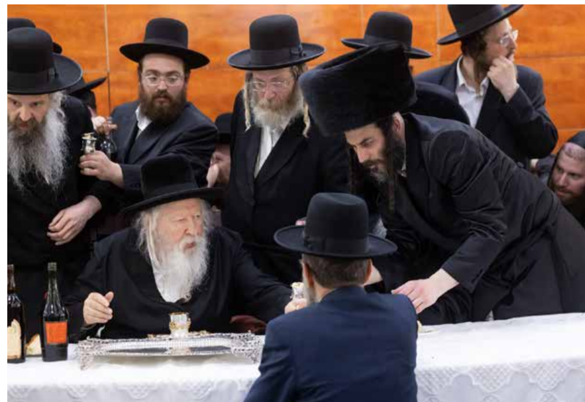
"הרבי אמר לי: אני לא צריך שיואבו לכבד אותי, אני צריך חוק שדואג לבחורי הישיבות". עם מרור ורבו כ"ק מרן האדמו"ר מגור שליפי"א. נראה: יו"ד דגל התורה ח"כ משה גפני.