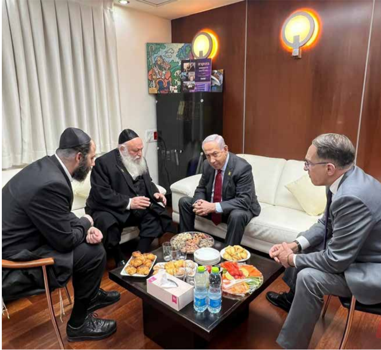
הבטחות חודרת ונשנות. בבצ'יק וגולדקנופף עם ר"מ נתניהו וראש הסגל ברוורמן