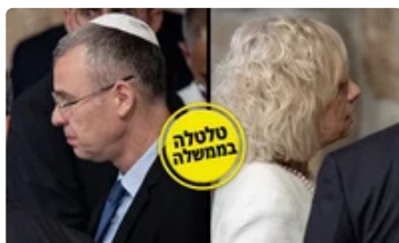
הדחת היועמ"שית | בהרב-מיארה הוזמנה לשימוע בפני ועדת השרים; "מביעים אי אימון" קובי אטינגר | 09.06.25