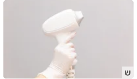
בשורה: סניף חדש ובלעדי להסרת שיער לגברים בלבד! כתבה מקודמת | מקודם