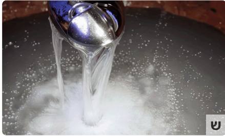
הפתרון החדשני שמושך אלפי משפחות חרדיות בקיץ הזה ציקי גל | מקודם