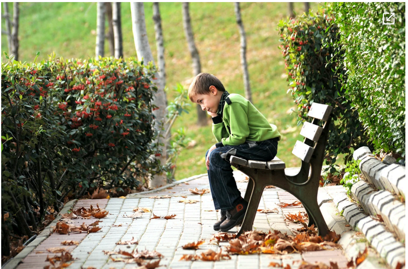
משמורת משותפת של ההורים לטובת הילד. אילוסטרציה

במסגרת הליכי גירושין המתנהלים בבית הדין הרבני האזורי בחיפה, אב"ד הרב יצחק אושינסקי הוציא החלטה שראוי להתעב עליה. הדיין קיבל את בקשתו של אב וקבע משמורת משותפת לשני ההורים לבנם בן השלוש, וזאת בניגוד לעמדת האם.