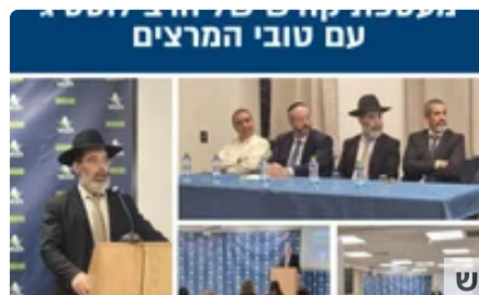
לוסטגי ומכללת מבחר בשיתוף פעולה מפתיע ציקי גל | מקודם