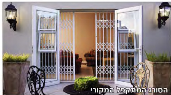
הסורג המתקפל המקורי

מבצע! סורג קבוע ישר דגם "סייפטי" החל מ- 444 ש"ח למ"ר כולל מע"מ, הובלה והתקנה!