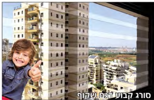
סורג קבוע זגם שקוף