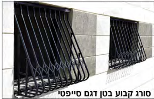
סורג קבוע בטן דגם סייפטי