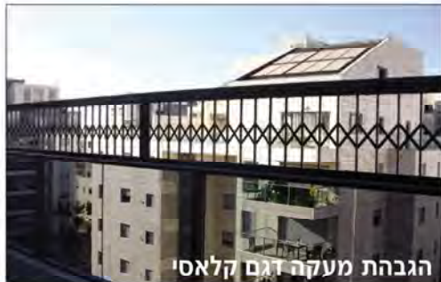
הגבהת מעקה דגם קלאסי

מבצע! סורג קבוע ישר פס חיזוק החל מ- 429 ש"ח למ"ר כולל מע"מ, הובלה והתקנה!