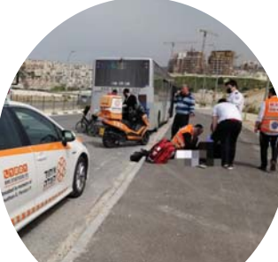
עוד אחד. תאונה בין אוטובוס לאופניים חשמליים ברחוב אליהו הנביא.

"אני רוצה שיהיה ברור", מחדד הרב קאפ את דבריו, "אני לא נגד אטרקציות מעניינות לחילה וחס. הניעה על הקורקינט יכולה להיות חוויה נעימה ואפילו בטוחה, אבל צריך לעשות אותה בזהירות. קודם כל תשאלו את עצמכם: מתי היתה הפעם האחרונה שנסעתם על גבי קורקינט? עשיתם את זה פעם בכלל בימי חיכם? עשיתם זאת בעשור האחרון? בשנה האחרונה? אם לא, למא אהם מרשים לעצמכם לעלות עליו ולהגיע מיד למהירות של 30 קמ"ש בלי לנסות ולצבור ניסיון קודם לכן?"