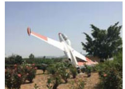
מנועיה על הקרונוה שערן מפעל מנועי בית שמש.

ברבעונים הבאים ומצפים לחזרה הדרגתית לפעילות מלאה, כפי שהייתה ערב המשבר ואף מנבא לכן. במקביל, אנו ערוכים לספק את הביקושים החלים של לקוחותנו, בין היתר, באמצעות הפעלת החליש והשקעות נוספות שביצענו במימון וטכנולוגיות חדשות שיתמכו בשיפור הביצועים".