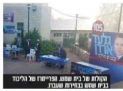
הקולות של בית שמש. הפריימריז של הליכוד בבית שמש נבחרות שעברו.