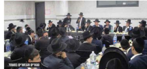
החורים והבחורים במעמד.

מעמד נדיר ורב רושם נערך כאשר בחורי ישיבת "היכל משה" ערכו ארבעים יומי מסכתות בבא קמא. המעמד נערך בהשתתפותם של החורים החשובים ושי"ח, בראשותם של רבני הישיבה שליט"א. רבני העיר רמ"ם ונמל"ג מוסדות בנינו בית שמש, שאף נשא דברים וביטו את כוול המעמד; דבר נדיר הוא הישיבה זוהי שכל תלמידיה סיים סיימו את המסכת הלימוד כהולך השנה, ובפרט שזו סוף השנה להיבחן על כל המסכת ולהפנין את ידיעותיהם בהצלחה רבה, מה שהעניק בנפש הבחורים את החיבור ללימוד תורה ולאבות תורה בכלל ולמסכת הגלגלת בפרט, וכן כשהולך מיוחד ותומכין בקפידה התחילו הבחורים את לימוד מסכת בבא קמא 'אלו תשפ"א בניין ובקפואת עם הרש"ם שליט"א, חן שיטת דרש מיוחדת על שינון חזרה, כאשר כל בחור כשהולך השנה זוכה לחזור על כל המסכת לעגלה משש פעמים. מנעד הסיום נערך לאחר חודשים ארוכים בהם שקדו בחורי ישיבת "היכל משה" כולם על לימוד המסכת בהולך השיעורים והסדרים ובתוספת תוכנית אישית של השלמת הפרקים עד לסיימה ממש. כשהולך ימי החזרות מבר שיחה לבחורים בהיכל הישיבה חתרו' האבן רבי יצחק קולדיק שליט"א, שהתרגש מאוד לראותם על זכותם של הבחורים לסיים את מסכת בבא קמא, וקרא להם בהתרגשות גדולה כולם מנראים בבא קמא'יקים, וכי אחר ראי שתורה עלי שכינה כפשוטו. כמשא סיפר לבחורים שהחוק ארש כשבא אלו בחור שסיפר לו שסיים את בבא קמא נשקו על ראשו ואמר לו שמעתה שבו בבא קמא'יקים, והמשין הפליגו מאוד בשבחם של החורים שחזות פניהם מוכיחה את הוראת שנים הגדולה שלהם.