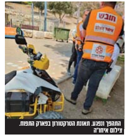
התחפר ופונע. תמונת הטרקטורון בקצוק הפחפח.

חובשי רפואת חירום של איחוד הצלה מספיק בית שמש העניקו לו סיוע רפואי ראשוני בשטח, כשלאחר מכן הוא פונה להמשך טיפול בבית החולים עם חבלות כשמצבו כאובד מוגדר קל. חשוב להדגיש כי כלי רכב שנאלו כמו טרקטורון, אופניים חשמליים, קוקטייקס חשמליים, הם נראים כלפי חוץ כמשקומים חביבים, אבל בפועל בימי בן הוננים אין כמעט יום שעובר בלי שמועדי על עור אחד שנפגע מכלים אלו, ולכן ההירות מתבקשת. זה בהחלט לא משחק.