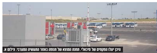
היכן יעלו הפקקים של מיכאלי. חתנת המוצא של חטפה באזור התעשייה המערבי.

התגובות על ההחלטה האוטומטית, הגיעו במהירות, ושלב שני התגובות הגיעו לא רק מהנציגים החריזים, אלא מגוון הקשת הנוספים, כאשר מכולם עולה אותה תמונה. התחבורה הציבורית בארץ בשפל, אין אופן בתחבורה הציבורית, האוטובוסים למרבה האכזב כבר לא בטוחים כמו בעבר, אך במקום שמשדר התחבורה יעסוק בכך, מצאה השרה בקעה להגדרו בה, ונשא שלי, שאולי יתייג זה דקות שידור בתקשורת, אבל לא יותר מכך.