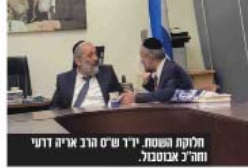
חלוקת השטח. יו"ר ש"ס הרב אריה דרעי ורה"כ אבוטבול.