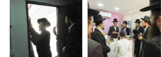
שעות פתיחה: ימים א'-ה' 17:00-21:00 להשתמש!

חנות מיקרופון מירת מכושרים, מעבדה מקצועית, תקשורת סלולרית, קוויים נייחים, נגנים ואבזורים. והיא בשורת שפע ברמה שלא הכרתם ומעל הכל שרות מכל הלב. הפתיחה נבחר מנשירים במחירים משתלמים!