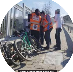
רכב ומפעיל. תחנת אופניים ברחוב זכריה הנביא.

במיוחד ואתם נוטנים את הכלי הזה לילדים, אתם בטוחים שהם יודעים לתפעל אותו כראוי? בדיקה אתם כמה פעמים לוודא שהם יודעים לעצור בפתאומיות מבלי להתהפך? אפילו רוכבי הקורקינטים המוכשרים והמקצועיים ביותר לא יסכימו לנסוע במהירות גבוהה כל כך בפארקים ועוסי מבלים. זה פשוט מסוכן!