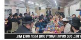
ברסלב. טקס פתיחת הקמפיין למען הקמת משכן קבוע.

חסיד ברסלב, יתן כוחו ד' הגנה וחיול נכסיו עבור פרויקט נשגב ועלה זה.