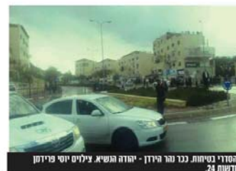
המדיניות נכר נהר הירדן - יהודה הנשיא

עוד באמצע הבטיח האו מתחיל התנועה, הרבנים הבאים מניחו נהר הירדן לטובה לא מוקדמים, אי אפשר לצאת מרכיב יהודה הנשיא, רבנים שהגיעו מרחוב נהר הירדן למעלה ורובים לפנות שאלה לרבי יהודה הנשיא תקיפים ועצרים את כל התנועה מנוול, ונתחילה נוקלה של צמידות וצפופים... "אנחנו רוצים להצטרף לנינוה, למה אה לא באים ללמוד מיקור נהר צרף לתקן ולא לחפש פתרונות חלופיים", כך פותח יעקב ב. תושב רובי"ש ב' את פניו ל'חדש', בה הוא בעצם הצעה ממשית לפתרון עוטף התחבורה הפקקים בש"ר נהר הירדן. "בואו לרכיב רבי יהודה הנשיא ותראו את הבעיה בעצמכם", טוען יעקב, "מי שתכנן את מיקום התחנת האוטובוסים נבשל כדור, התחנה בנהר הירדן 38 מנבאת מיד לאחר הרכיב, יש בה מיקום עצירה מיקסימום לאוטובוס אחד. מה שקורה כיום, אוטובוס עוצר בתחנה ונאחריו האוטובוס הבא שאין לו לאן להמשיך הוא