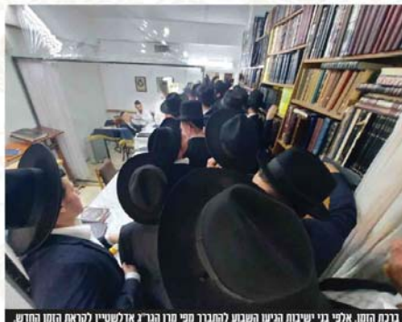
בית המדרש, אלפי בני ישיבות הגיעו השבוע להפגנה מרן הגר"ג אדלשטיין לקראת חנוכה החדשה

"דבר מה שנוגע עתה למעשה, בימי בין הזמנים, זהו זמן שחסר זכות התורה, נפשי שאין דורים קבועים בישיבות כמו באמצע הזמן, ואמנם יש ישיבות בין הזמנים, אבל אין כל כך הרבה תורה כמו שיש כל השנה, וחסרה זכות התורה, וחסר שלום עול ליהיות פריקת עול תורה", אמר מרן ראש הישיבה הגר"ג אדלשטיין שליט"א בתוך שיחת חיווק ששטר סטמט בימים אלו.