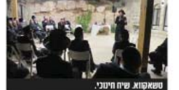
טשאקווא ש"ח חיינו.

העסקים ואברכי קהילת טשאקווא בעיר אשר שנה יצא לתהילה בשכונת רמת אברהם ומחוצה לה, החליטו לצלל את ימי 'בן המנינים' להנעת חזרה רחנית וגשנית לאברכי הקהילה ולמדו הכולל, וכשבעה האחרון הסיעו את הציבור לערב התאורחות והתענוגות במתחם המפואר באחוזה 'קרב הסלע' במושב 'איבי הנחל' שכונת השומרון.