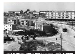
מעברה לניד. תמונת הבנייה הראשונה שנבנו בניי