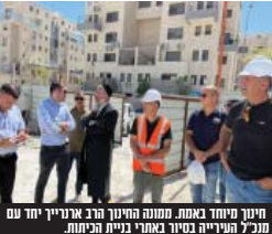
חינוך מיוחד באמת. ממונה החינוך הרב ארנרניי יחד עם מנכ"ל העירייה בסיר בארני גניית הכיתות.

משרד החינוך פרסם השבוע מסמך רשמי המאפשר לקצין את יום הלימודים בכיתות תקשורת. מתוך הצורך לשמור על שגרת הילדים לצד התחשבות בחורים, עריית בית שמש-מינהל חינוך, נועד וקדימה יצאו למהלך ליוני כוח אדם, כך שבמקום סיום יום הלימודים בשעה 15:10 היום הוארך לשעה 16:45. מדובר במהלך חשוב שותאפשר בזכות היראתנות של כלל הגורמים המקצועיים, בראשם ראש מינהל חינוך, נועד וקדימה שיר דודור. מתוך מטות כיתות הלימוד החדשן שראש העיר פעלה מול משרד החינוך להביא לעיר בית שמש, כ-80 כיתות חדשות וכן כיתות חזרות בחינוך המיוחד ו-60 כיתות מתוך מופנות לחינוך החרדי. מדובר במשורה עצומה בציבור החרדי. המשוורה היא בחיובק סל האצעעים לטיפות חזוקה הילדים, ובעיקר בשנה משנים קודמות ילדי העיר לא צריכים לצאת מחוץ לבית שמש ומקבלים מענה בעיר. כבר משנה שעברה החלה התמקת הטיפול בהרחבת התקנים וגיוס הכיתות של חינוך מיוחד לעיר. ראש העיר בלוק רואה שליחות גדולה בצמצום זמן שהות ילדי חינוך המיוחד בדרכים. זהו מהלך שבנון חינוכית וחינוכית רבות לחורים. בשורה נוספת משמעותית