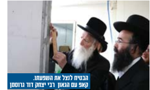
הבטיח לנצל את השפעתו. קאפ עם האנן רבי יצחק דוד גרוסמן