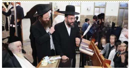
החל מראש חודש סיון ומבצעים. היום חלק אינטגרלי במסודות חינוך ובתנ"כ השונים. אולם כאשר מדובר בתלמידים שמתאמצים מאד כדי שיראו פירות בעולם, תחושת הנחת של ההצלחה מקבלת משמעות שבעתים, מרובתה את הלך ומלאת בחדיה עוקקה על הסיעת ארשטיא ועל הצוות המופלא - השליחים המסורים העושים מלאכתם באמנה להצלחה מרשימה זו, תוך מגענה תקשורתי חברתי מקצועי.

תלמוד תורה באר משה אידיש בבית שמש, הוקם עבור תלמידים מהחסידות המובילות ומהקהילות האריות, משפחות אשר כל מטרתם ומהותם להתכנס לתורה ויראת שמים מתוך אורית חיריד על טהרת הקודש ומכילי לותר על המענה המקצועי הדרוש לתלמידים אלו מתוך שאיפה להעניק לבנם את הטוב ביותר וללא שום פשרות - הן מבחינת