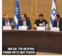
נתנים את הלב. סגן השר אבוטבול נאם בכינוס ההוקרה

אברהם בצלאל לראשי הארגונים שמחלקים מזון למשפחות הוא אירוע חשוב ומתבקש, שכן ראשי הארגונים יחד עם אלפי המתנדבים עומדים בחזית "כינוס הוקרה חשוב זה שיום ח"כ הרב האבוטבול בכינוס הוקרה לארגוני המזון