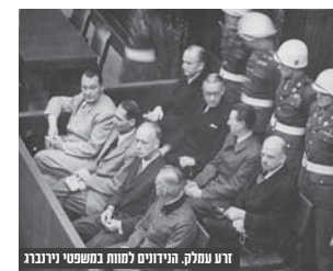
דוע עמלק. הנידונים למוות במשפטי נירנברג

בני ירושלים התהדים לדבר ה' הכינו שער מלכותי מופאר מאן מנותו לכבוד הקיסר, שערי שוכה להשואת התפעלות מכל בני העמים והדתות שהשתתפו בקבלת הפנים המלכותית. כולם המתניו בחדרת רוממות, כדי לקיים את מאמר החנינו ז"ל "מצווה לרוץ לפני מלכי אומות העולם" וכדי לברך על ראיית פני המלך ופמלייתו את ברכת "ברוך שחלק מבכורו לבשר דם" - מלך מלכי המלכים הקב"ה, בכבודו ובעצמו, חלק מבכורו לכבוד הקיסר וילהלם רי"ה, ואנו לא נשתתף בחגיגה!?