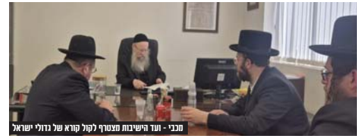
מכבי ועד הישיבות מצטרף לקול קורא של גדולי ישראל

לאחר שביחמת מכבי חתמו מרנן ורבנן גדולי ישראל שליט"א על קול קורא היסטורי שקורא לכלל בני התורה "להתרחק מעישון סיגריות לחלוטין בפרט בימי הפורים הבעל"ט", ביקרו הנהלת מכבי אצל יו"ר ועד הישיבות הגאון רבי חיים אהרן קאופמן שליט"א, שהבטיח כי ועד הישיבות יפעל בתוך היכלי הישיבות והכוללים על מנת לעורר ולהשמיע את קריאת גדולי ישראל בדבר סכנות העישון ונזקיו.