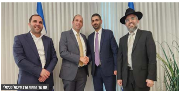
עם שר הדתות הרב מיכאל מינצ'יל