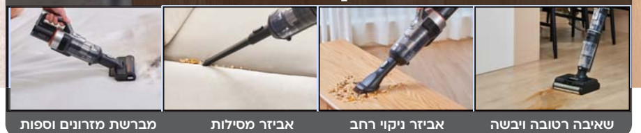
מברשת מזרונים וספות | אביזר מסילות | אביזר ניקוי רחב | שאיבה רטובה ויבשה