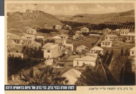
בני ברק, סביב העשפה עירייה לביאוב למדן תורה בני ברק. בני ברק של היום בראשית דרכה