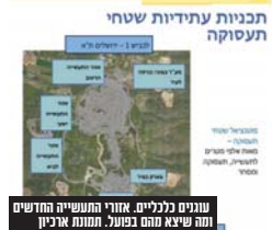
עונדים כלכליים. אחרי התעשייה החדשים וזה שיצא נחמד בשביל מתחילי ארזין