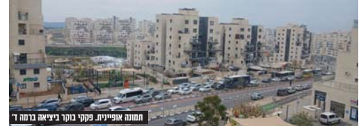
מחנה אופייני, פקקי בוקר ביציאה ברמה ד'

ומה הם ארבע העצות שמעלים את התושבים בכדי להתמודד מול עומסי התנועה בשכונה