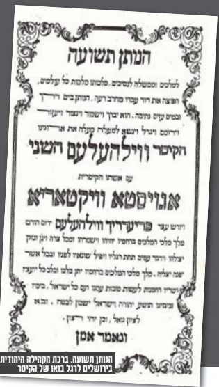
הנתן תשועה. נרבת הפקידה היהודית בירושלים לרגל בואו של הקיסר

כשהגיע שטרייכר פנים אל פנים אל החבל, הוא נעץ שוב את עיניו לעבר הקצינים מנגות הברית, ולעבר שמונת הנציגים של העיתונות העולמית. הללו ישבו בשורה אחת ליד שולחנות קטנים ולאורך קיר הגדוד לפני הגרדומים. באש שאה שבערה בעיניו הסתכל שטרייכר אל עדי הראייה ועקק. חג פורים 1946!