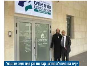
יקים את השדולה החדש. קאפ עם מנן משה אבנובול

בכל מקרה, תהיה מניסה עוקפת, ומי שירצה לבוא יוכל לעשות זאת ממש. אני מאוד מקווה שלא נגיע לכך ושהשבת תישמר במלואה בכל מה שאינו קשור לפיקוח נפש."