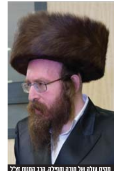
מקים עולה של תורה תפילה. הרב המנוח זצ"ל

דאג ושלם בדמים תרתי משמע לטובת הוולת והכל כמותן בסתר, שטח בשמחת הוולת ודאג לראות שהכל יהיה על הצד היותר טוב, כמו כן חיזק דאג לשיעורים ושיחות ממשפיעי אג"ש והפצת חיזוק תורה ויראה, חיזק רבים בתפילה כש"א אשר היתה מלאה התעוררות וכסופין לבורא כל עולמים. גם בתקופת חוליו לא רצה להטריח עד שהתחנן שלא יבואו לבקרו כי לא נח לו בטרחת הוולת, חבריו מכריו ובני משפחתו חשו את גודל צדקותו ואמונתו, גם במצבים קשים מאוד דיבר דיבורי אמונה והשמה אשר חיזק והפעים את כל הסובבים עמו.