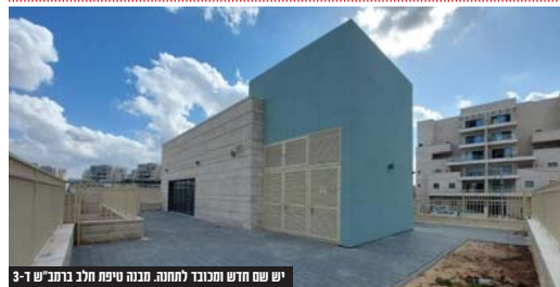
יש שם חדש ומכובד לתחנה. מבנה טיפת חלב ברמב"ש ד-3

ועדת השמות העירונית קבעה את שמות תחנות טיפת חלב בשכונות החדשות ע"ש רבנית גדולי הדור