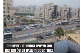
תחם תצפית התושבים שנושעים במתח הפקק תושבים גם על פתרונות

ביציאה מהשכונה לדברי התושבים: מדי יום שישו וכן במשך השבוע בזמן הוצאת התלמידים מהת"תים ובתי הספר ישנם פקקים הויים שמגיעים עד רמה ד'. הפתרונות כבר קיימים ורק הביצוע לא קורה בשטח ואנו שואלים עד מתי? הפתרונות שהתושבים מציעים בכדי להתמודד כראוי עם עומסי התנועה הם: א. פתיחת היציאה הנוספת מרח' אביי שזה יוריד הרבה מהעומס. ב. לחשוב על שינוי התנועה בחד סטוי שהבטיח תהיה מרח' רבא והיציאה מורבינא (ההפך ממה שקורה כרגע, שגורר לחסימה מוחלטת של התנועה לאלו שבאים לצאת מרמה ד' מהאמזורים). ג. לרדו בהקדם את פתיחת כביש היציאה מרחוב אביי? ד. להסדיר לאלתר את כלל הנתיגות ברמה ד' באופן שאינו חוסם את הנתיבים? אלו אם כן העצות שמעלים את התושבים בכדי להתמודד עם עומסי התנועה הכבדים שיש בשכונתם. אנו מעלים את העצות והרעיונות כפי שהעולים התושבים, יתכן ולאיש המקצוע יהיו פתרונות טובים יותר, אך מה שברור הוא שהגיע הזמן לטפל בפקודת זו ולתת מענה לתושבי השכונה שנאלצים כיום לישורר זמן איכות מדי יום ביזמו.