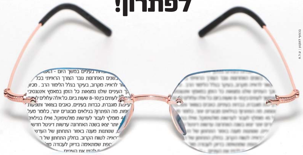
בכנסת | נתנים את הלב