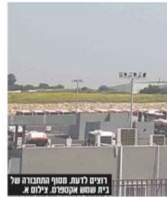
רציים לרשת. מסוף התחבורה של בית שמש אקספורט.

בשאלתה נכתב: "עם תחילת הרמדאן התחבורה הפנימית בבית שמש שגם כך לוקה בחסר ולא תותאמת לגודלה האמיתי של בית שמש כעיר המתקרבת ל-200,000 תושבים, צועדת מהפח אל