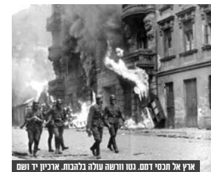
אין אל תחסי דמם. נטו ורשעה עולה בלכתוב. ארכיון די וסם

דברי אדונו הגר"א ז"ל מבוססים המה גם על דברי הגמרא במסכת מגילה (ו, א): "אמר רבי יצחק: מאי דרביב 'אל תתן ה' נאווו רשע וזממו אל תפק'. אמר יעקב לפני הקב"ה: 'רבונו של עולם! אל תתן לעשויו הרשע תאוות ליבו, וזממו אל תפק'." זו גרמניה של אדום, שאלמתי יוצאון, מחורבין כל העולם כולו. ימינו הם 'ספק עמלק', ומשכן אינו רוצה לברך עליו ברכה בשם ומלכות, אמר הגר"ה ווננפלד זצ"ל.