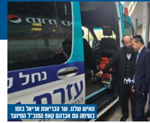
האיש שלנו, שר הבריאות אריאל בנום נשיחה עם אנדרסן קאפ המנכ"ל המיוחד