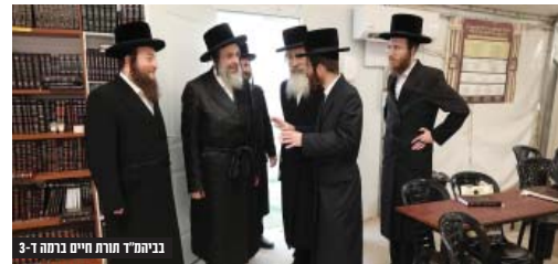
בביהמ"ד תורת חיים ברמה ד' 3

לפאר ולרומם: בביהמ"ד 'תורת חיים' ברמה ד' 3 ביקור בוק קיים הרה"צ שליט"א במתחם ביהמ"ד הזמני 'תורת חיים', שם קיבלו את פניו מרא