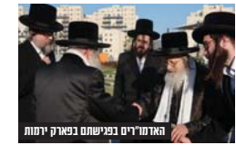
האדמו"רים בניעט בפקוד ירונה

בביקורו נועד עם אחיו כ"ק אדמו"ר מקאליש שליט"א