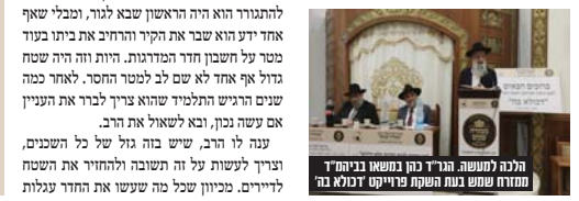
הלכה למעשה הגר"ד כהן במסגרת בביהמ"ד ממזרח שמש בעת הפקת פרויקט 'זנבא בה' משרד חינוך