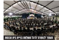
מעמד לגומרה לרגל השלמת בניית בית הכנסת

ביום שבת, קודם התפילה, התאספו מאות ילדי תשב"ר ל"חברת תהילים" בראשות הרה"צ שליט"א, שנשא בפניהם דברים נרגשים ונוגעים ללב. תפילת שחרית נערכה ברוב עם, כאשר הרה"צ ניגש לפני תנכוד