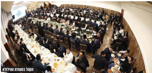
הקהל בסעודת הילולא