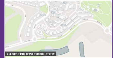
יש זוכים, המתחמים שיצאו למכרז ברמה 2-