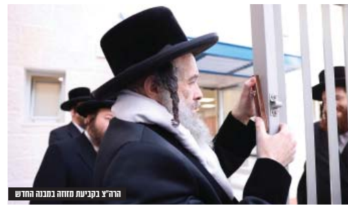
הרה"צ בקביעת מזוזה ומבנה החדש

המעמד הסתיים בקורת רוח מרובה, ובשמחה גדולה על ההתפתחות האדירה בכל ענייני קהילתנו הק' ברחבי העיר.