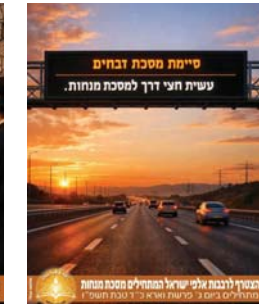
המגיד לרבנות אומנין ישראל המהמיר"ם מסכת מנחות