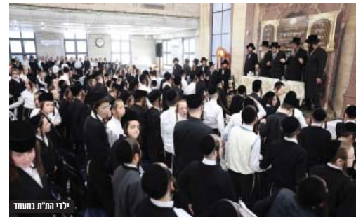
ילדי הת"ת במעמד