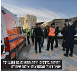
הירות בדרים יזית האנהנה בה נפגע ילד צעיר בשד המוראים.

ח"כ אבוטבול אמר לחברי הוועד כי הגוש קרוב ללב, ובתקופת היותו סגן שר היה שותף לתוכן שהוביל של החקלאות אבי ויכטר לשנות את שם המשרד 'משרד החקלאות ובסחון המון', 'ביסוס הענף החלב הישראלי הוא אחד מעמודי שורת