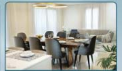
מבחר שולחנות וכסאות