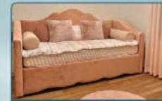
מבחר מיטות בד