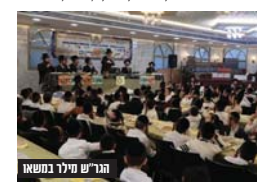
הגר"ש טילר במשאו