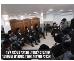
שפוחים לעורה. אברכי נילוא לצד אברכי תולדות אהרן במסגרת שעשועי