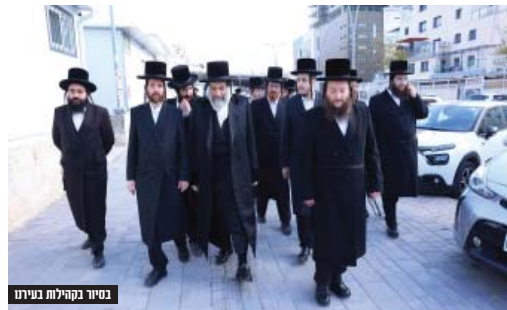
נסיון בקהילות בעירנו