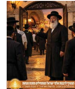
המגיד לרבנות אומנין ישראל המהמיר"ם מסכת מנחות