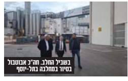
משרד העלייה והקליטה והסוכנות מפרסמים את תנאי העלייה לשנת 2025. מתגוננים עולה כי השנה התאפיינה ביציבות יחסית במספר העולים שהגיעו לישראל בעל המלחמה, לצד התחזקות נמגנת העלייה של צעירים ממדינות המערב וגדול משמעותי בקצב העלייה ממדינות המזרח התיכון.

לאחר סיוור במחלבה, נערך מפגש במהלכו ביטוינו של החלב. ח"כ אבוטבול נסיר במחלבה בתל יוסף