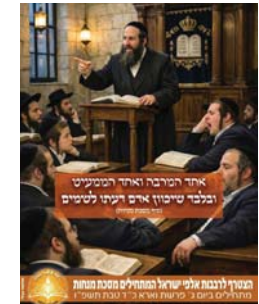
המגיד לרבנות אומנין ישראל המהמיר"ם מסכת מנחות

ביום שלישי הקרוב כ"ד טבת מתחילים בלימוד מסכת מנחות, והו חזן לקראת לכלל ישראל להצטרף לשיבה העולמית של לומדי הדף היומי.