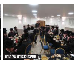
חסיבה לנבורה של תורה

המסגרת בבית שמש מתקיימת מדי יום בשבייל "בית צבי" חסידיו בעלוא. כעת, לוגל הניכסה לפרק השי' יום טוב, באו והתאספו חברי המסגרות לפנה"צ ואחרי הצהריים ליום עיון מיוחד ותועלתו שהתקיים באולם ביישוב 'שעל' כרווח להתבונן בין פרטיה לצד גיבוש איחוד כוחות והמוחות לקראת המשך הדרך בייסעא דשמאי. שלחנות ערוכים קידמו את הלומדים, כאשר מייסד המכלל הר"ג יוסף לוריא שליט"א קידם את פני כלל הלומדים בדברי הערכה והערגה. לאחר מכן התקיים שיחה מרתקת ומעילה בעניין