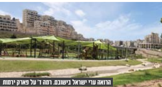
הרואה עירי ישראל יבשום. רמה 1 על פארק יסמות

בחרש המצב מורכב, כאשר במתחמים החילונים לא הייתה כמעט התמודדות וכויה, ואילו בשני המתחמים שיועדו לציבור החרדי וכה קבלן לא חרדי. התאמצנו באמת ועסקנו חרש (במיוחד הרח"ה ר' קדיש איינר הצדיק מ'תולדות אהרן') הצליחו להתמודד במחיר הגיוני ואו הגיע קבלן לא חרדי והגיע סכום אסטרונומי של עשרות מיליונים מעל כל ההצעות וכה בכל הקופה. העסקנים כבר נפו אליו אתמול בבקשה לשכנעו להקים במקום שכונה חדשה אך הוא אינו מחוייב.