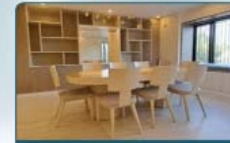
מבחר פינות אוכל