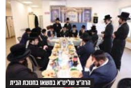
הרה"צ שליט"א במשאו בחנוכה בבית