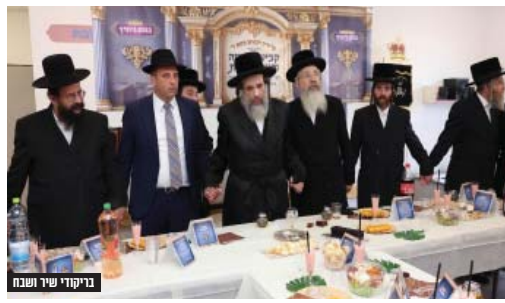
בריקודי שיר ושבח

ובחינת 'מוסיף והולך' זו מייחלים אנו בס"ד להשלים את הצרכים המרובים של קהילתנו המעטישה בהתפתחות בקצב ענקי ב"ה, להיכנס למבנים מקיפים גם עבור הת"ת ברמה ד' וגם עבור ביה"ס לבנות בשכונה זו. ולצד כל אלו כמובן להמשיך בעשייה הברוכה בשכונת רמה ב', ולקדם במהירות את תכנית בניית