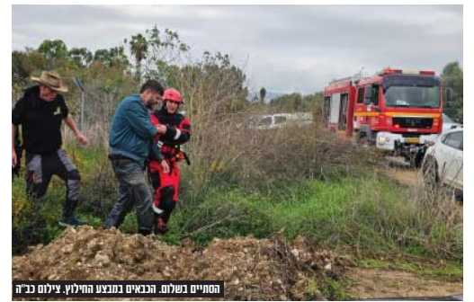
הסוסי נשלחו. הכבאים במצב החילוץ.

כאשר עומק המים מוערך בכ- 1.60 מטר והזרם חזק, על פי דיווחי דוברות יחידת להבה, הלכוד מצליח להתחזק כעמוד בזכות אחיזתו בענפים, בעוד שהמים וזרמים סביבו בעוצמה". לאחר שבמצב החילוץ הסתיים בס"ד בהצלחה, פרסמה דוברות כבאות והצלה כי "יחידת להבה, בשיתוף צוותי כיבוי והצלה מתחנות מרחב בית שמש חילצו לפני מספר דקות את האדם אשר נפל למים סמוך לנחל שורק. בעת שרכב על סוס נפלו השניים, הסוס הצליח לעלות ואילו הבחור אשר נפצע בעת הנפילה, נאחז בענף ולא הצליח לחלץ את עצמו. "כאמור הוא חולץ ע"י מלחצי היחידה אשר משמשים גם כתובעים ומעניקים לו טיפול רפואי בשטח, לפני העברתו למחוזת הרפואה". במסגרת העדכון אף דווח כי "צוותי החילוץ פעלו בדיווח רב לחלץ את האיש מהמים הסוערים תוך הימנעות מסיכון נוסף".