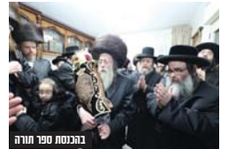
בכנסת ספר תורה