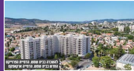
להשגה בנית שמש, הדמיית פרויקט החדש בנית שמש, הדמיית ארקאטקט