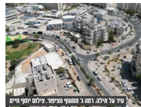
עיר נען חילה. רמה 2 מתממך הציבור.

המתחם השני שיוצא לרוך נמצא בהרצליה, שכונה חדשה יהולמו ברוגפמן בשפות עם חברת פית' החובטים במכרז מסדרה הקמת שכונה ברוקף בניו משמעותי ומעורבת צעירים. עלו ובנו!"