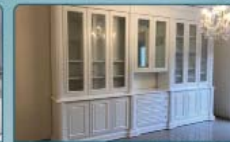
מבחר ארונות ספרים