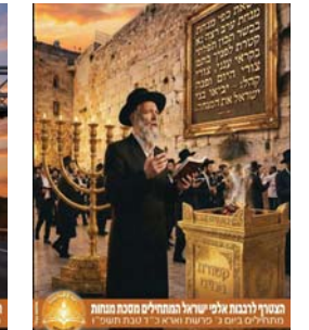
המגיד לרבנות אומנין ישראל המהמיר"ם מסכת מנחות