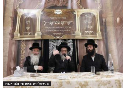
הרה"צ שליט"א במשאו בפני תלמידי הרה"ח