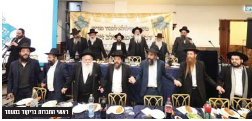
ראשי החבורות בריקוד בסעודת