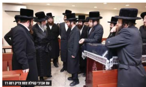
עם אברכי קהילת צמח צדיק רמה ד' 1