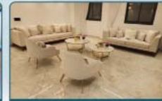
שולחנות קפה / צד