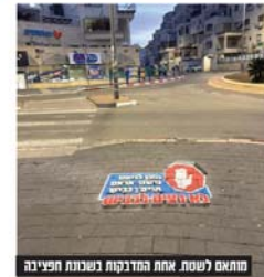
התאם לשטח. אחת המדבקות בשכונת חפציבה