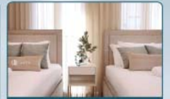
מבחר שידות וקמודות