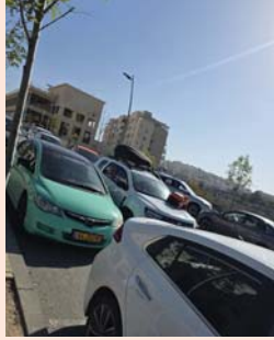
הכל תקוע תאונה קלה ברובע ברמה א' שיתקה את חיי המסחר.