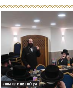
אין אחד לא ידעת תורה

בתכנית מתקדמים בכל שבוע בדף גמרא, הנלמד ארבעה פעמים, ולאחר מכן הוסיפו בחידוד ותמצות הדף היטב עד שראו שתלמודם בידם