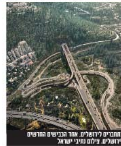
מתכננים לירושלים אחד הבניינים החדשים לירושלים.

התקציב של משרד התחבורה לשנת 2026 מתמקד בהחברת רשת הרכבות הקלות בירושלים הארבע