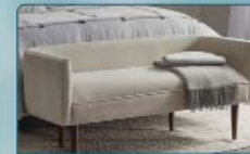
מבחר הדומים וספסלים