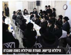
הילולא קדישא. סעודת הילולא בשנה שעברה

בביהמ"ד דינוב בשכונת חפציבה בקהילת דינוב בשכונת חפציבה מציינים בהתרגשות כי במוצאי שב"ק הקרוב, כ"ב טבת, תתקיימו סעודת הילולא לרגל יואנו הילולא קדישא של הרה"ק ר' יחיאל מיכל מולאטשוב נתני זי"ע, וקונו של הגר"צ רב בית המדרש שליט"א, אשר היה דבוק אדיו והיה חביב אצלו כבבת עינו, ואף הבטיח שכל מי שיתפלל בביהמ"ד יקבל חיזוק בעבודת השי"ת ויביראת שמים. במהלך הסעודה ישמעו עובדות וספורים מבעל הילולא מרבנים ומשפיעים שהסתופפו בבלו, משא המרכזי ידווש הגר"צ א"ד שליט"א. כמו כן, במהלך הסעודה יעלה גם את משנתו הטהורה של הרה"ק בעל בני יששכר זי"ע, לרגל יום הילולא שחל ביום ח"י טבת, ונחמת העצרת שנקראה ע"י גדולי הדור ביום שלישי השבוע, לא התקיימה סעודת הילולא.