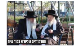
האדמו"ר שליט"א בסוד

במשך שעה ארוכה, במהלכה התגלה שיחה דבריה תורה וחסידות. הגדולה שרואים כיום בבית שמש כעיר של תורה וחסידות, ואנו כי בית שמש הוא דוגמא ומפת גם לערים אחרות אין להקים שכונות כדרך התורה והחסידות.