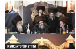
הרה"צ שליט"א בנשא