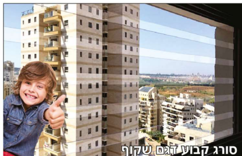
סורג קבוע דגם שקוף

מבצע! סורג קבוע ישר דגם סייפטי החל מ- 444* ש"ח למ"ר כולל מע"מ, הובלה והתקנה!