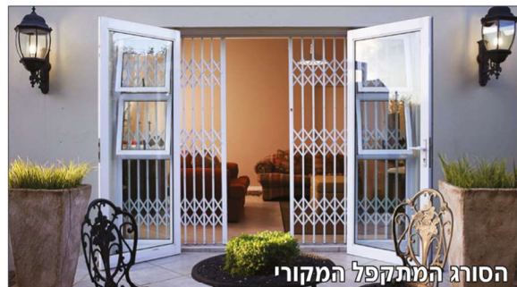
הסורג המותקפל המקורי