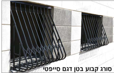
סורג קבוע בטן דגם סייפטי