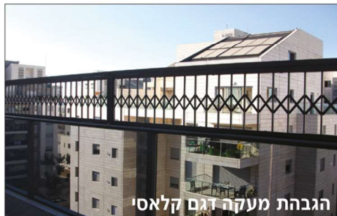
הגבהת מעקה דגם קלאסי

מבצע! סורג קבוע ישר פס חיצוק החל מ- 429* ש"ח למ"ר כולל מע"מ, הובלה והתקנה!