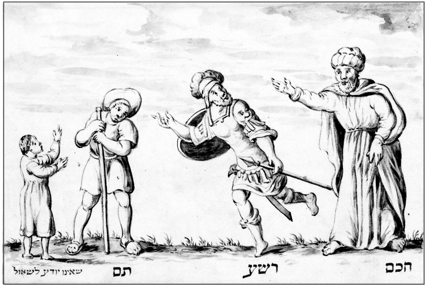
שאינו יודע לשאול