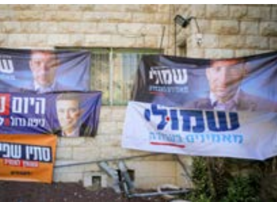
▲ העתירה נמשכה. פריימריז במפלגת העבודה

הבמה הפוליטית ולהחזיר את האמת לפוליטיקה. אני קוראת לכל חברות וחברי המפלגה, עזבו את המשחקים והעסקנות הפוליטית בצד ותנו רוח גבית לתקומתה של המפלגה. מפלגת העבודה חזקה, מחודשת ואמינית תהיה שחקנית משמעותית בבנייה מחדש של המחנה שלנו”.