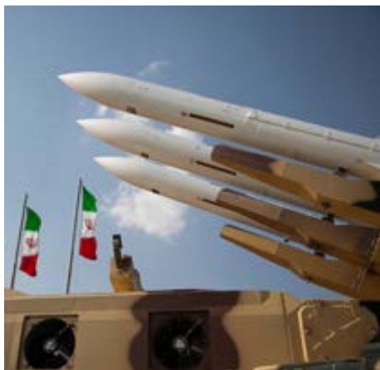
▲ ניסוי ראשון בירי טיל טורפדו. טילים איראניים

במקביל, כלי תקשורת רשמיים באיראן דיווחו אתמול כי היא ערכה ניסוי ראשון בירי טיל טורפדו מצוללת, זאת כחלק מתרגיל ימי שנערך במפרץ עומאן. על פי הדיווח הניסוי בוצע בהצלחה.