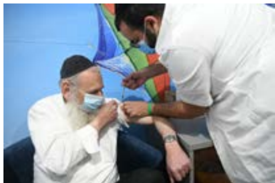
▲ קצב מואץ. מתחסנים אתמול

אתמול הגיעו ראש הממשלה בנימין נתניהו ושר הבריאות יולי אדלשטיין לרמלה, שם התקיים