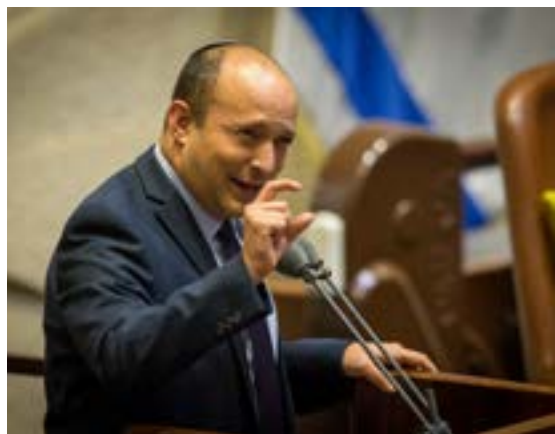
▲ יורה לכל הכיוונים. בנט

נפתלי בנט, הצונח בסקרים, ממשיך לירות לכל