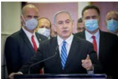
▲ רגישות ציבורית. נתניהו בבית המשפט

אשר במוקד החלטה זו נודעת רגישות ציבורית רבה, שאינה נובעת דווקא מהסוגיות המשפטיות המתעוררות בהם, כי אם מהחשדנות הרבה האופפת אותם. כפי שציינתי לעיל, חשדנות זו באה לידי ביטוי אף בהתנהלות באי-כוח הצדדים ובטענותיהם, אולם לא מצאתי כי יש לה יסוד. לנוכח רגישות ציבורית זו, מצאתי לנכון לדון בפירוט בטענות העוררים, באופן החורג מהנהוג במסגרת ערר על החלטה בבקשה למסירת חומרי חקירה.