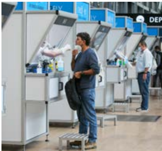
▲ בידוד לחוזרים מברזיל. בדיקות קורונה בנתב"ג

בשלב זה, הבהירו החוקרים - בהם פרופ' ינון אשכנזי, פרופ' דורון גזית ופרופ' נדב כץ ממכון רקח לפיזיקה, לא ניתן לדעת בוודאות אם יש