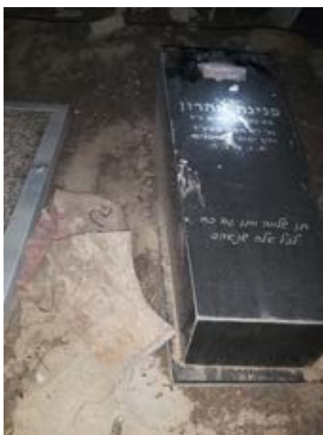
▲ ונדלזים מחפיה. מראות ההרס בבית העלמין

והועבר לחקירה בתחנת המשטרה בערועה. המשטרה המשטרה להאריך את מעצרים. מהחקירה עלה כי ככל הנראה ישנם מעורבים נוספים ונערכות פעולות לאיתורם ומעצרים.