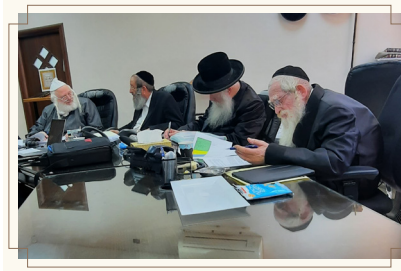
רבני ועד הכשרות בשיבה היומית בו דנים על עניני הכשרות

כפי שכולנו מכירים ממלאכת הכנת הבית לפסח החל משלשים יום קודם החג או אפילו קודם לכן, אין זה דומה להכנות הקדחתניות בקצב מוגבר של השבוע האחרון של ערב פסח, כאשר ההתרגשות ניכרת בכל פינה.