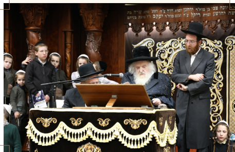
מרן רבינו מרא דארעא קדישא בד'רשת שבת הגדול תשפ"ה

"וכל מי שיש לו יראת שמים שיקנה מהכשר בד"ץ העדה החרדית, שזהו ההכשר הטוב ביותר, ודבר זה כבר ידוע בכל העולם שאם מחפשים 'מהודר', צריכים לבוא לבד"ץ העדה החרדית, שזה ההכשר בתכלית ההידור..."