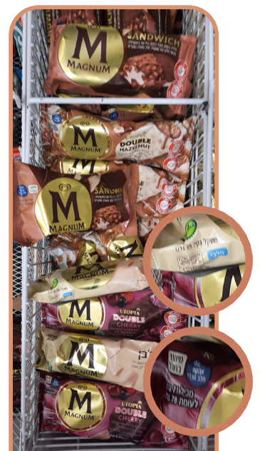
גלידות מגנום באותו מקרר אחד בהשגחת הבד"ץ והשני לאוכלי אבקת חלב נכרי