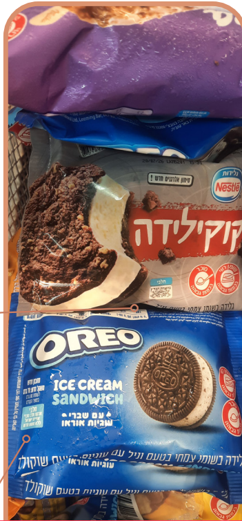
שימו לב! מקרר באחד מתחנות הדלק

ובגלל הזהירות, נזכה לסיעתא דשמיא, להינצל מכל מכשול.