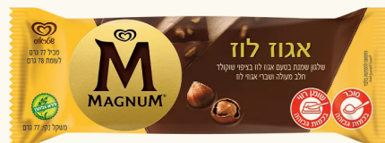
מגנום ייצור בארץ בהשגחת הבד"ץ