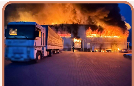
מפעל באוקריינא שהותקף ונשרף כליל

מסירות נפשם של משגיחי הבד"ץ בתפקידי הכשרות, מלווה אותם בארה"ק כמו בחו"ל, גם בימים אלה. על רקע המלחמה הנמשכת באוקראינה, זה קרה שוב בימים האחרונים, כאשר משגיחי כשרות שהו במפעל בעיר ויניצה באוקריינא לצורך השגחה, ובאחד הלילות היה התקפת טילים וכטבמים באיזור, ובה ניצלו בסייעתא דשמיא, ולאחר שסיימו את משמרתם ויצאו מהמקום לחזור לביתם בארה"ק, הותקף שוב האיזור שממנו יצאו בלא פחות מ-27 כטבמים ו-2 מפעלים באיזור נשרפו כליל ה"י.