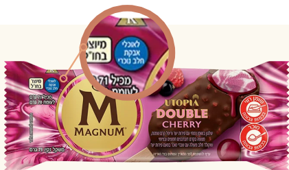
מגנום ייצור חו"ל עם אבקת חלב נכרי