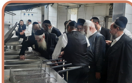
רבני ומפקחי ענף הקייטרינג בסניור באחד המטבחים בכשרות הבר"ץ

ובזמנים מעין אלה, כאשר עוברי דרכים מזדמנים למקומות מחוץ לבית, ומגלים מחד גיסא כי כשרות הבר"ץ התפשטה מעיה"ק ירושלים והגיעה לארבע כנפות הארץ, בצפונה כמו בדרומה, כן יתן ה' וכה יסיף. אך מאידך גיסא נפוצה התופעה של מטבחים ומעדניות הנושאים כיתוב "כל המוצרים בהכשר הבר"ץ" ממתבח בהכשר הבר"ץ וכדומה, אשר אנו צריכים להיות זהירים מפניה ביותר.