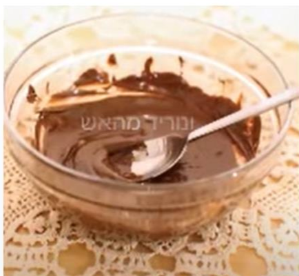
להמיס שוקולד במים רותחים