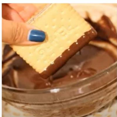
לטבול בשוקולד צד אחד ואת הפינות