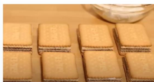
להניח וופלים בין שתי עוגיות