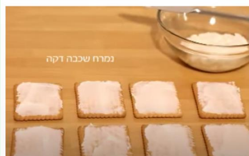
למרוח מעט חמאה על הביסקוויטים