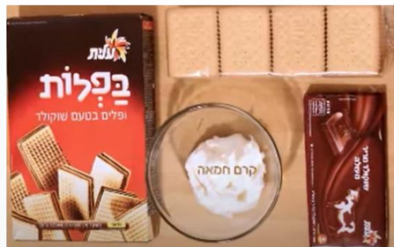
מצרכים: ביסקוויטים, שוקולד, חמאה, וופלים