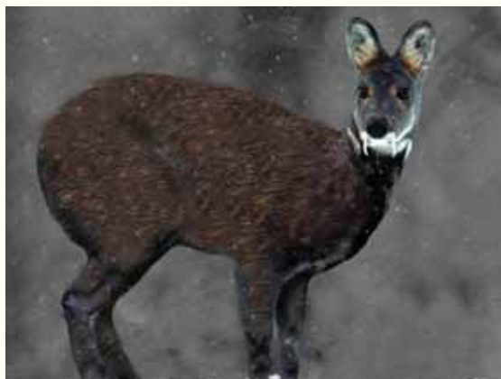
איל המושק. ניכרות רגליו הקדמיות הקצרות