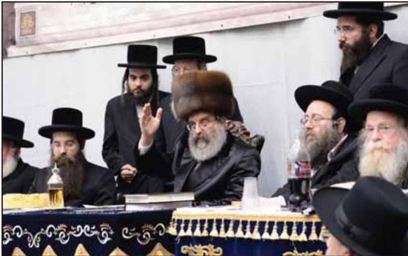
הרבי זצוק"ל במעמד כבוד התורה

והנה ביום ראשון בשעה אחת בלילה אני מקבל שיחת טלפון מוחץ לארץ, על הקו היה רבנו בכבודו ובעצמו,