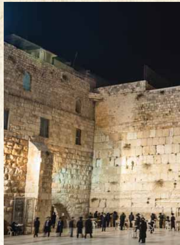
לעורר את הלבבות בחודש אלול. יהודים שופכים שיח בכותל המערבי בימי חודש אלול

ולהבין טעם עבודת 'אהבת ישראל' דווקא באלו הימים, נדרוש לשבח מעובדא דהוי אצל הרה"ק בעל ה'ישמח ישראל'