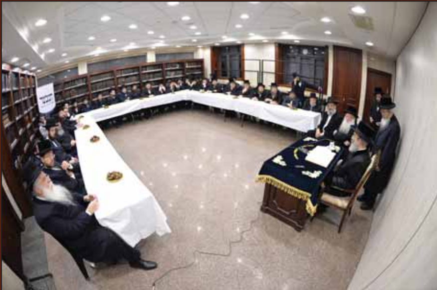
הרבי זצוק'ל נושא דברים לדרכו של עיתון בכינוס לסופרי 'המבשר' במעון קדשו י"ב חשון תשע"ח