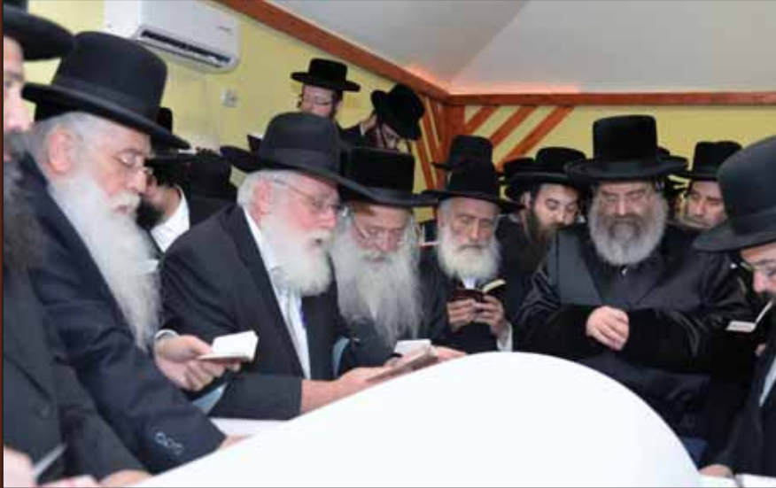
הרבי זצוק'ל במעמד חנוכת אוהל על ציונו של הרה"ק רבי אברהם המלאך ז"ע, במסגרת ועידת "שלומי אמונים" שנערכה באוקראינה

הרבי זצוק'ל ברוב טובו פקח עינו הטובה והקדושה על המערכת מיום הווסדה, זכתה מערכת 'המבשר' שהרבי זצוק'ל השפיע עליה ככל עת והודמנות והשמיע לה בהדר גאונו את דבר קדשו על חובתו ומטרתו של כלי מבטא ליהדות הנאמנה. גליון מיוחד לזכרו בו יבאו הנהגותיו ודרכיו בקודש - יופיע אי"ה