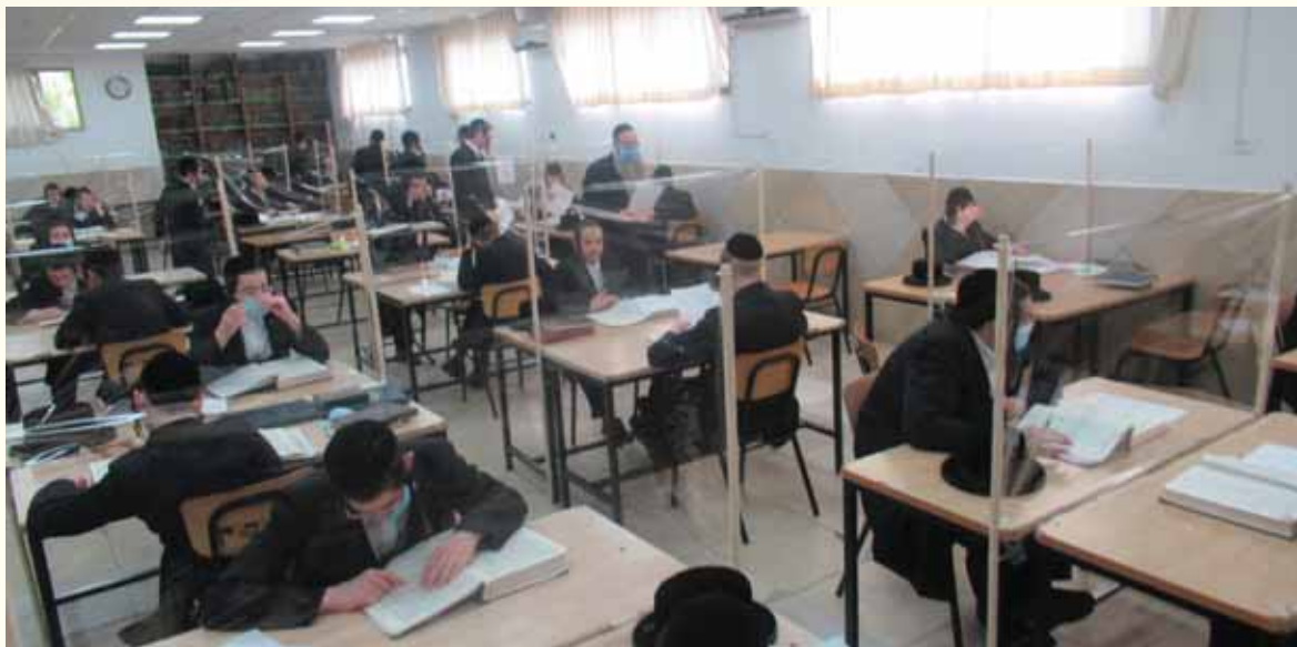
על הצוות החינוכי להשקיע במיוחד בזמן הזה. ישיבה ב"קפסולה"

יו"ר מרכז מחשבת על הישיבות הקדושות ב'שגרת קורונה'