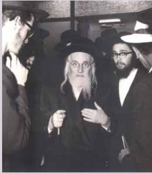
הרב מטשעבין ז"ע בכניסה לשיבתו

כמה ימים יצא מחדרו ונענה בהשלמה כי דרך לימוד זו היא אינה בשבילו.