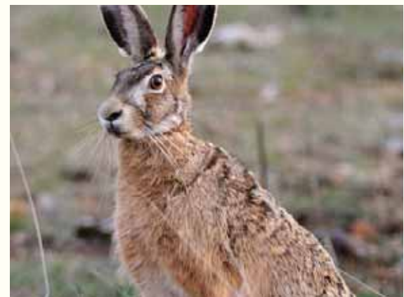
עליה גם דיברה התורה? הארנבת שבשפת זמנינו