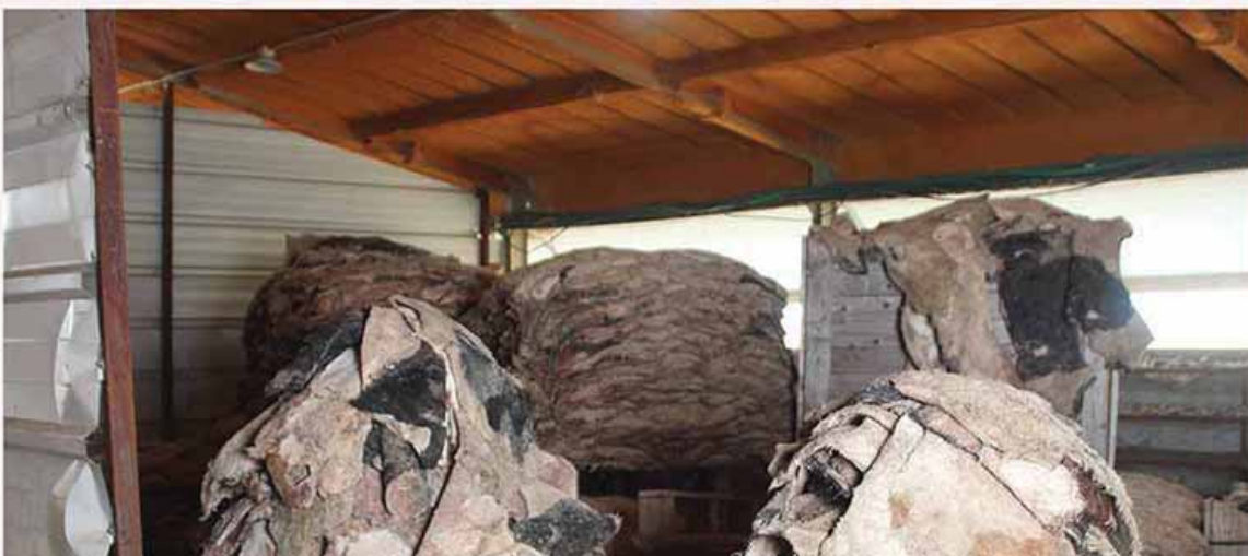
עורות שהניחו בני רבינו לייבש על התנור