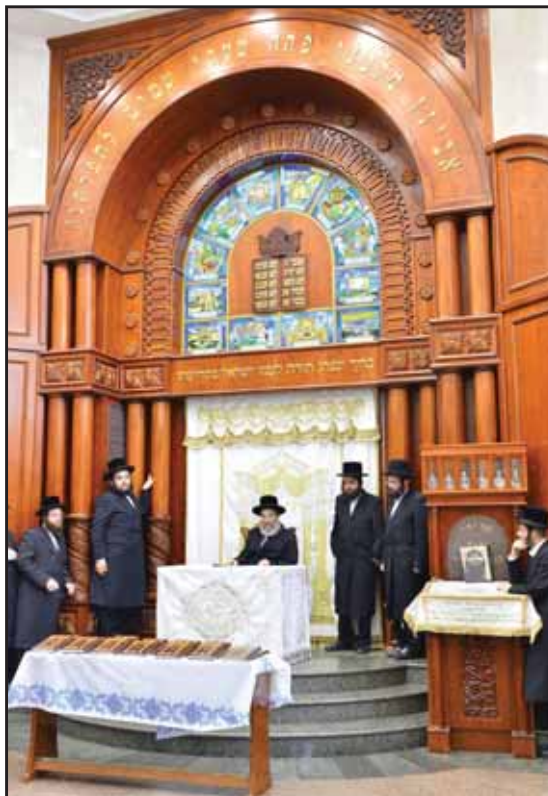
הרבי זצוק"ל במסיבת חומש