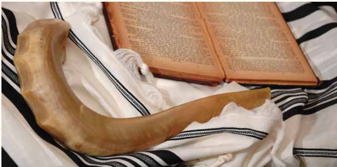
אלול. מילה שמרעידה לבבות

נוכח המגיד לראות שדבריו נופלים על אוזן קשובה, והמשיך באומרו: הבה אבהיר לכם כוונתי מפי מי יצאו דברים הללו. הנה כל ימות השנה אוסף השטן ומקבץ עומרים עומרים של עוונות למען יעמדו לו לקטגוריה ביום הדין, והוא טומנם ומניחם בבית