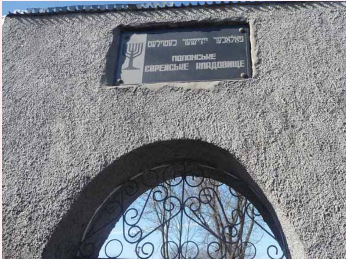
בשלט מופיע פ'אלאנער יידישער כענטרלעם' (כלומר 'בית העולם היהודי של פולנא'). שער בית החיים בפולנא

ליש"ו הנוצרי היה מבחר כינויים אצל היהודים, החל ב'אותו האיש' המפורסם, וכלה בכינויים מחמיאים פחות. התוספות במסכת חגיגה (סוף דף ד: ד"ה הוה) מכנים אותו בשם 'פלוני'. אינני יודע אם התוספות עצמם נקטו לשון זה, כי במקומות אחרים הם מזכירים במפורש את שמו של ישו ואינם חוששים.