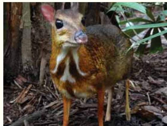
'חכמים מחוכמים'. אחד ממיני האיילונים