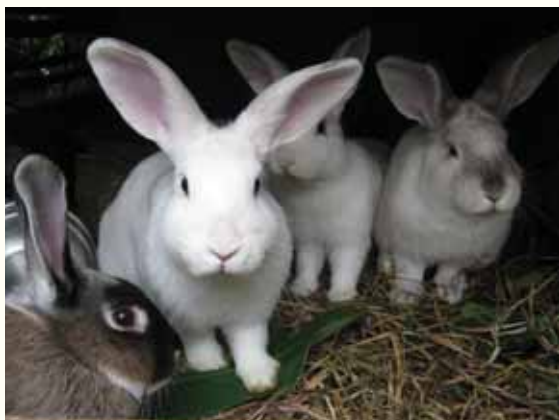
ה'ארנבון'. או שמא ה'שפן'

כאשר לצורך בפירוט הסימנים גם כן, מסיק רש"ד כי אכן, "ידיעת סימני הטהרה יש לה רק משמעות עיונית", כלומר