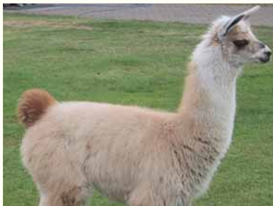
הלאמה. 'ארנבת' של התורה

יצוין, כי כרגיל, בעלי כל שיטה מביאים ראיות לשיטתם, כמו