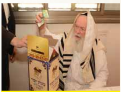
מרן עמוד ההוראה הגר"י זילברשטיין שליט"א