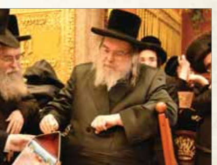
כ"ק מרן האדמו"ר מבעלזא שליט"א