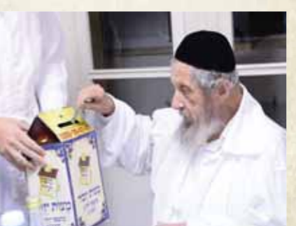
רבן של ישראל מרן הגר"ד לנדו שליט"א