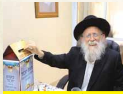
עמוד התפילה מרן הגר"ש גלאי שליט"א