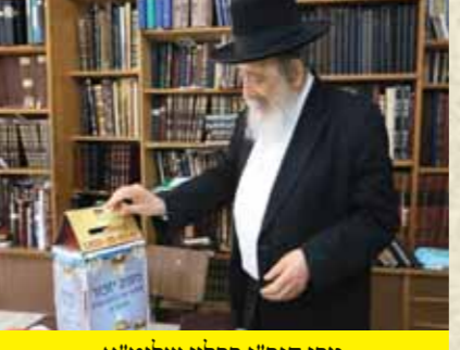
מרן הגר"י ברלין שליט"א