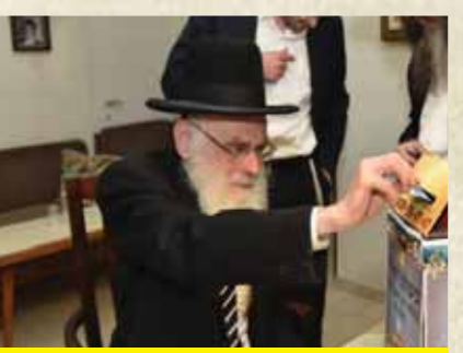
מרן ראש הישיבה הגרמ"י שלוינגר שליט"א