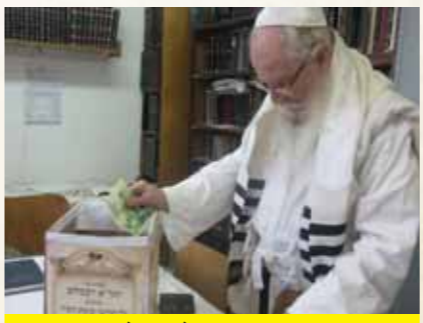
מרן הגר"א וייסבלום שליט"א