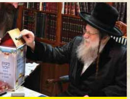
כ"ק מרן האדמו"ר ממודליץ שליט"א