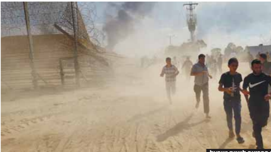
מאות אנשי חמאס חוצים את הגדר הפרוץ לשטח ישראל

הממשלה בנימין נתניהו, וקיבל ערכון אודות המצב הבטחוני. בשיחה, הועלתה האפשרות להקי' מת ממשלת חירום. לאחר הפגישה כינס גנץ את בני גנץ, נפגש אמש עם ראש