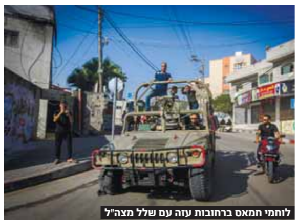
לוחמי תמאס ברחובות עזה עם שלל מצה"ל

במסגרת מתקפת הטרור, פגעו חמושים גם במבנים ציבוריים ובמכוניות. בין הנפגעים נמנו גם כלי רכב פרטיים, מכוניות חירום ומכוניות משטרה. במהלך המתקפה, פגעו חמושים גם במבנים ציבוריים ובמכוניות. בין הנפגעים נמנו גם כלי רכב פרטיים, מכוניות חירום ומכוניות משטרה. במהלך המתקפה, פגעו חמושים גם במבנים ציבוריים ובמכוניות. בין הנפגעים נמנו גם כלי רכב פרטיים, מכוניות חירום ומכוניות משטרה.