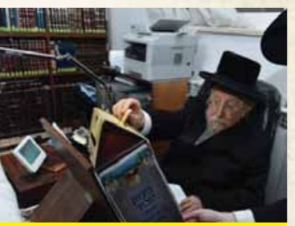
כ"ק מרן האדמו"ר מביאלא שליט"א