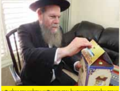
עמוד צלותהון ישראל מרן הגרמ"ש אדלשטיין שליט"א