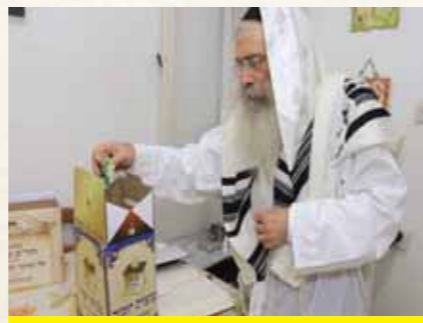
מרן הגר"ש שטינמן שליט"א