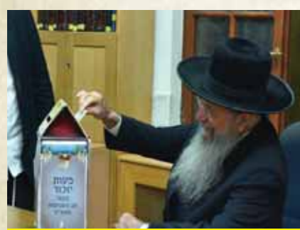
מרן הגר"י הלל שליט"א