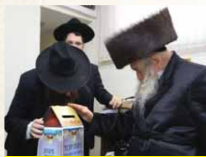
כ"ק מרן האדמו"ר מטשערטוביל שליט"א