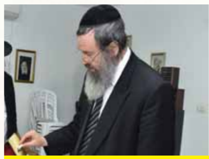
מרן ראש ישיבת חברון הגר"ד כהן שליט"א