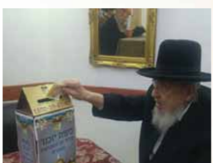
מרן זקן ראשי הישיבות הגרמ"מ אורחי שליט"א