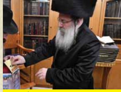
כ"ק מרן האדמו"ר מגדבורנה שליט"א