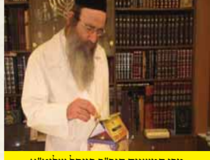
מרן המשגיח הגר"ב פינקל שליט"א