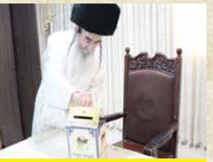
כ"ק מרן האדמו"ר מאלכסנדר שליט"א