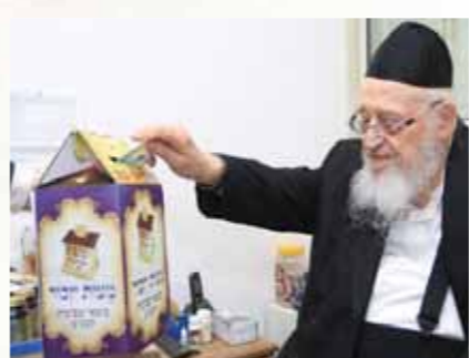
מרן ראש הישיבה הגרמ"צ' ברמנן שליט"א