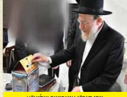
מרן הגר"י אונגרשר שליט"א