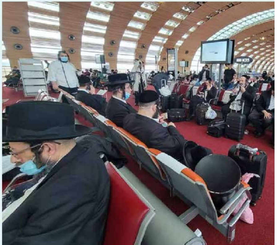
אנ"ש בשדה התעופה בפריז ערב שבת כי תצא

הייתה לנו עוצרה בפריז. שם כבר קיבלנו ידיעות ברורות שבקייב מכניסים רק אוקראינים. כולם נשברו לרסיסים. חלק רקדו כדי להמתיק הדינים, חלק בכו בדמעות והתפללו.