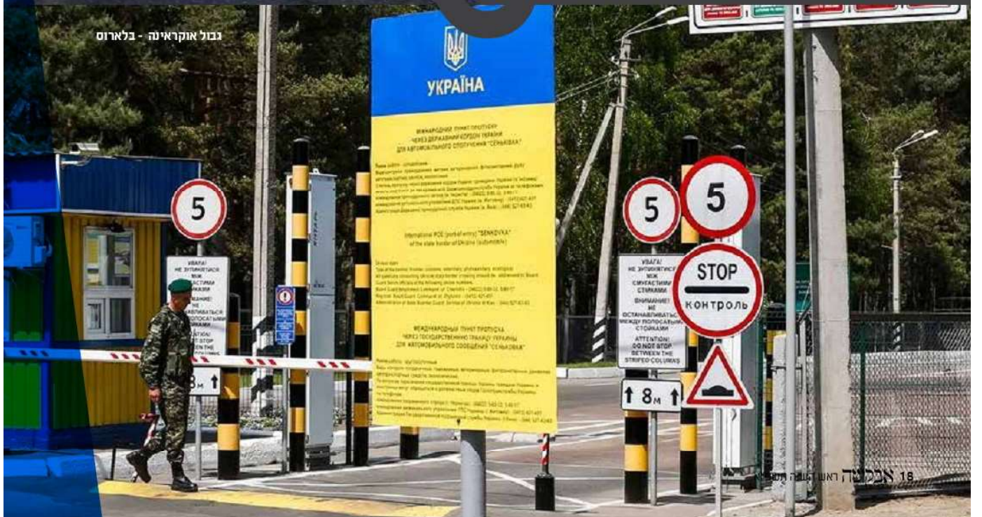
גבול אוקראינה - בלארוס

האחדות המופלאה, קול התורה שנשמע ברמה, נסיעות לשדה מדי חצות לילה, נחלי הדמעות שנשפכים כנחל במנייני התהלים, גמילות החסד שמתגלית במלוא תפארתה הצצה להתקבצות אנ"ש במדינת בלארוס שבת ולהמתין על הגבולות עד ישיקף וירא ה'