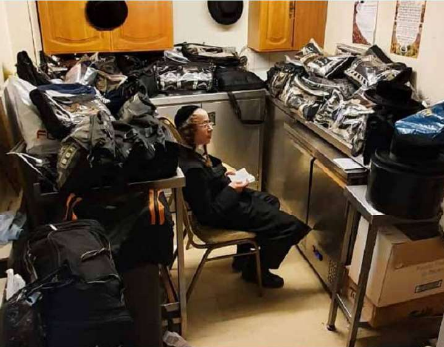
בית הכנסת ברסלב בלונדון

ביום י"ט אלול חל יומא דהילולא של אחד מגדולי בעלי התוספות, הרב רבינו יעקב