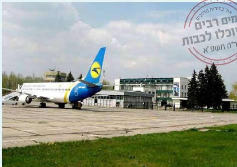
שדה התעופה על רקע ההאנגר בו הוחזקו כעצורים

ברוך ה' הטיסה עברה ללא תקלות מיוחדות, רק הפחד והחרדה ליוו אותנו מכל צד. היו