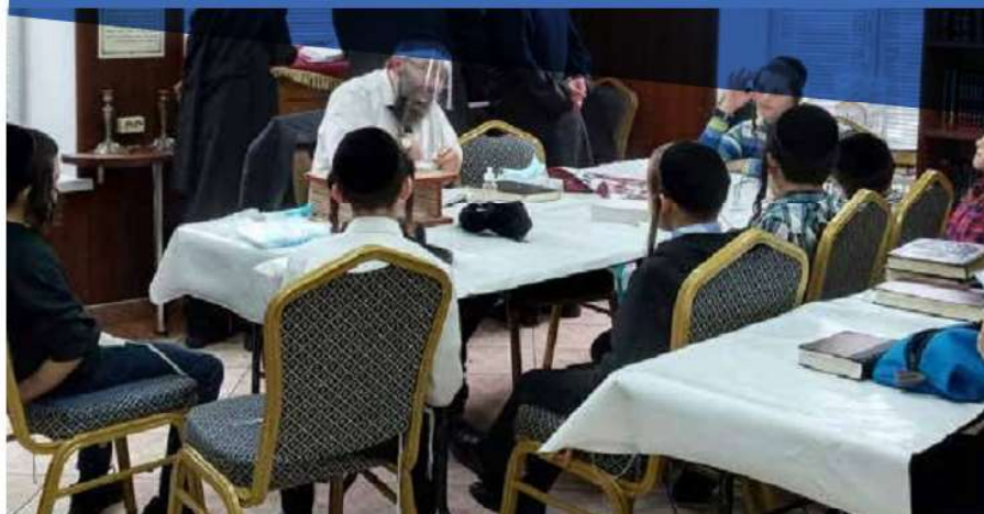
הרב פימה בלימוד עם ילדי החמד

אדמור"י קרלין לדורותיהם. במרחק דקות ספורות שוכן קברו של הרה"ק ר' אהרן הגדול מקרלין זיע"א, כאשר בצוק העיתים לא נשאר כל שריד וזכר למצבה עצמה. אפילו שלט אין כאן, ואם לא המסורת המקובלת העוברת מדור דור - לא היינו יודעים כלל שבין שתי העצים העבותים הללו שוכן ארון קדשו.