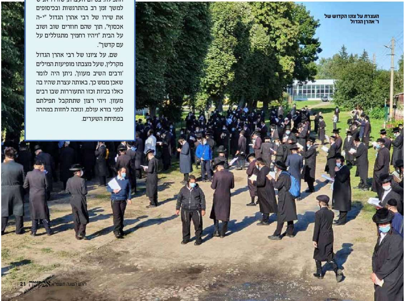
העצרת על צונו הקדוש של ר' אהרן הגדול

בשבת התקיימו התפילות והסעודות בשלושה מוקדים, בית הכנסת המרכזי, בית הכנסת הישן, ובית הספר לבנות.