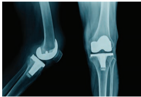
במטרה להכניס מבחינה שרירית, עורית ופסיכר-לוגית לקראת ההליך. הניתוחים בוצעו בהובלת

לצורך ליווי והטמעת הידע הוזמנו לישראל שלושה מומחים בינלאומיים, בהם מובילי התחום בפיתוח השיטה בעולם. בנוסף לפעילות בחדר הניתוח, השתתפו האורחים בפעילות המרפאה הרב-תחומית לקטועי גפיים, שם נבדקו מטופלים עם אתגרים מורכבים של כאב, מגבלות תפקודיות וסיבוכים ולכל אחד מהם הותאמה תוכנית טיפול אישית.