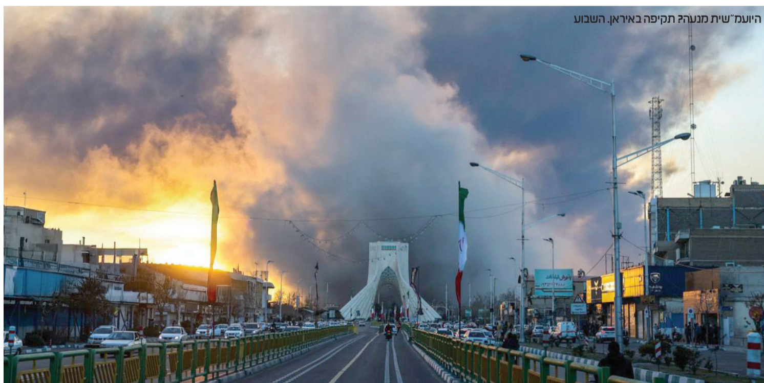
היועמ"שית מנעה תקיפה באיראן. השבוע