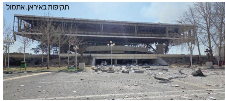
תקיפות באיראן. אתמול

משרד ההגנה של כחריין מסר אתמול כי כוחותיו יירוטו 75 טילים בליסטיים איראניים. כמו כן, הוא דיווח