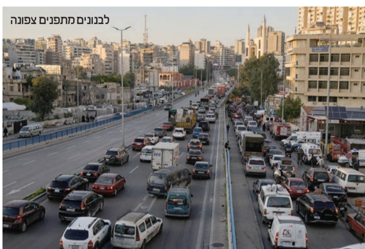
לבנונים מתפנים צפונה

המחבל עסק בקידום מתווי טרור על מנת לפגוע באזרחי מדינת ישראל, בחיילים ופעילותו היוותה איום על ישראל ואזרחיה.