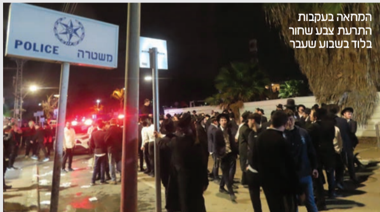
המחאה בעקבות התרת צבע שחור בלוד בשבוע שעבר

"באותה מידה יכל גם המימסד הפוליטי החרדי ליצור אווירת תמיכה המונית כזו ביחס לכלל בני הישיבות, ובפרט שמדובר בציבור המגדיר עצמו כ'מיניסטרים' ואשר מהווה פוטנציאל מספרי גדול יותר, אלא שהנהגתו הפו-ליטית דורשת ממנו להבליג לנוכח חילול התורה והצעדים המרושעים, ולאחר מכן באה בטענה הצינית כי 'אין ברירה' וצריכים להשלים עם החוק ההרסני", סיימו.