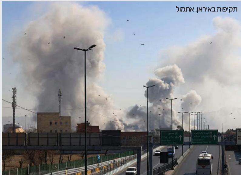
תקיפות באיראן. אתמול

הושמדו למעלה מ-300 משגרי טילים • איראן שיגרה טילים לנתב"ג; מטוס אל-על שב על עקבותיו