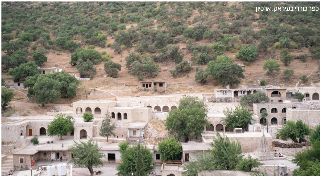
כפר כורדי בעיראק.

בתדרוך לכתבים מוקדם יותר ברביעי בערב, דוברת הבית הלבן קרוליין לויט הכחישה את הדיווחים שארה"ב תעניק תחמושת לכורדים. "הנשיא קיים שיחות רבות עם שותפים, בעלי ברית ומנהיגים באזור המזרח התיכון. הוא אכן שוחח עם מנהיגים כורדים בנוגע לבסיס שיש לנו בצפון עיראק, אבל כל דיווח שמרמז שהנשיא הסכים לתוכנית כזאת (של חימוש הכוחות) הוא שקרי לחלוטין", אמרה נחוצות.