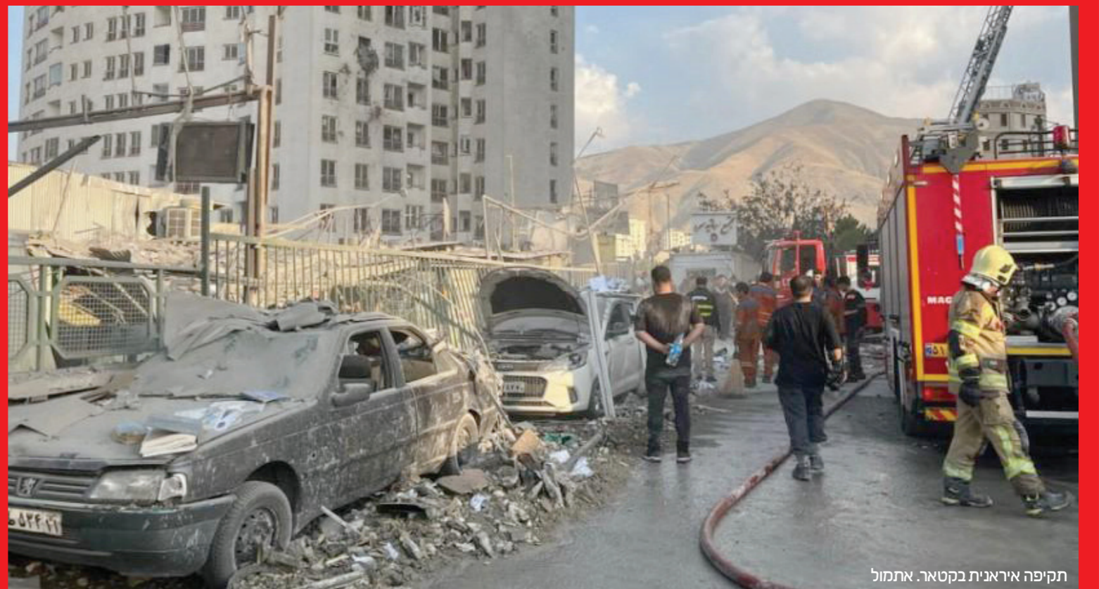
תקיפה איראנית בקטאר. אתמול

מדינות אירופה מתארגנות לתמיכה בקפריסין המותקפת ולאבטחת נתיבי השיט בים סוף ובתעלת סואץ • מזכ"ל נאט"ו מביע תמיכה במלחמה • עמ' 3