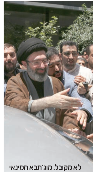
לא מקובל. מוג'תבא חמינאי