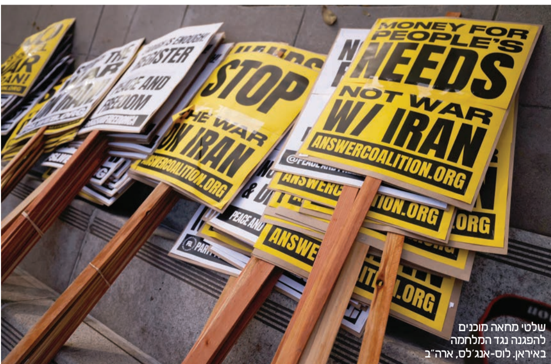
שלטי מחאה מוכנים להפגנה נגד המלחמה באיראן. לוס-אנג'לס, ארה"ב

"דונלד טראמפ אינו מלך, ואם הוא מאמין שהמלחמה עם איראן היא לטובת האינטרס הלאומי שלנו, אז הוא חייב לבוא לקונגרס ולהציג את טיעוניו", אמר חבר הקונגרס גרגורי מייקס, הדמוקרט הבכיר בוועדת החוץ של בית הנבחרים.