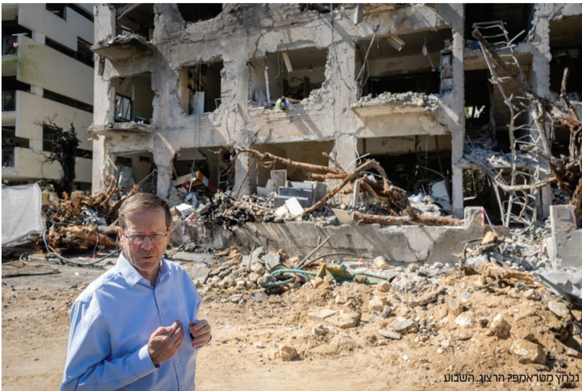
נלחץ מטרומפ? הרצוג: השבוע

למען הסדר הטוב, וכפי שהובהר בעבר כבר כמה פעמים - ישראל היא מדינת חוק ריבונית, ולפיכך בקשתו של ראש הממשלה נמצאת על פי הכללים במשרד המשפטים, לקבלת חוות דעת, ולאחר סיום התהליך נשיא המדינה יבחן את הבקשה על פי החוק, טובת המדינה, לפי צו מצפוני וללא כל השפעה מלחצים חיצוניים או פנימיים כאלו או אחרים."