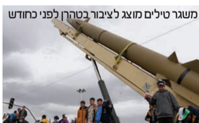
משגר טילים מוצג לציבור בטהרן לפני כחודש

הנתונים על כמות הטילים שאיראן שיגרה לעבר ישראל פורסמו אמש והם מצביעים על מגמת ירידה דרמטית בהיקף השיגורים בימים האחרונים. לפי הנתונים שפורסמו ב"ישראל היום", ביום הראשון למערכה, 28.02, זוהו כ-90 שיגורים לעבר ישראל. יומיים לאחר מכן, ב-01.03, נרשמו כ-60 שיגורים. כבר למחרת נרשמה ירידה נוספת, כאשר מספר השיגורים צנח לכ-30. ב-03.03 דווח על כ-20 שיגורים בלבד, ואמש ירד המספר לפחות מ-20. למרות מגמת הירידה בירי מאיראן, בפיקוד העורף מזהירים כי ייתכן שהלחימה תתרחב דווקא מכיוון הצפון. בצבא מעריכים כי חיזובאללה, ששומר על יכולות ירי בהיקפים נרחבים ומשלב גם כטב"מים, עשוי להעלות את רף האש בימים הקרובים. בנוסף נערכים בצבא גם לאפשרות של הצטרפות החות"ים למערכה. אף שהתומן שלהם אינו ודאי בשלב זה, ההערכה היא כי בידי הארגון קיימות יכולות להצטרף ללחימה בכל רגע.