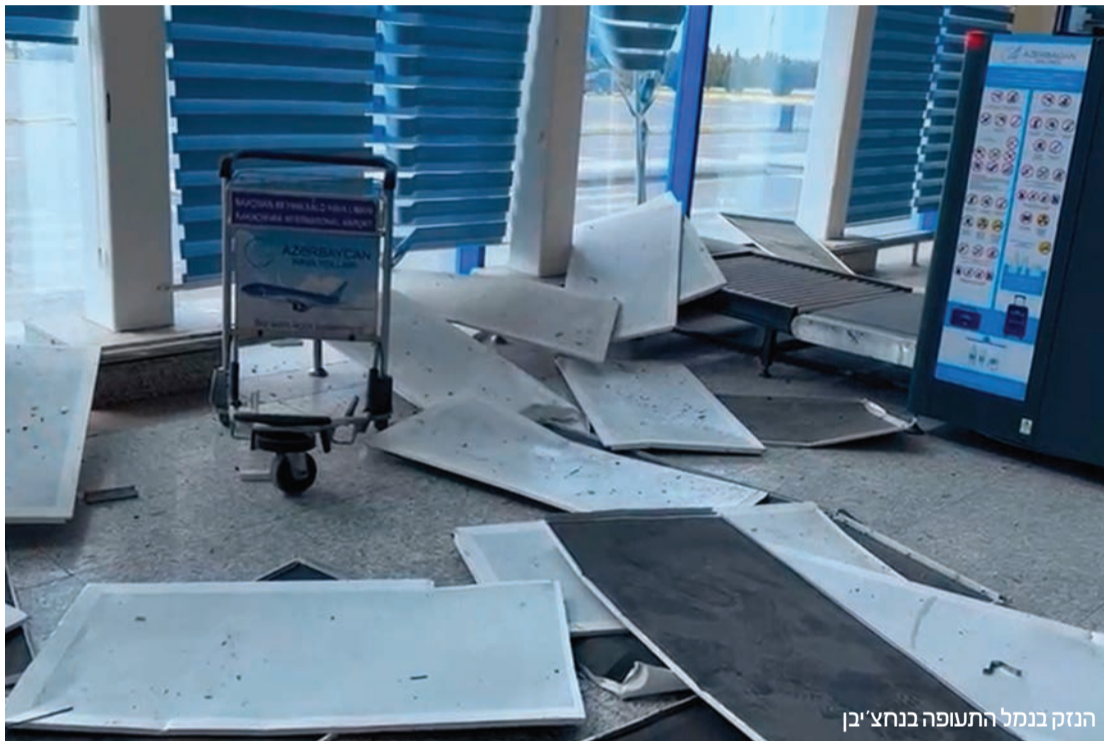
הנזק במהלך התעופה בנחצ'בן

המסדרון המוצע "יותר קוץ בצדה של טהרן, מה שיכול להסביר חלקית" את ההתקפה על המובלעת, אמר ל-AP מריו ביקרסקי, אנליסט בכיר למזרח אירופה ומרכז אסיה בחברת מודיעין הסיכונים וריסק מייפלקרופט. ללא המסדרון במימון ארה"ב, הנתיב היבשתי העיקרי לנחצ'יבן ולטר-רקיה מאזרבייג'ן - הוא דרך איראן, מה שעשוי להסביר את זעמה של איראן