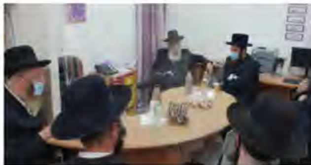
סיור בבית ספר גור

אז כן, השנה, תשפ"ו, וכל הלקחים מומשו. עד האחרון התוכנית המדוברת עסקה גם בעולם הישיבות, תלמודי התורה, גני הילדים, אלא שהפעם אנו עוסקים בתוכנית שיועדה לפתור את מצוקתן של הבנות החסידיים. והתוצאה, מדהימה.