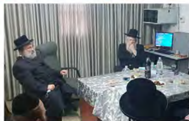
בישיבת עבודה בבית ספר