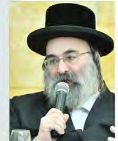
הרב יחזקאל וידר שיחי'