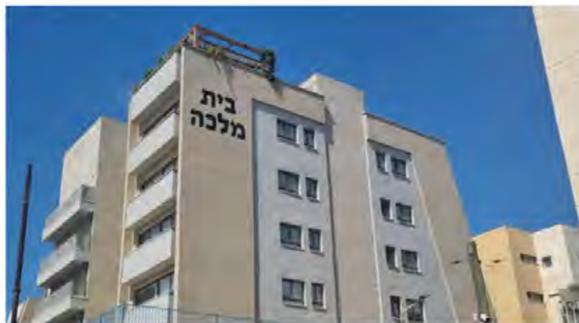
מבנה ביה"ס והסמינר לאחר ההרחבה