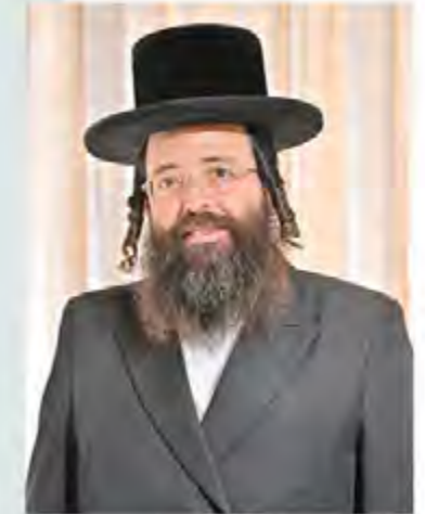
הרב אפרים פישל ויזל שיחי