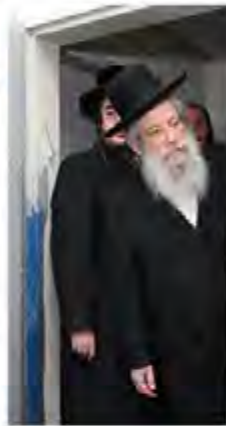
כ"ק מרן אדמו"ר מספינקא שליט"א נשיא ביה"ס בקביעת מזוזה

עתה אנו ממשיכים להביט קדימה, לשאוף ולחלום על העתיד - על התרחבות ותוספת בין באיכות ובין בכמות. הכל כדי להעניק לתלמידותינו את המיטב. ובעזרת ה' - יחד עם התמיכה הבלתי פוסקת של ראש העיר וצוותו - עוד נזכה לראות את החלום הזה מתגשם.