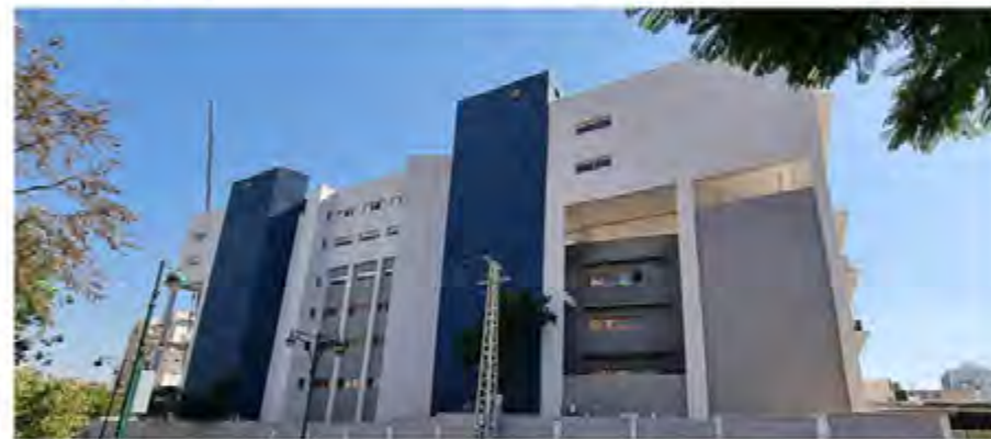
מבנה הסמינר לאחר ההרחבה