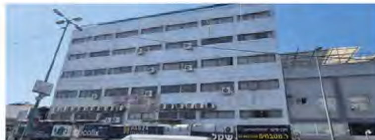
מבנה בית הספר