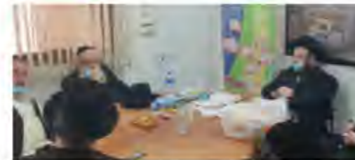
סיור בבית ספר בית מלכה

זייברט - מי שהיה אז רק "מ"מ ראש העיר" - הבטחות הן דבר שמקיימים. חלומות הופכות למציאות בשטח. ומילים קורמות ביטון וצבע. אז עכשיו בואו נעלעל, נקרא באותה הבטחת חומש, וננסה לבדוק מה השתנה. בואו, יוצאים לדרך.