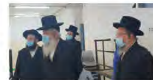
סיור בבית ספר בנות שרה

חמש שנים אחרי שהוכרזה 'תוכנית חומש' לטובת מוסדות החינוך לבנות יעקב החסידיים, הגיע הזמן לבדוק מה קרה עם ההבטחות? << תחקיר מפתיע ומרגש