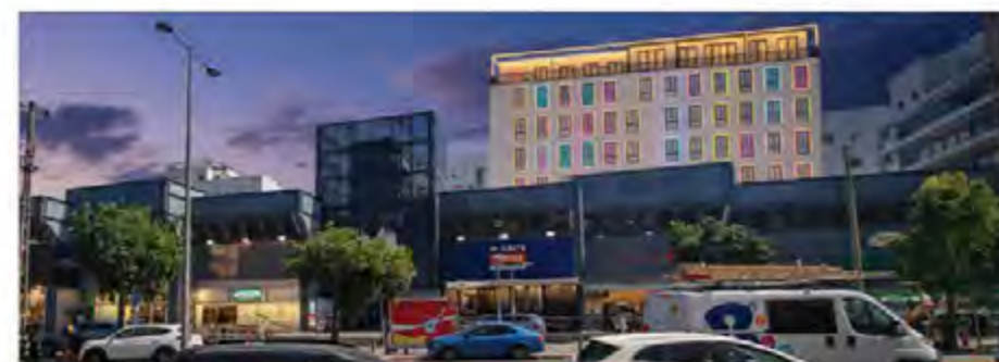
הדמיית הפרוגרמה 32 כיתות מעל מתחם פיג'ו