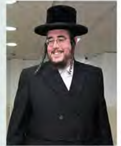
הרב אריה וייץ שיחי'