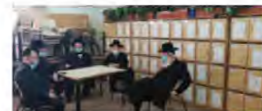
סיור בבית ספר ויצמן