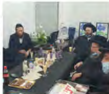
סיור בבית ספר פנינת בית יעקב

"לשם כך, ירדנו לשטח, סיירנו בכל מוסדות החינוך בעיר וישבנו עם הנהלות בתי הספר והסמינרים. קודם כל בדקנו בכל מוסד מה מספר הנרשמים וכמה הם קיבלו מתוך סך הנרשמים. וגילינו נתון מדהים. הפער במספר התלמידים בין כיתות א' לכיתות ח' הוא יותר מ-35%. הווי אומר: שאם בחמש השנים