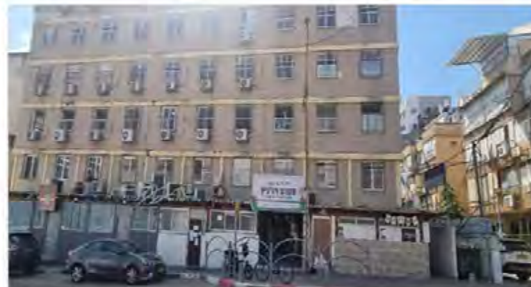
מבנה בית הספר