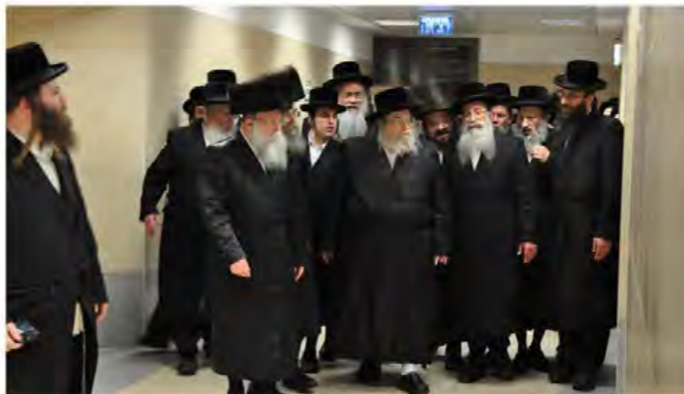
כ"ק מרן אדמו"ר מבעלזא שליט"א בביקור בין כתלי ביה"ס