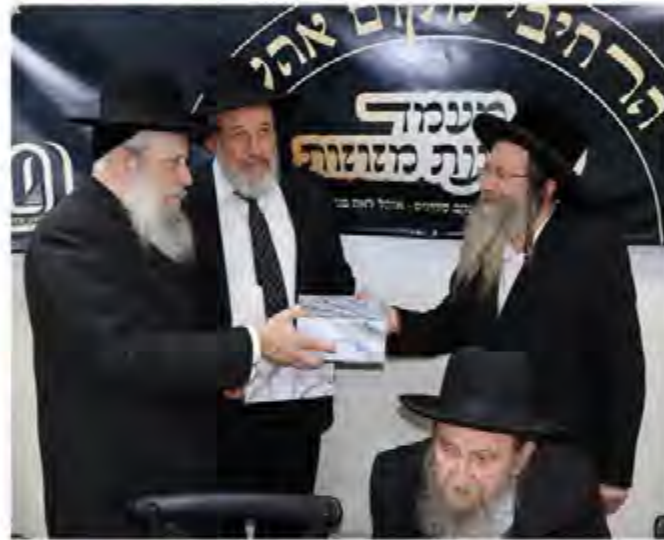
בן האדמו"ר שליט"א מעניק תשורה בשליחות אביו שליט"א לראש העיר