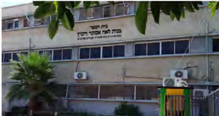
מבנה בית הספר