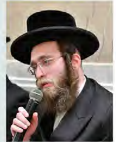
הרב שמואל וינברג שיחי'