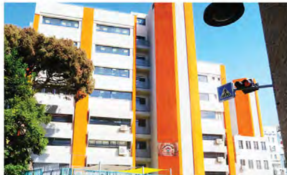
מבנה בית הספר