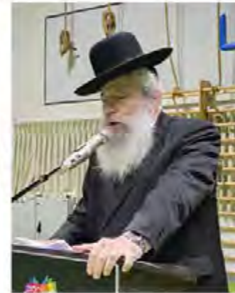
ראש העיר נואם בהנחת אבן הפינה לאגף החדש