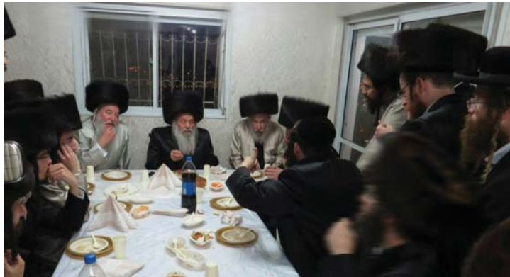
ותורת רבם הקדוש, עפ"ל.

בדבריו הכאובים התבטא הגר"נ ואמר: "הלא על מציאות כזו צריכים להתאסף בעצרת תפילה לקרוע שערי שמים אודות המצב החמור ולהתחנן לפני אבינו שבשמים שכל הפגמים יתקנו על הצד היותר טוב!". בהמשך, כשהזכירו לפניו