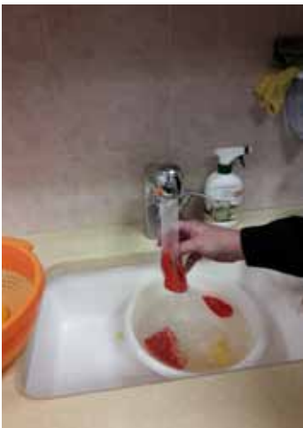
שטיפה הייטב תחת זרם מים