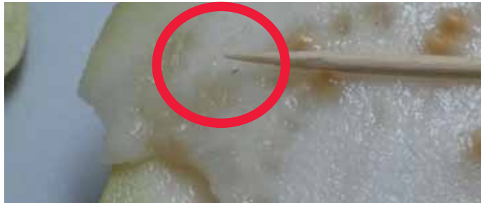
רימות זבוב הפירות בגוייבה, קשה לזיהוי עקב הצבע הזהה לבשר הפרי