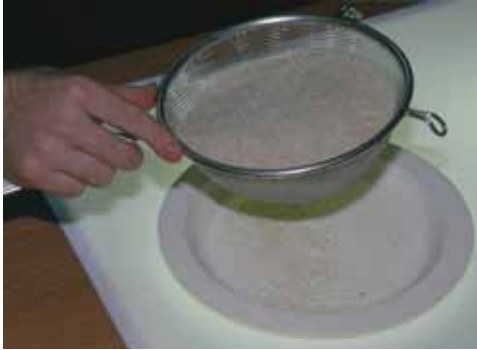
מסננת לבדיקת אורז לבן, וקטניות [גודל החורים כ 1.5 מ"מ]

א) יש לסנן את האורז בכמות של רבע ק"ג במסננת אטריות (גודל חורים כ- 1.5 מ"מ, פחות מעט מרוחב גרגירי אורז).