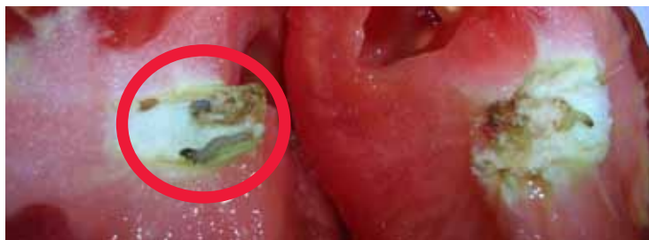
זחל בעגבניה, חודר בדרכי מהחלק העליון בסמוך לעלה הכותרת

להלן נביא כמה דוגמאות של בדיקת פירות וירקות / קטניות