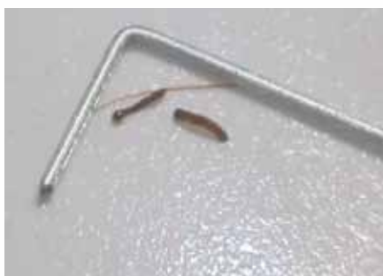
תמרים יש לבדוק הייטב לאחר הוצאת הגרעין, מול מקור אור