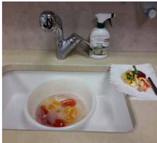
לאחר הורדת הראש והזרעים מבפנים יש לפרק לכמה חלקים ולהשרות במים עם חומר ניקוי [סטרילי, דטרגנט] למשך 3 דקות