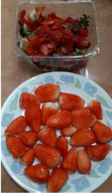
תות שדה לאחר קילוף השכבה החיצונית כולל הגומות

ערכנו בדיקות רבות באופנים שונים ועמל רב, ליעילות השטיפות להסרת חרקים בתות שדה - ונוכחנו כי השטיפות כפי מה שהיה מקובל אינן יעילות מספיק, ועלולים להישאר חרקים בודדים.