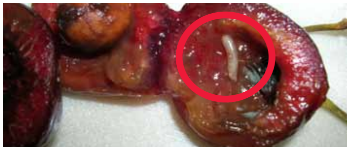
רימת זבוב הפירות בדובדבן