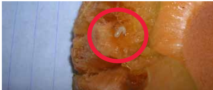
רימת "זבוב הפירות" במשמש טרי