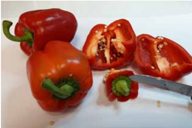
יש לחתוך את ראש הפלפל [העוקץ] עם מעט מהפלפל שם מסתתרים חרקים קטנים