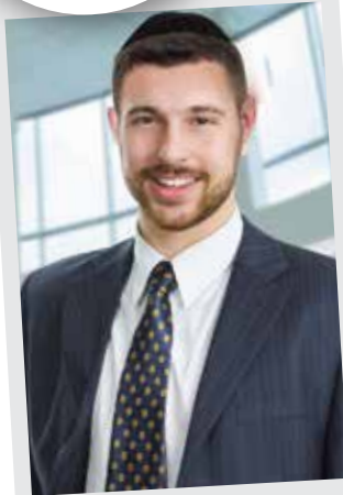
אשפת גרוסקין דין גל ירושלים

סוכן ידוע ממאנסי מספר את הסיפור הבא, הוא היה עד לכל התהליך שנמשך מס' שנים. פוליסה ע"ס 10 מליון דולר ופרמייה חודשית גבוהה של $ 45,000. הרוכשים היו משפחה שלימה שהחליטה לקחת יחד את הפוליסה, מס' חודשים לאחר הרכישה הגיעו לידיהם תוצאות בדיקות רפואיות שלה ושם הם גילו כי הבדיקות טובות יותר מהקודמות וכי תוחלת החיים שלה עלתה. ובקיצור, סיכוי עצום להפסד.