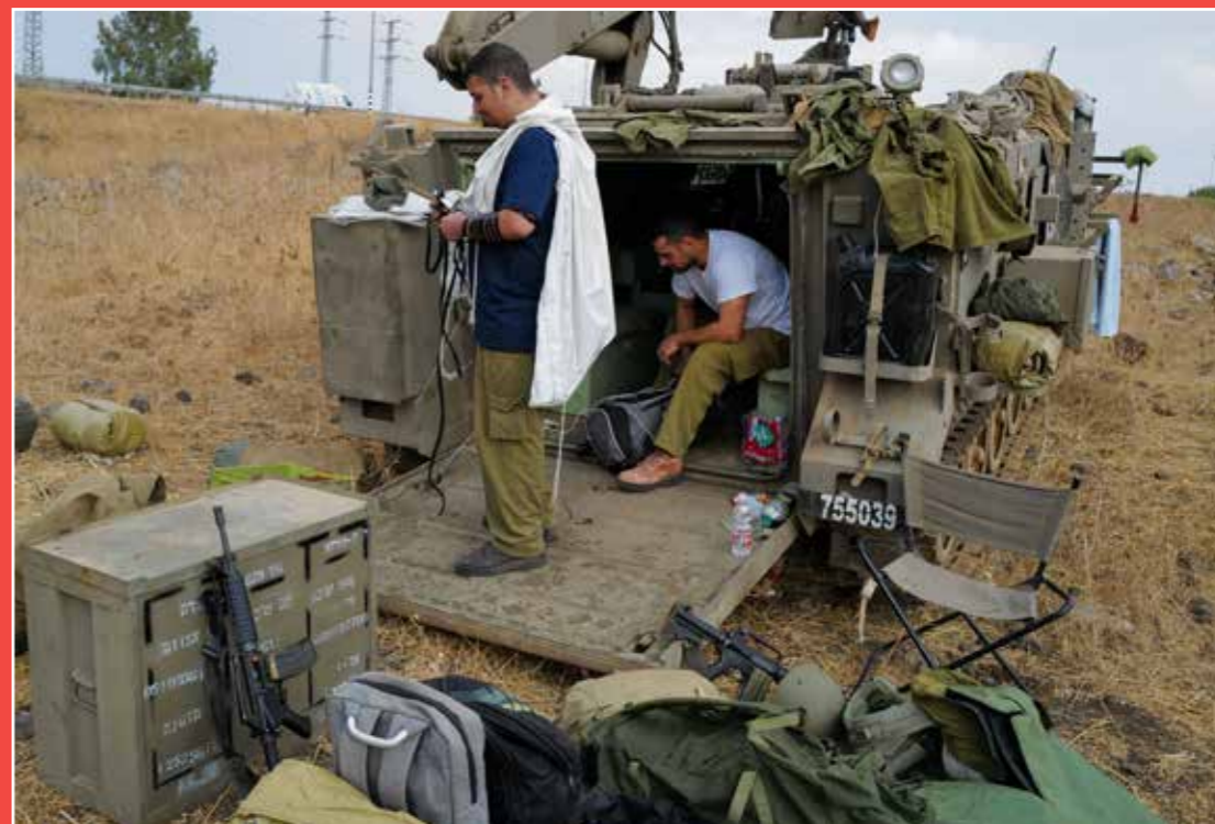
חיילי צה"ל הבוקר באחד משטחי הכינוס סמוך לגבול עזה בתפילת שחרית