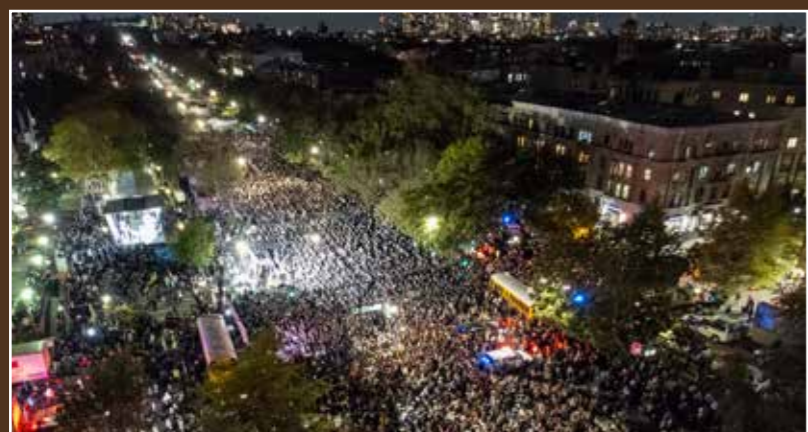
אלפים גודשים את הרחובות.

אלפי חסידי חב"ד בשכונת קראון הייטס שבברוקלין התאספו אמש (שני) לעצרת תפילה ברחובה של עיר לשלום החטופים והנעדרים ואמרו פרקי תהילים לרפואת אלפי הנפגעים במתקפת הטרור על יישובי עוטף עזה. בשיא המעמד נעמד הקהל על רגליו בשירת 'אני מאמין' שפילחה את הלבבות. בסיום, נלמדו פרקי משניות לע"נ הקדושים