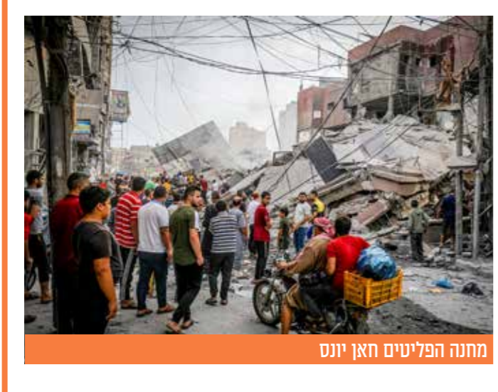
מתנה הפליטים חאן יונס