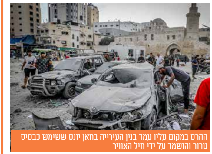
ההרס במקום עליו נמדד בנין העירייה בחאן יונס ששימש כבסיס טרור והושמד על ידי חיל האוויר

צה"ל תקף מהאוויר מאות מטרות בעזה ביממה האחרונה תקפו מטוסי חיל האוויר למעלה מ-200 יעדים ברחבי הרצועה ששימשו כבסיסי טרור של החמאס והג'יהאד