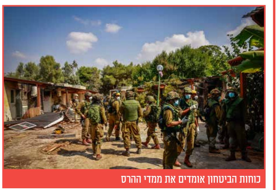
כוחות הביטחון אומדים את ממדי ההרס