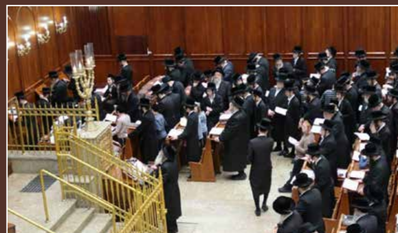
אלפי חסידי בעלזא ביום תפילה העולמי שהוכרזה בהוראת כ"ק מרן אדמו"ר מבעלזא שליט"א בהיכל ביהמ"ד הגדול בקרית בעלזא ירושלים.