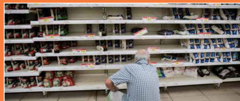
בעקבות הנחיה שגויה שיצאה מפיקוד העורף בו נקרא הציבור לאגור מים ומזון למשך 72 שעות, החלו צובאים מאות אלפים בכל רחבי הארץ על רשתות המזון ומרכזי הקניות ורכשו מוצרים מכל הבא ליד