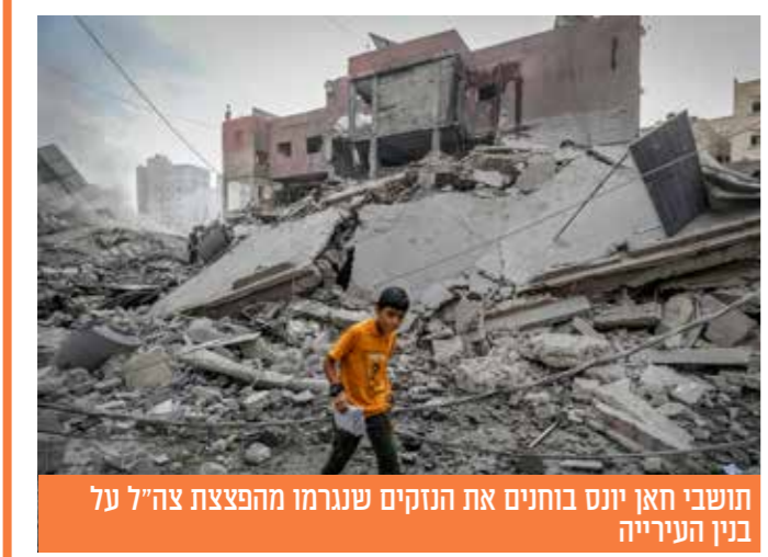
תושבי חאן יונס בוחנים את הנזקים שנגרמו מהפצצת צה"ל על בנין העירייה