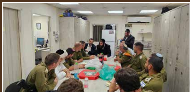
ישיבת מל"ח (משק לשעת חירום) של העירייה, יחד עם המשטרה, פיקוד העורף וארגוני החירום