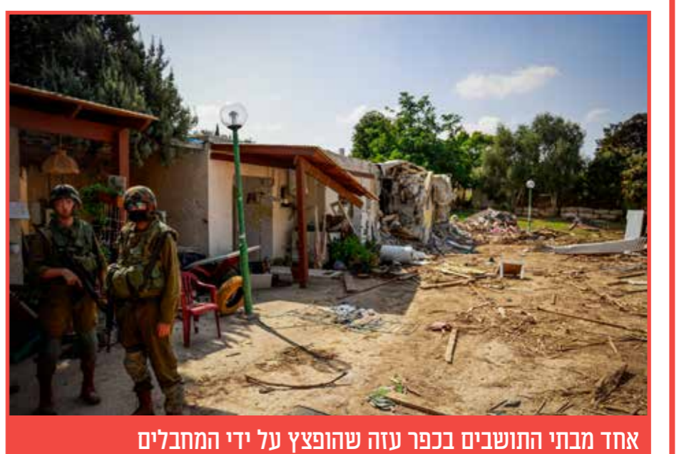
אחד מבתי התושבים בכפר עזה שהופצץ על ידי המחבלים