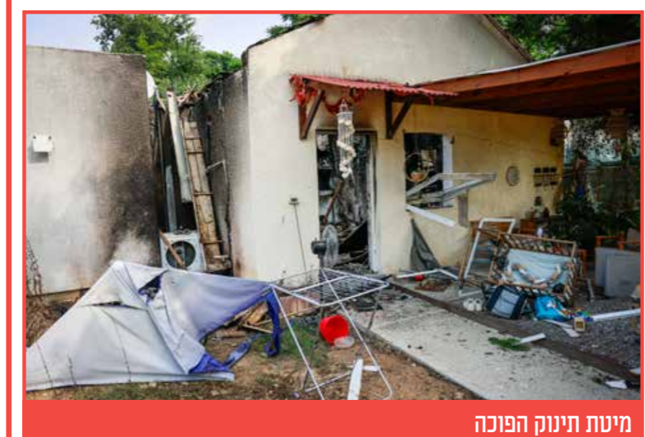
מיטת תינוק הפוכה

לאחר שהסתיימה מלאכת פינוי החללים הותרה היום לראשונה הכניסה לכפר עזה כאשר המחזות הקשים שנגלו לעיני המבקרים מהווים עדות אילמת לטבח שבוצע בתושבים חסרי הישע