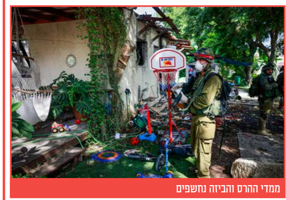
ממדי ההרס והביזה נחשפים