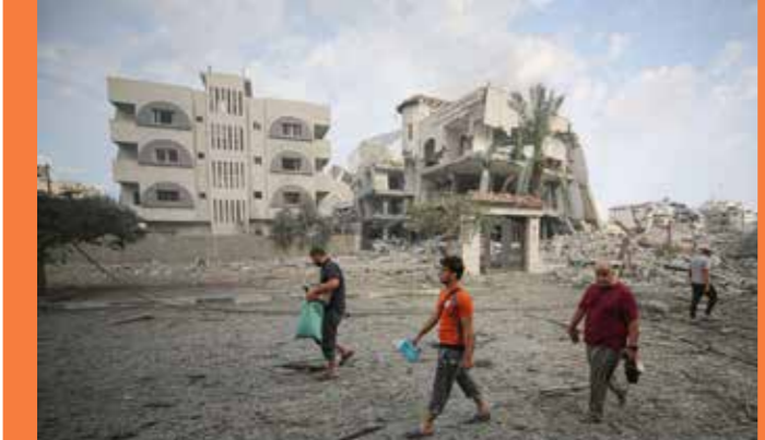
תושבי השכונה היוקרתית בעזה אל-רימל בעזה אוספים את חפציהם בין מבנים והריסות לאחר שמרבית בתי השכונה שם מתגוררים מנהיגי חמאס הופצצו והושמדו