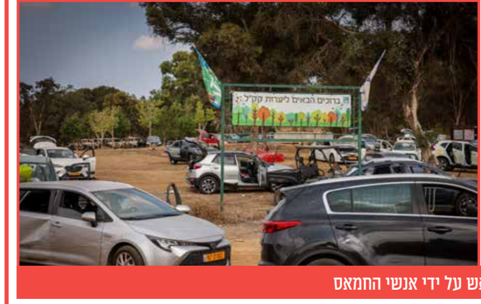
רכבי תושבים שהועלו באש על ידי אנשי החמאס