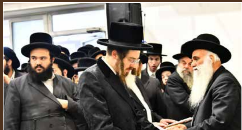
כב"ק האדמו"ר מסאדיגורה בעצרת.

לאור המצב הקשה השורר בארצה"ק התקיימה אמש עצרת תפילה וזעקה בבית הכנסת המרכזי בשיכון ה' בבני ברק בראשות כב"ק האדמו"ר מסאדיגורה והמרא דאתרא הגרמ"ב זילברברג ומאות מתושבי השכונה. לפני התיבה עבר הגאון רבי שמעון גלאי שעורר את הקהל בעקבות האסון הכבד שפקד את העם היהודי.