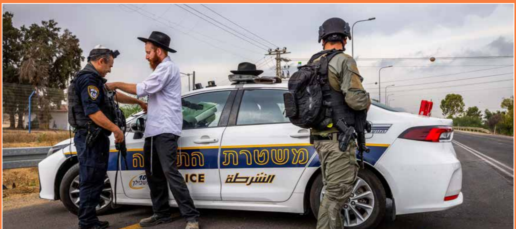
שוטר מניה תפילין בצידי כביש ראשי בסמוך לאחד מיישובי עוטף עזה בסמוך לגבול