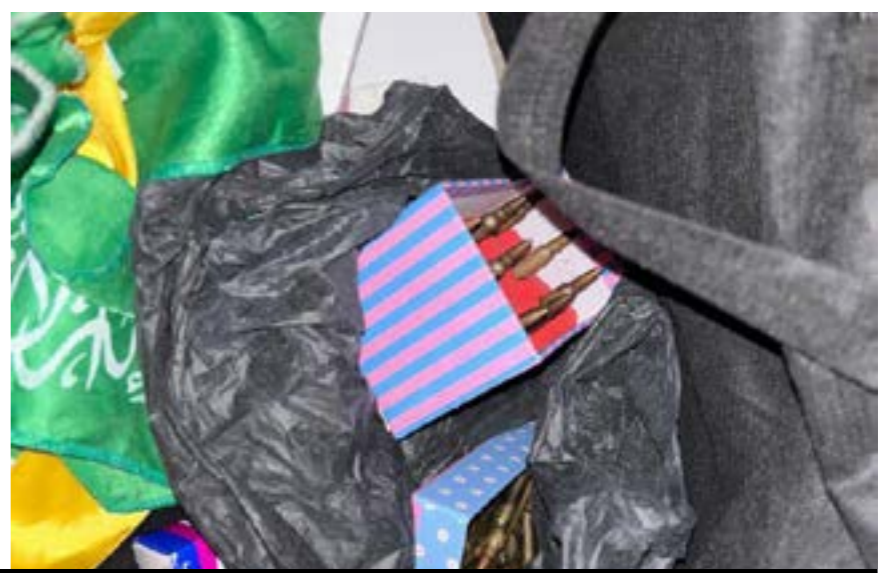
הפשיטות הממוקדות והמוצלחות, בחסדי היושב במרומים, בתוככי מחנה הפליטים ג'נין, ממשיכות ביתר שאת. בתמונה: פשיטה לילית נוספת שהביאה למעצרו של למעלה מ-50 מבוקשים ותפיסת אמצעי לחימה שבידי המחבלים