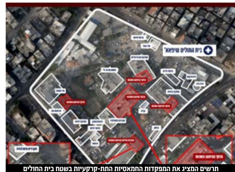
תרשים המציג את המפקדות החמאסיות התת-קרקעיות בשטח בית החולים