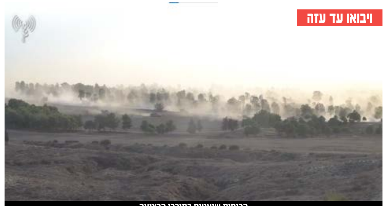
ויבואו עד עזה