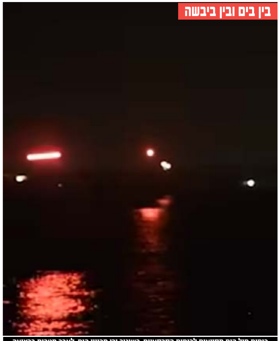
כוחות חיל הים מסייעים לכוחות הקרקעיים, בשיגור ירי מכיוון הים, לעבר מטרות ברצועה

נכתב בספר אורחות צדיקים: "מי שמאמין באלוקים בלב שלם ובוטח בו בביטחון חזק, יביא אותו הביטחון שלא יפחד מעולם מדבר רע!"