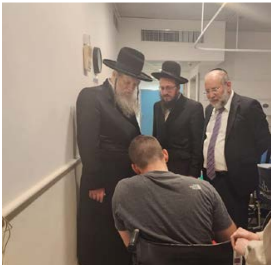
כ"ק מרן אדמו"ר ממוד"ץ שליט"א הופיע בבית-החולים 'שיבא' לבקר את אחד מפצועי המלחמה