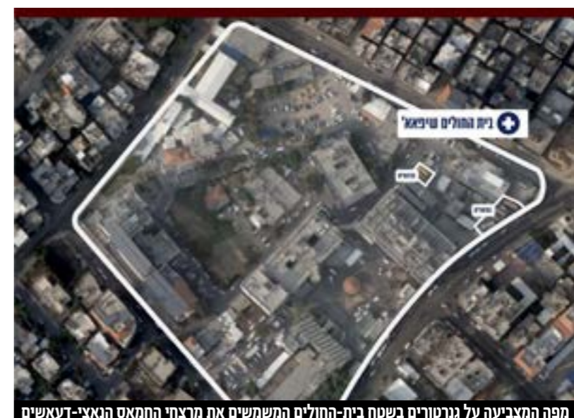
מפה המצביעה על גורטורים בשטח בית-החולים המשמשים את מרצחי החמאס הנאצי-דעאשיים