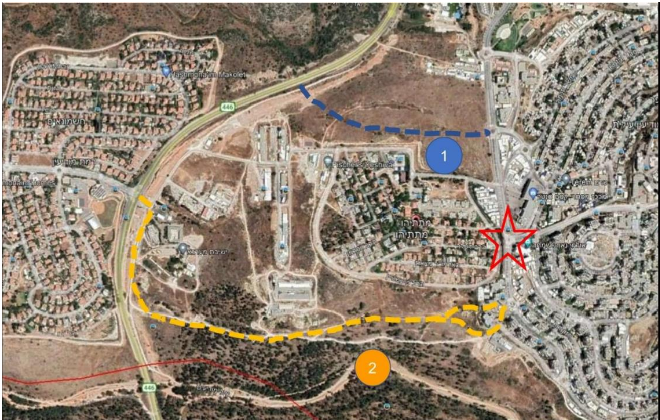
תשריט מס' 2 – חלופות החיבור הנוספות של מודיעין עילית לכביש 446, ע"פ הצעת המהנדס עדו יגר