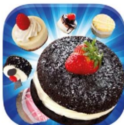
קישור ל- Cake bites