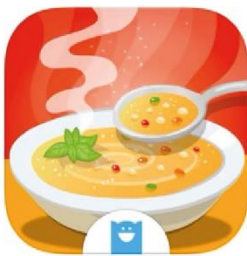
קישור ל- soup maker

Soup maker - מרק, לפתוח בו את הארוחה, מה תבחרו? מרק עגבניות? מרק עוף? או אולי מרק פטריות?