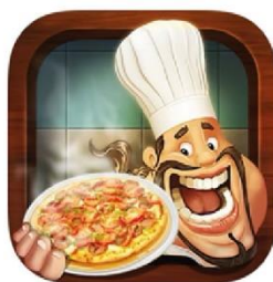
קישור ל- Pizzamaker