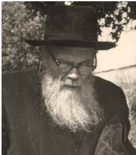
התשי"א התמנה למנהל רוחני בישיבת כנסת חזקיהו שבזכרון יעקב.

פעם קרה שאחד מילדיו עשה עוולה גדולה, הוא חיכה שבועיים עד שהרגיש בעצמו שלא נשאר בלבו אפילו שמץ כעס, ורק אז ייסר אותו. (גליון סיפורי צדיקים)