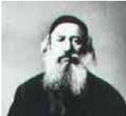
מהווים שירה לקל חי, ונטמן בביה"ח בווארשא.