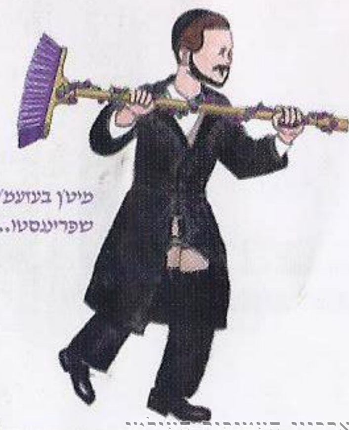
מיט'ן בעזעמ'ל שפרינגסטו...

אוי!! פיל מענטשן דינגסטע ביים שמחה פונעם יונגסטע דער מוזיקאנט מיט'ן קלאפער געצייג די פרישסטע ניגונים, די זינגער ביי די מויק די בילדער בליצן א שמייכלע נאר צייג אבער אויסמאכן דעם ריגעל נאר "שמחה" איז מסוגל איז לייג אראפ דעם קוגעל צום הויז לייג צו א ציגעל מיט אלע ביינער אלע ריפען העלפט צו דורך זיפען מרקד איז דאך א לשון פון א זיפ דער פשוט'סטער מענטש, פון סיי וואספארא טיפ קען פועל'ן פאר יעדן, די שלעכטס געבן א שטופ