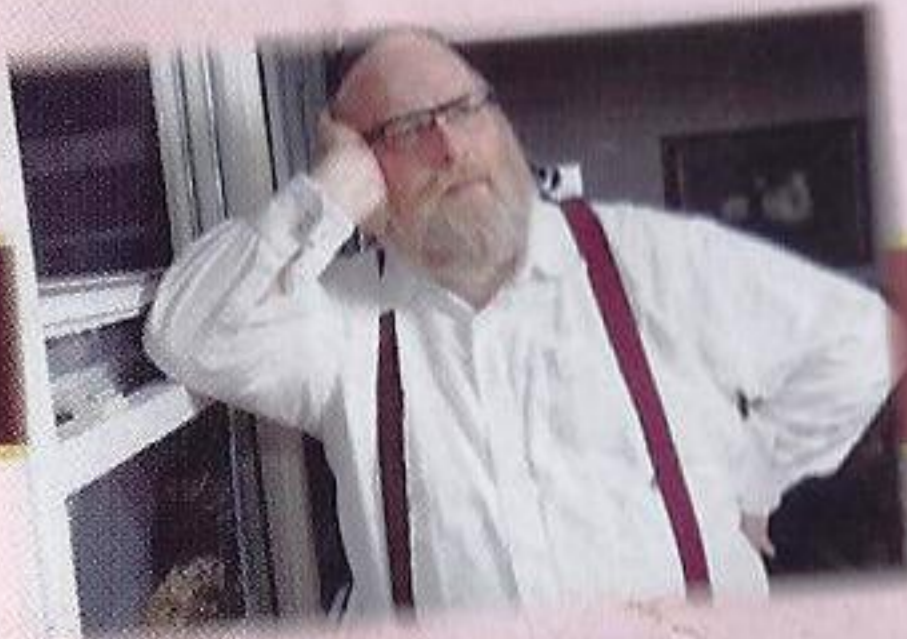
And to all my friends Who helped me in this project!