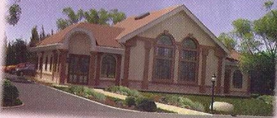
בית המדרש הגדול והחדש דק"ק עירפאנט