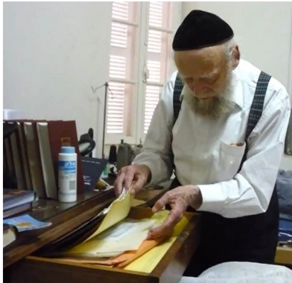
אף אתה היה רחום... ברור לי שהנחתי 500 דולר בין הספרים...