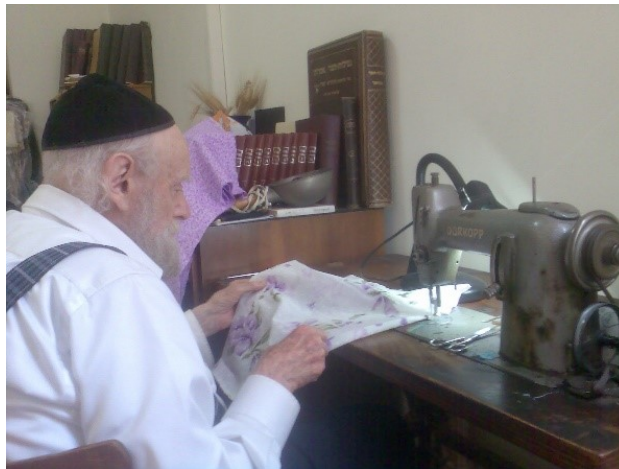
"תופר בחסד עליון" - בעת עיסוקו במלאכת התפירה