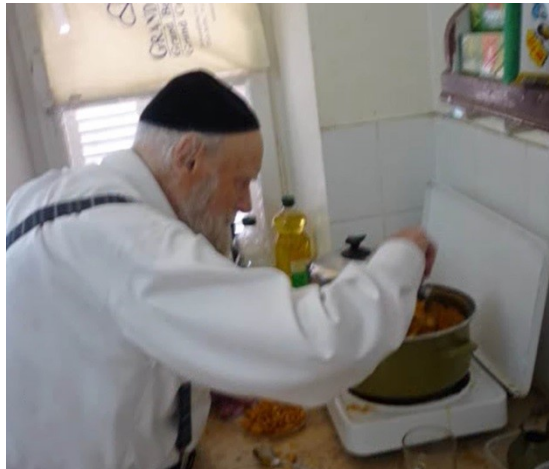
"כל דכפין ייתי ויכול" – בעת הכנת תבשילים לאורחים לכבוד שבת