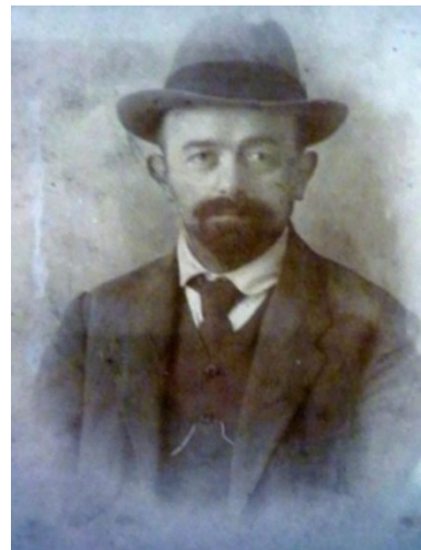
אביו - הרב חיים זאובר זצ"ל