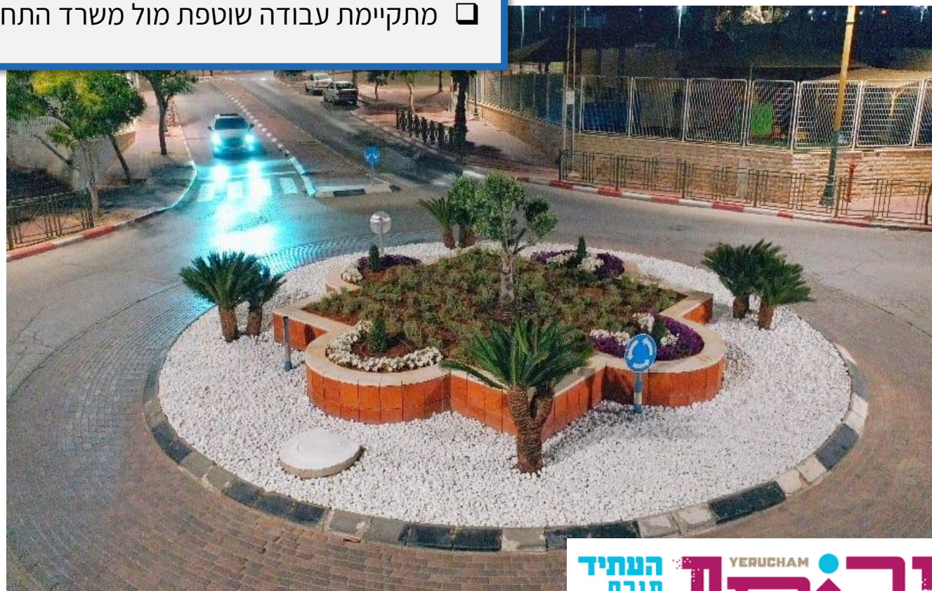
בנצי ראקוב ניהול תכנון עירוני ואזורי בע"מ