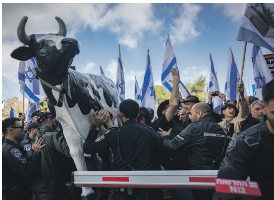
שביתת הסתיימה מהר, קרטוני החלב נותרו בשפע. הפגנת הרפתנים

החלב שנשפך: שביתת הרפתנים הסתיימה השבוע תוך יום אחד, והותירה את הצרכנים עם מקררים עמוסים בקרטונים שנרכשו בפאניקה. הלך ברוך: בפעם הבאה שמאיימים עליכם במחסור, קחו נשימה עמוקה. חבל לבכות על חלב שנשפך, ועוד יותר חבל על הכסף שנשפך בגלל כתורות מלחיצות.