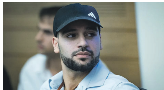
"ניצול השואה" ברק נוצל לתעמולה. מרדכי דוד

חסימות כן וחסימות לא: כשזה קפלן זו "מחאה", כשזה ימין זו "חקירה"