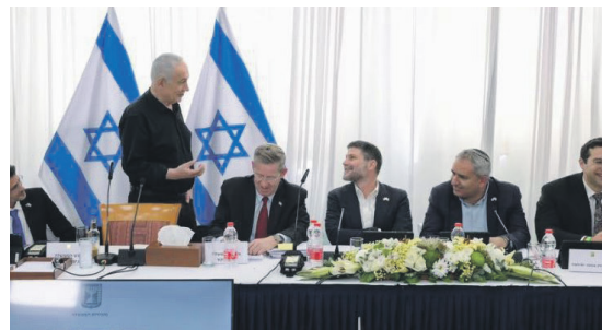
"אנחנו רק ביבי". ישיבת הממשלה השבוע בקריית שמונה כולנו ביבי", חזרו ואמרו.

"אתם הרי נפגעתם יותר מכולם במלחמה, ויש לכם טענות כרימון על הממשלה", תהו הכתבים. לתושבים הייתה תשובה פשוטה: הם אינם מוכנים לתת את קולם למי שעלול, בעיניהם, להישען על הרשימה הערבית המשותפת. זה קו אדום. נפתלי בנט, יאיר לפיד ויאיר גולן חשודים מבחינתם כמי שיעשו זאת ולכן לא יקבלו מהם קול. "אנחנו