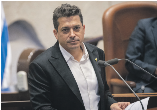
בנט מצליח לשקר גם על השקרים שלו. עמיחי שיקלי

המעניין הוא שהחשד הזה כבר לא מוגבל לימין. גם פרשנים בצד השמאלי של המפה מודים בחצי פה: "אם הוא שיקר לימין, אין סיבה שלא ישקר גם לנו". באופוזיציה חרשים שבסוף עוד יבצע סיבוב פרסה פוליטי וישב באותה ממשלה עם נתניהו.