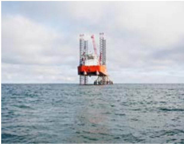
הנפט יענה את הכל. אחד ממרבצי הנפט של סעודיה

באופן שיקטע את הרצף הטריטוריאלי הישראלי. בינתיים, מי שכבר מרוויח מכל המהלך הינם הפלסטינים, וזאת משום שערכ הסעודית מתכננת להציע לפלסטינים את חידוש הסיוע הכלכלי, 8 שנים אחרי שחדלה מלהעביר באופן מלא את כספי הסיוע. על פי הדיווח בעיתון וול סטרייט ג'ורנל האמריקני, המטרה בהצעה היא הכנת הקרקע לכינון יחסים עם ישראל, ובניסיון למנוע מכשולים בדרך לחתימת הסכם נורמליזציה בעתיד. המקור הסעודי סיפר לעיתון האמריקני הנחשב כי סעודיה מוכנה לספק תמיכה כספית להבטיח את נשיאותו של אבו מאזן, בתמורה לתמיכתה של רמאללה בקיום היחסים המדיניים עם ישראל. המטרה הסעודית לפי הדיווח, היא ניסיון למנוע האשמה שריאד מוכנה להקריב את מאמצי הפלסטינים להקים מדינה כדי לקדם את עניינה של הממלכה.