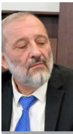
קורא את המפה.

אריה דרעי החליט להיכנס לזירה. דרעי שהינו ללא ספק שועל פוליטי ותיק, הריח בחושיו הפוליטיים שזה הזמן לבצע מהלכים. בקריאת המפה של דרעי, ההסכם הטוב ביותר שהיה עבור שס, היה מתרחש מול דגל התורה