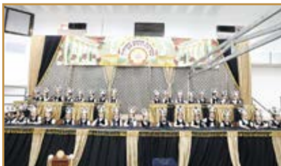
חתני המקרא במעמד