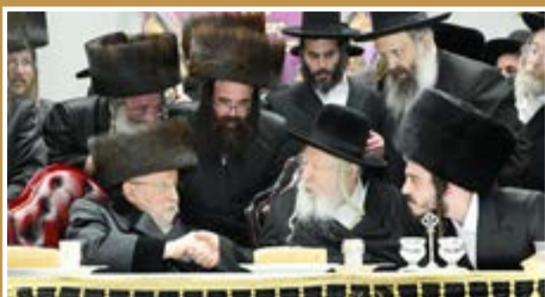
האדמו"ר מגור בשמחה