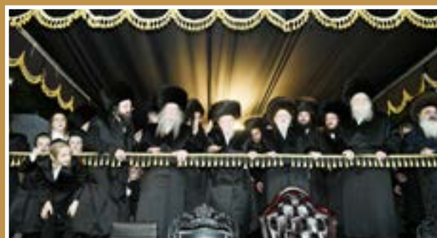
בריקוד לאחר החופה