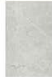
Quarry Light grey החל מ- 69.90 ₪