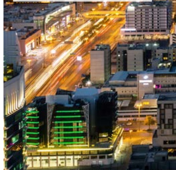
ישן וחדש. נוף סעודי טיפוס