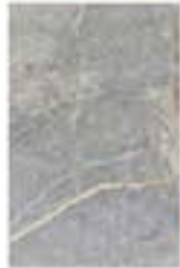
Beton Grey החל מ- 75.90 ₪