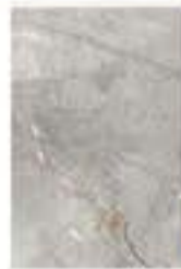
Beton brown החל מ- 69.90 ₪