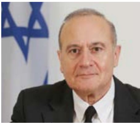
השופט אלרון.

דרמה בבית משפט העליון עם הודעת השופט אלרון על התמודדותו לתפקיד נשיא בית המשפט העליון