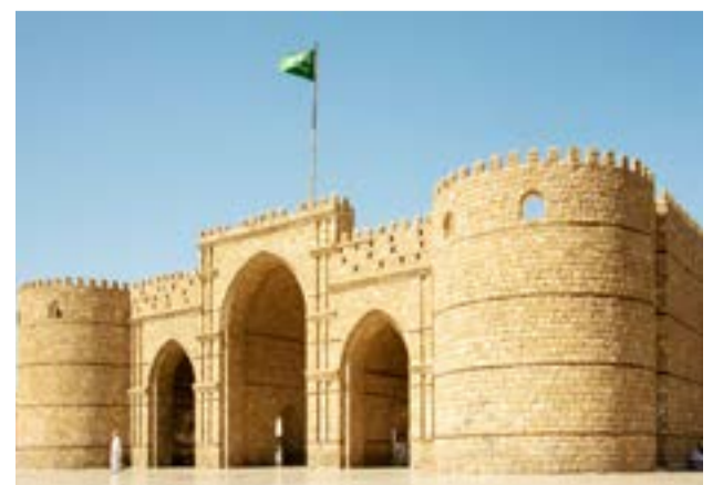
העיר העתיקה גדה