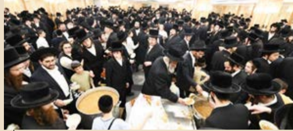
הכנסת אורחים בבעלזא

חסידות בעלזא פתחה את בית המדרש הגדול ומבואותיו לטובת רבבות המפגינים מכל החוגים שגדשו את המקום בלימוד, ונהגו מאירוח אכילה ושתייה חנם אין כסף. האדמו"ר מבעלזא היה בעצרת במרפסת ביתו נכדו הרב אלימלך נתן נטע רוקח ברח' שמגר ואלפי החסידים עמדו לאורך כל רחוב שמגר משני הצדדים.