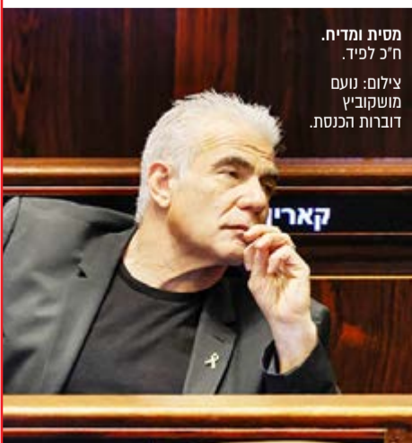
מסית ומדיח. ח"כ לפיד.

לפיד לא מתבלבל. רבים מאלו שמתנגדים למדינת ישראל ולקיומה, אלו יכולים לגשת לקלפי ולהצביע. לעומתם, הציבור החרדי, אלו שיושבים ולומדים, מהם צריכים לשלול את הזכות הבסיסית שיש בכל דמוקרטיה