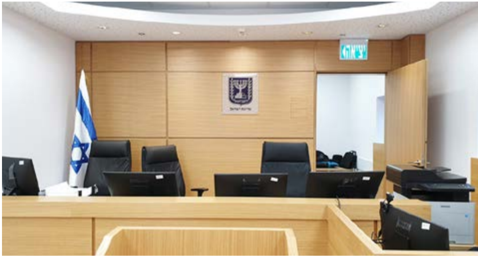
בית דין רבני.

במשך עשורים הוביל בג"ץ שורת החלטות שפגעו בבתי הדין הרבניים. כעת המגמה צפויה להשתנות ובתי הדין יקבלו מחדש נוח לפסוק. גורם בכיר בבתי הדין הרבניים משרטט בריאיון ל'מרכז העניינים' את השינויים הצפויים. וגם: איך כל זה קשור לפיצול תפקיד היועמ"שית?