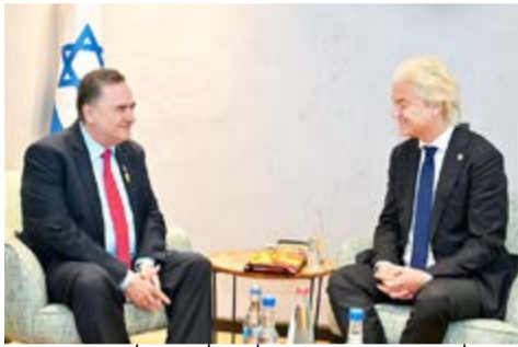
וילדרס עם שר הביטחון כץ.

הבחירות על ראשות ממשלת הולנד התנהלו כמרוץ דו-ראשי בין אחד המנהיגים הפרו-ישראליים ביותר ביבשת אירופה חירט וילדרס, לאחד המנהיגים העוינים ביותר את ישראל, רוב יטן. במוקד הבחירות: ההגירה הגואה להולנד • התוצאות מורכבות