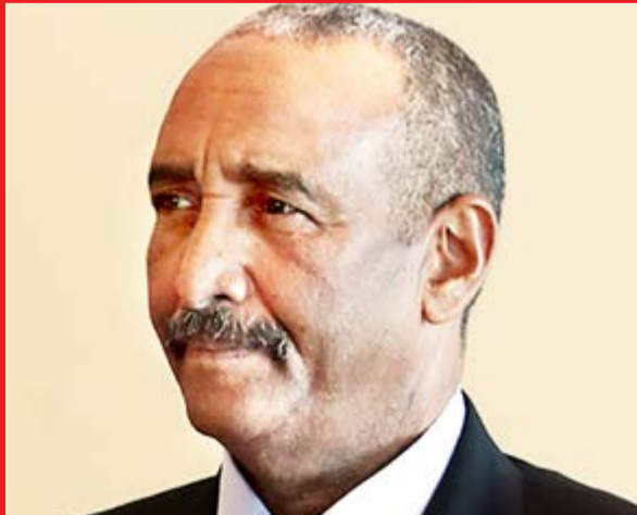
עבד אל פאתח אל בורהאן.

האחרונה. בינואר השנה מפקד צבא סודאן הרשמית הצליח לשוב למטה שלו בח'רטום הבירה, לאחר חודשים שהמקום היה תחת מצור מצד המורדים.