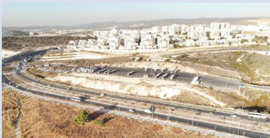
מבט מלמעלה על שטח בית החולים העתידי בבית שמש - רחוב זכריה הנביא

מדובר בצעד ראשון וחשוב לקראת הקמתו של בית החולים העירוני שצפוי לקחת שנים רבות, כאשר המבנה החדש מחוז ירושלים ברשות מקרקעי ישראל