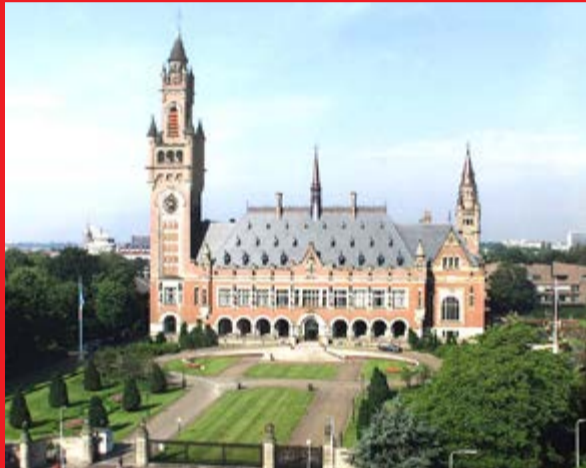
העולם שותק. בית הדין בהאג.