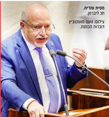
מסית ומדיח. חכ ליברמן.

» ואם היה צריך עוד, אז ליברמן התחייב: "כשנחזור לשלטון נבטל את כל החוקים הללו ונגייס את כולם. החוק חייב להיות ברור. אם לא מתגייסים, לא מצביעים"