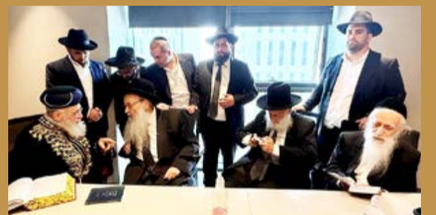
לפני מעמד התפילה