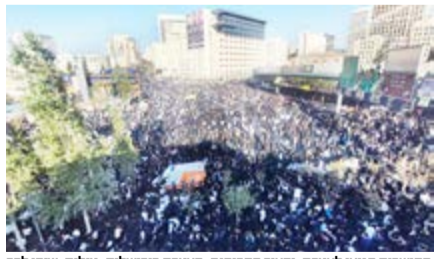
התושבים הגיעו לעצרת. העיר התרוקנה. העצרת בירושלים.

ל'מרכז העניינים' נודע כי כבר בשבוע הקרוב יחלו שלבי הפיתוח הסופיים סביב המבנה, לקראת כניסת התלמידים למקום, וכי - נכון לכתיבת השורות - מתבצעים במקום השלמת הסטנדרטים הבטיחותיים המוקפדים שכלולים במבנה.