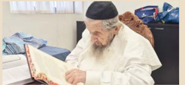
בלימוד לפני העצרת