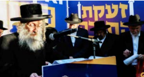
המשפיע רבי אלימלך בירדמן