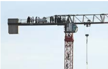
חוסר אחריות משווע.