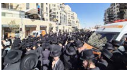
עוררו מהומות. צילום: אילוסטרציה. העצרת בירושלים. צילום: איחוד הצלה

בשלב מסוים, לאחר העצרת, מספר צעירים ששהו על עגורן באופן שסיכן את חייהם, התבקשו לרדת ממנו. כוחות שהגיעו למקום דרשו מהם לרדת בצל האסון הנורא שהתרחש בשולי האירוע, אך הם סירבו לעשות זאת. גם באזור הכניסה לעיר, סמוך לגשר