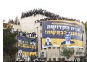
השלט הענק בכניסה לעיר