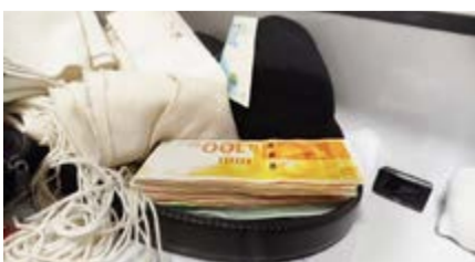
הונו את הביטוח הלאומי ונעצרו.

עם הבשלת החקירה, נעצרה תושבת דרום הארץ בפשיטה של חוקרי הביטוח הלאומי עם יחידת ההונאה של ימ"ר ירושלים, כחשד שקידמה לצד הורים וילדים הונאה רחבת