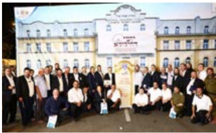
מהישיבה על קברו של מייסד הדף היומי

רבים שעלו לקבר המהר"ם להעתיק בתפילה לרגל שנת ה-92 לפטירתו, התאספו במקום כמעט באופן ספונטני ללימוד סדר "הדף היומי" שייסד. בין משתתפי השיעור היו לומדי הדף מרחבי העולם, בהם מתנדבי זק"א שמאז אירועי שמחת תורה תשפ"ד ייסדו שיעור חדש ב"דף היומי". זכותו תגן עלינו.