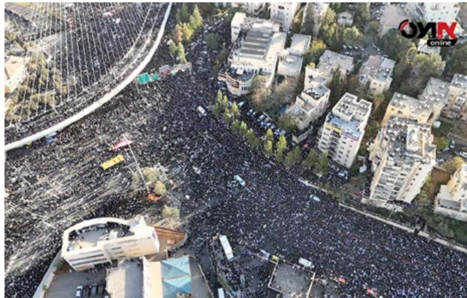
רחוב ירמיהו. צילום: רחפן מ. ויצמן 3

באחד המקרים התרכזו רבים במבנה שמול מלון ירמיהו 33 בו התכנסו רבים מגדולי ישראל, כאשר המבנה עדיין בתהליכי בנייה על כל הסכנות שבדרכו.