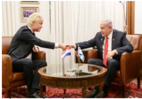
נתניהו עם חירט וילדרס.