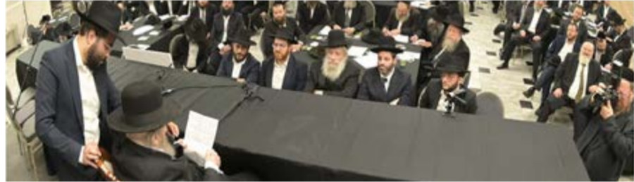
מרתון רבנות בנייה

ראש העיר חנוך זייברט בירך את המשתתפים ואמר: "הדרך הנכונה והרצויה בחינוך, היא להוכיח לילדינו שהם טובים ומוצלחים והם יכולים להגיע למקומות מאוד רחוקים שלא האמינו - בעזרת הכישרונות שלהם. החכמה היא להאיר פנים לכל תלמיד ותלמיד שיקלטו את המסר שהם טובים ומוצלחים ועדיים לגדולות, חלילה שיהא בצורה שלילית".