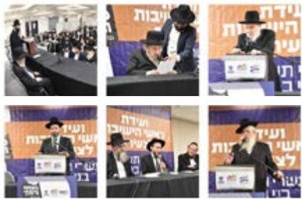
מרתון רבנות בנייה

בין שאר דבריו כי "הכוח שיש לר"מים - חוץ ממה שהם מלמדים את התלמידים גמרא - הוא להכניס ענייני השקפה בתוך הלימוד. בפרט בתלמידי ישיבה קטנה ואפילו בתלמידי ישיבה גדולה. אם בחור שומע מהר"מ איזה סיפור על מה שהיה לו עם הרבי שלו, והרבי שלו - כלפי הבחור - נחשב לאדם גדול מהדור הקודם שהוא דוגמא לחיקוי, זה מעורר בו לדבוק בדרכים הללו ולנסות ללכת בעקבותיו".