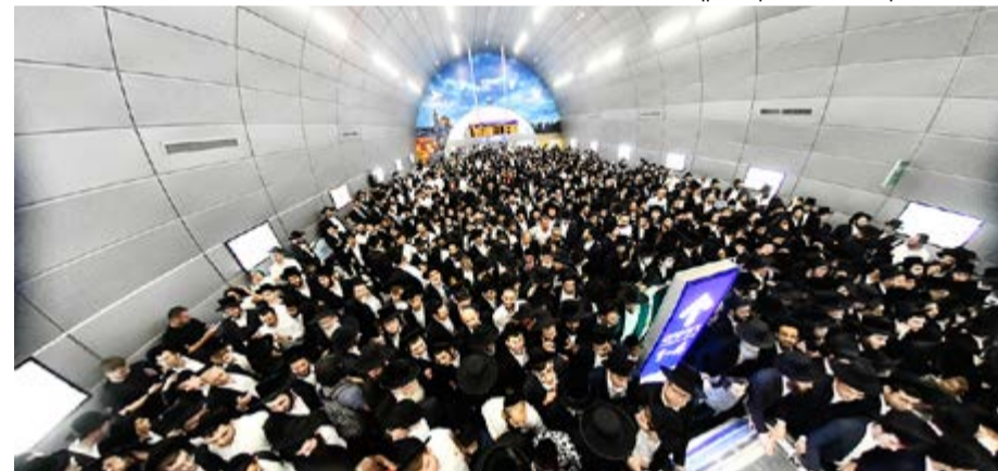
ההמונים ברכבת ישראל. צילום שוקי לרר.

בדרך לקיום העצרת צצו לא מעט התמודדויות, ובהן החלטת רכבת ישראל זמן קצר קודם העצרת לבטל למשך זמן קיום העצרת את התחנה הקרובה ביותר למיקום העצרת - תחנת יצחק נבון.