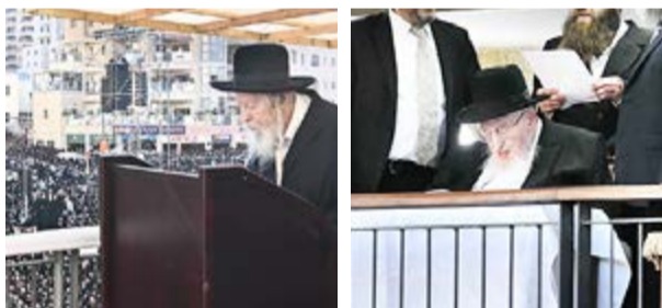
מרן האדמו"ר מגור בעצרת

מוקד נוסף היה בבניין שמגר 10 בצומת ירמיהו שם מול הרבנות היו מרן האדמו"ר מגור, ומרן ראש הישיבה הגרמ"צ ברדמן ועוד גדולי ישראל. בסיום העצרת נפגשו גדולי ישראל למעמד 'לחיים'. הגרמ"צ ברדמן אמר לאדמו"ר מגור: "אני חושב שמהעצרת הזו צריכה לצאת הכרזה שאף אחד הוא לא בעל הבית על התורה. וממילא אי אפשר לוותר על אף אחד". האדמו"ר: "אוודאי! (בוודאי) ריכטיג! (אמת)".