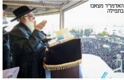
האדמו"ר מצאנו בתפילה

האדמו"ר מביאין שהיה באמצע השבע ברכות לרגל נישואי נכדו יצא למרפסת ה'קלויז' במלכי ישראל שם התאספו החסידים מול הרבי במהלך כל העצרת.