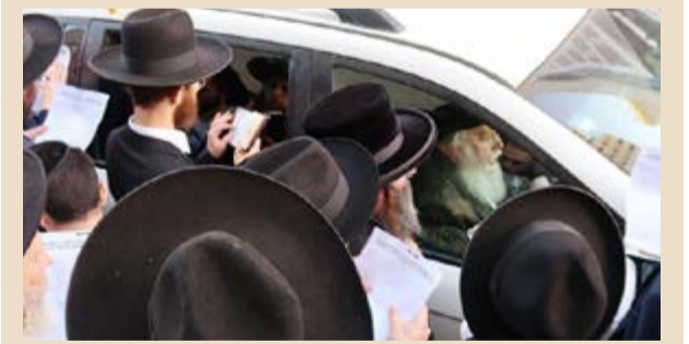
בתפילה עם חסידיו

מי שעוד השתתף בעצרת התפילה היו כ"ק מרן אדמו"ר ממישקולץ - מנהיגה הרוחני של פתח תקוה, שהגיע בראש המוני חסידיו ותלמידיו, לעצרת הרבבות בירושלים. האדמו"ר ישב בתוך רכבו במרכז העצרת כשהוא מוקף בהמוני חסידיו והתפלל, ולאחר מכן רבים ממשפתי העצרת נהנו מברכותיו