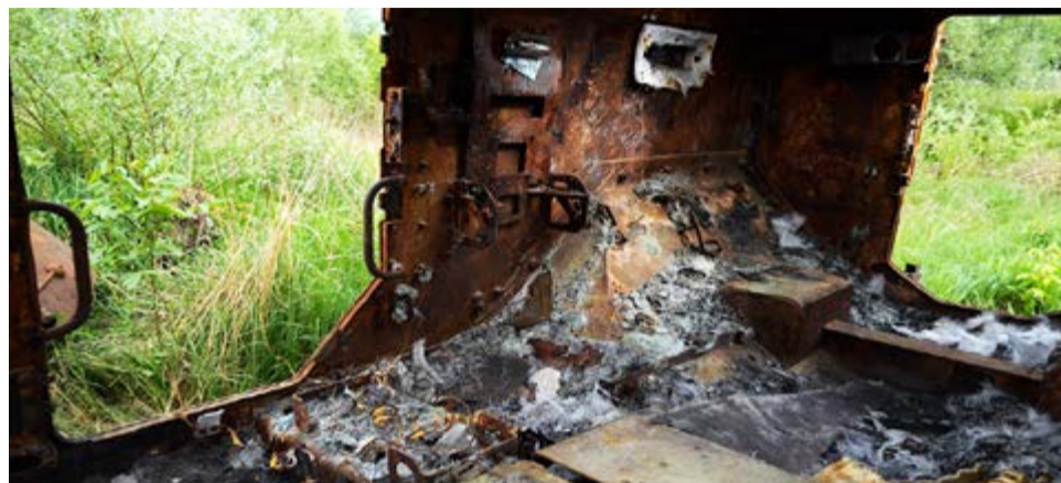
כלי רכב משוריינים חלודים ושרופים בשטח אוקראיני. אילוסטרציה.

מי שרואינו בדר"ח האו"ם תיארו כיצד הם עקבו אחריהם, רדפו אחריהם ואף רודפים על ידי מל"טים תוך כדי חיי היומיום שלהם. "נפגעים ועדים הצהירו שבזמן שמל"טים פגעו בבתיהם, הם עסקו בפעילויות רגילות כמו שהייה בחצר, גינון, טיפול בבעלי חיה, השלכת אשפה או חניית רכביהם", כך נכתב בדר"ח.