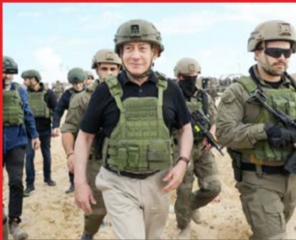
העולם מתעניין יותר בעזה.