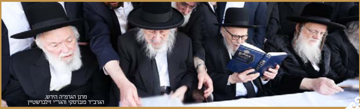
מרן הגרמ"ה הירש, הגר"ד פוברסקי והגר"י זילברשטיין