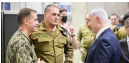
ראש הממשלה והרמטכ"ל בבסיס האמריקני.

בדברים שמסר ראש העיר בטקס החתימה אמר סויסה: "חתמנו היום על הסכם גג היסטורי שיוסיף לעיר בתהליך מדורג 21 אלף יחידות דיור. ההסכם יהפוך את קריית גת לאחת מ-10 הערים המובילות בישראל,