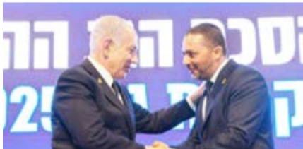
נתניהו בקריית גת.

במסגרתו ייבנו בנוסף מאות אלפי מטרים של מסחר שיוניקו את העיר שלנו קדימה, מבני ציבור, מוסדות חינוך, מרכזי עסקים והכל בתכנון מדויק והקפדה יתרה על שטחים פתוחים לרווחת הציבור.