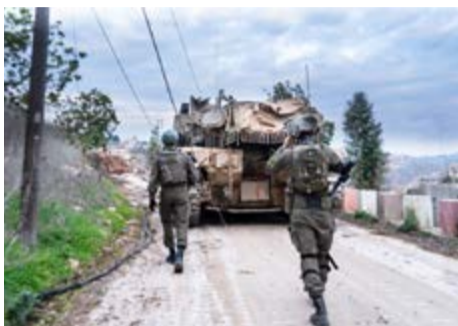
צה"ל בלבנון.

בראק, הסביר את האתגר לפרק את חיזבאללה מנשק: "לבנון היא מדינה כושלת. אין בה בנק מרכזי, מערכת הבנקאות הרוסה. אין חשמל, אנשים תלויים בגנרטורים פרטיים, וגם לטובת מים וחינוך נדרשים ספקים פרטיים. המדינה היא חיזבאללה - שבדרום מספק מים וחינוך". וכל הנתונים הללו, מובילים למסקנה אחת ברורה: ישראל וחיזבאללה לקראת עימות חדש.