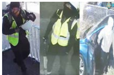
הגנבים כפי שנראו במצלמות האבטחה.

לבושים חולצת טרנינג שחורה, מכנסיים שחורים, נעלי ספורט שחורות, אפוד בנייה זוהה, כובע בנייה לבן, מגן עיניים ונראו נושאים תרמילים שחורים.