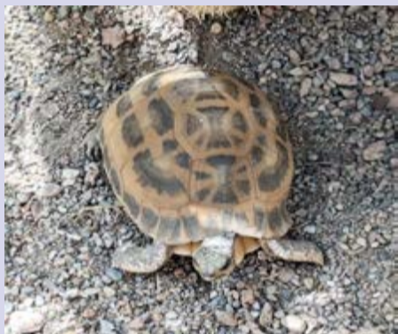
צב עכביש צפוני שחושב.

שלו", מסרה משטרת מדינת אינדיאנה בהודעה לעיתונות.