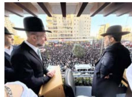
מביטים בדאגה. חברי הכנסת גפני ומקלב בעצרת