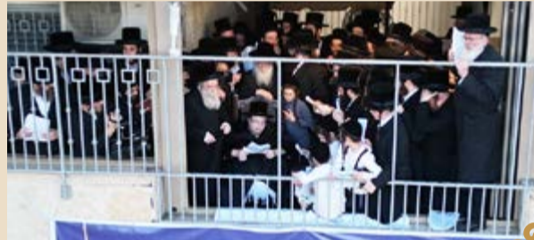
הרבי מבעלזא בעצרת