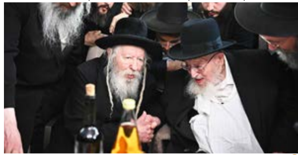
מרן הגרמ"צ ברדמן והרבי מגור במפגש