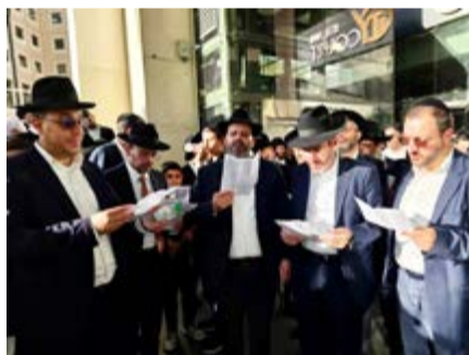
חברי הכנסת של ש"ס בעצרת

בהודעה שנמסרה מרכבת ישראל נאמר: "בשל העומסים הצפויים, יום ה' (30.10.25) בעקבות עצרת התפילה המתוכננת בירושלים הוחלט יחד עם משטרת ישראל, כי תחנת ירושלים יצחק נבון תיסגר לשירות החל ממחר (חמישי) בשעה 12:30 ועד לחידוש השירות כסדרו בתום העצרת בשל היותה בלב העצרת ולמען שמירה על בטחון הציבור".