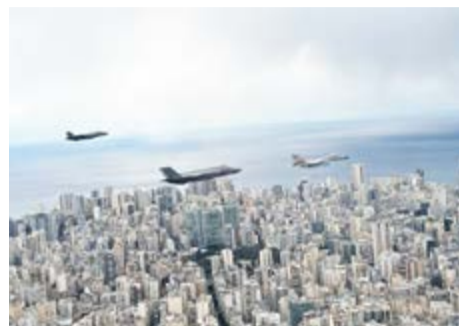
מטוסי חיל האוויר בשמי ביירות.

למרות קריסת המסדרון היבשתי מסוריה, הדו"ח קובע כי חיזבאללה ממשיך להבריח נשק מסוריה ללבנון דרך נתיבים חלופיים. מדי שבוע מוברחות עשרות רקטות גראד וטילי נ"ט מסוג קורנט - חלקם מצליחים לחדור ליעדיהם. בארי מתאר גם רשת פיננסית נרחבת המשמשת להעברת כספים דרך חלפנים, כנתיב עוקף סנקציות - שמהווה ציר מרכזי