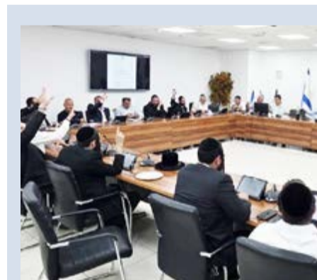
החצבנה על השוואת הארנונה

שהודרה כי הוצגו בפניו נתונים שגויים. לפני כארבעה חודשים סיקרנו כאן ב'מרכז העניינים' את ישיבת המליאה הסוערת, במהלכה אושרה תוכנית ההתייעלות של העירייה - ובמסגרתה השוו את מחירי הארנונה בעיר הוותיקה למחירי הארנונה בשכונות החדשות (כאמור, באופן הדרגתי לאורך כמה שנים). שוויון בקרב התושבים, לאחר שנים שבשכונות החדשות נאלצו לשלם יותר מתושבי העיר הוותיקה. כפי שנכתב בהבהרת העירייה, מדובר בדרישה של משרד הפנים נוכח הגירעון של העירייה, לאחר עשור של ניהול כושל.