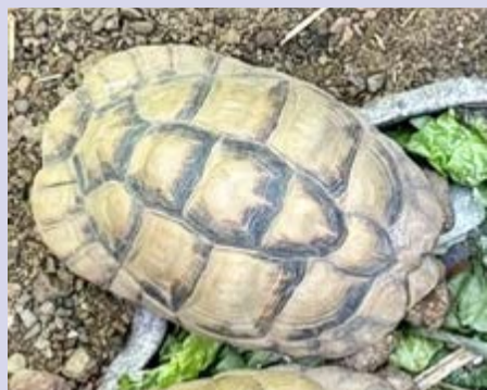
הצב מצוי שחושב.

"שני הצבים היו משובצים בצ'יפים ולצב המצוי הייתה צלקת בולטת בחלק התחתון