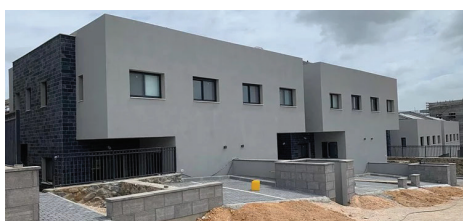
קרית שמונה | 56 יח"ד