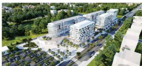
עפולה | 800 יח"ד