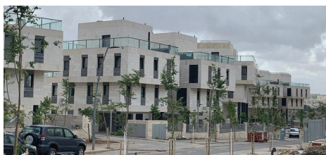
מודיעין | 90 יח"ד