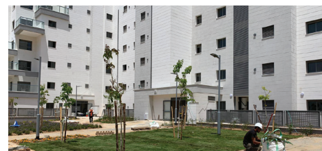
נתיבות | 240 יח"ד