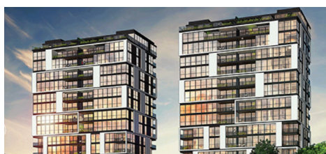
תל אביב | 400 יח"ד