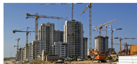
אחיסמך | 150 יח"ד