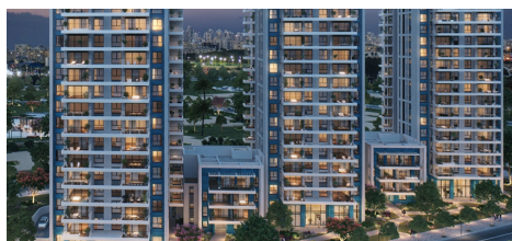
בת ים | 200 יח"ד