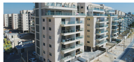
בית שמש | 120 יח"ד

אין באמור כדי להוות ייעוץ השקעות ו/או תחליף לייעוץ כאמור המותאם לצורכי הלקוח ומתחשב בנסיבותיו של כל אדם.