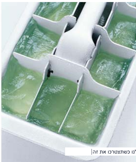
אתם כל כך תודו לנו כשתצטרכו את זה

אם אתם רוצים להיות מוכנים באמת לכוויות ולהרגיע עור שנצרב בשמש, הקפואו במגש של קרח קוביות מאלוורה. ברגע האמת לא יהיה דבר יותר מרפא ומרגיע מזה.