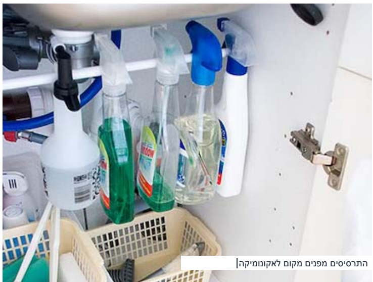
התרסיסים מפנים מקום לאקונומיקה

אם אתם רוצים לגרום לתכשירי הניקוי שלכם לעבוד יותר קשה, בנו להם מוט מתח בתוך הארון, עליו תוכלו לתלות בנוחות את כל בקבוקי התרסיס למיניהם. כך תוכלו לשלוף אותם בצורה נוחה יותר ותחסכו לעצמכם גם קצת מקום.