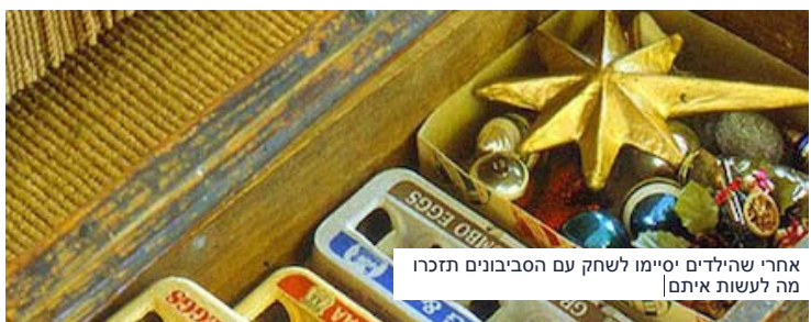
אחרי שהילדים יסיימו לשחק עם הסביבונים תזכרו מה לעשות איתם