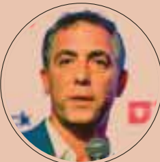
ספי זינגיר, יו"ר רשות ניירות ערך