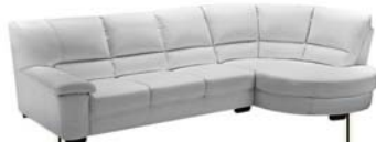
פינתית מעור רק 749X10 ₪