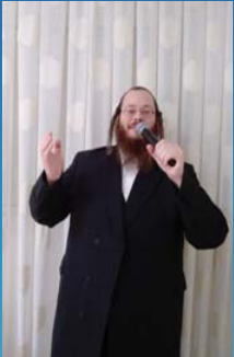
לוחות חיים מאשרים באמת. הרב מאיר טטאריק

בערב יום הקדוש הגבאי מתקשר אלי: "רבי בנימין, כולם כבר שילחו את הבקשה, מה קורה איתך?... הוא רצה שאליך להפיש מייל ולשלוח. ואו החלטתי וחשבתני לעצמי, רגע מי אמר שזה נקרא צורך, ואז אמרתי לו: 'תגיד להנה"צ המשפיע שליט"א, שהבקשה שלי לא נמצאת במחזור של ביום כיפור בגלל שלא בוצעה להשגת משע אימיו, זה היה במקום פתק הבקשה', ובכלל חשבתני לעצמי, הרי כרואי נעלם יכול להבא ישיעתם גם בלי זה... בקיצור לא הרגשתי שזה משעו שאני חי"ב, ואם לא חי"בים, או שבביל מה להשתמש במייל...'