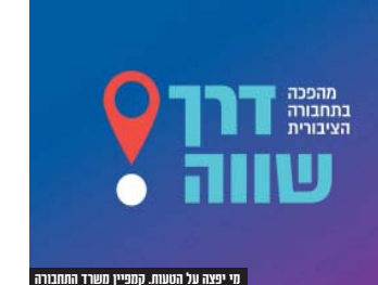
מי יצעה על הטעות. קמפיין משרד התחבורה

בחדרת בית שמש אקספרס הגיבו השבוע לפניות 'דו"ש', על הנתנה שפורסמה בשבוע שנינו ועסקה בתקלות שאירעו בימים הראשונים של הפעלת מערך רפורמת התחבורה בקווים הפנימיים בבית שמש. מכורז פורסם כי יום לפני כניסת הרפורמה לתוקפה, חושבים רבים מנו 'דו"ש' והולחנו כי כבר ביום זה העתירה בתחבורה הפנימית בבית שמש קצת לתערך והקרי של הרפורמה החדשה, ומתערך צבור שלהם יוד 5.5 שקלים, כמעט כפול מהתעריף המקורי ליום זה. למחרת היום, יום שני, כאשר הרפורמה כבר נכנסה באופן חוקי לתוקפה, נסעתי רבים התלוננו כי מערכת התקופה לא זיהתה את ה'דו"ש' שהם הטענו ברב-קו שלהם, וגבו מהם תשלום נוסף מתערך הציבור הרבות למערכת, הפגנו את שני הנאשמים למשרד התחבורה ולחברת בית שמש אקספרס, התלונות בכדי לזרז את התלונות מוכרות להם, ואם כן מה יכולים הנוסעים לעשות כבדי להשיב להם את הכסף שנגבה מהם בטעות.