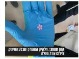
קטן ממוגן. חלקיק המשחק שנגלע התינוק.

למשקחים ומפעלים העלולים לטרם לזק בלתי הפוך חלילה. מתחם ביג' שריפה במרכז רפואי ביום ראשון בבוקר (צום השקעה באב) פרצה שריפה בגורו רפואי בתוך מתחם בית בנייה לעיר. כחסרי שנים האירוע הסתיים ללא נפגעים.