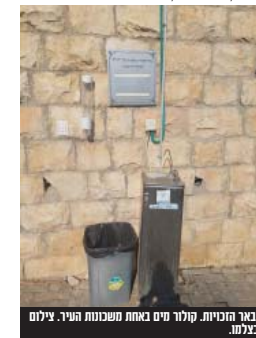
באר המכונות, קולור מים באחת משכונות העיר.

כמאה תמישים מנהלים ומנהלות הסמינרים חב"י איגוד הסמינרים מכל רחבי הארץ, המייצגים יחד עשרות אלפי תלמידות סמינרי "בית יעקב" ברובי הארץ כ"י מכל חוגי המגזר החרדי, התמססו יחד ליום העיון של איגוד מנהלי הסמינרים במטרה לעסוק באתגרי הזמן והשעה. מטריית החינוך של איגוד הסמינרים "בית יעקב" בארץ ישראל מקיפה את כל המוסדות המובילים יחד את מערכת החינוך לבנות, תוך התמודדות משותפת וזהו עם קשת של נושאים אשר נדונו בכבוד ראש ביום העיון אשר התקיים בברכת מרנן ורבנן דרולי ישראל שליט"א, שאף פיארו את במת העידה ודבריהם נשמעו במרכז.