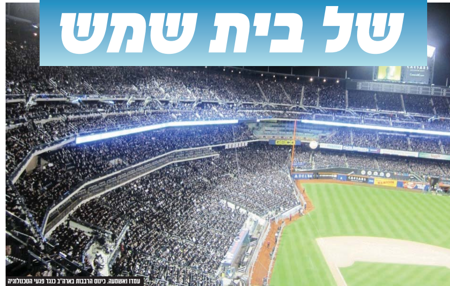
עמדו ואשמעו! כיום הרבנות באר"ב נכד פגעי הטכנולוגיה