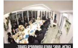
בעלזא. תומכי התורה המשתתפים במעמד.