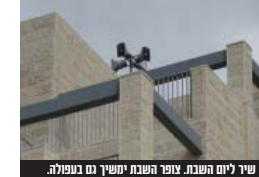
שיד ליום השבת. צופר השבת ישיש גם בגפולה.