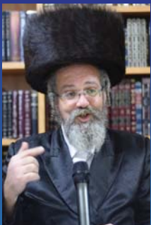
לשחרור על השיחות הרב בנימין רוזנבלט