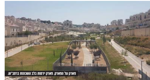
פארק על הפארק. פארק ירמות נלב השכונת ברחוב'ש

קיץ של חוויה ואתגר: מינהל חינוך ועיר וקהילה והשלוחה החברית במונים מבית רשת המרכזים הקהילתיים מוזמנים את ציבור תושבי העיר להשתתף חווית קיץ מקסימה במיוחד שתתקיים בשבוע הבא, בימים ראשון עד חמישי י"ז - כ"א באב. עשרות מתקני לונה פארק חשמליים, מתקני אקסטרים מלחריבים, מתנפחים בגודל ענק, רכבת סובבת פארק ומתחם לקטנטנים מוכנים לכם במתחם גדול ומסודר בפארק ירמות. הפארק כולל פינות ישיבה מוצללות וכל מה שצריך כדי להעניק לכל הבאים בשערו עונת של חוויה ועונג רב. הפאן פארק מוטבסד לתושבי בית שמש ועלות הכניסה לכל המתחם עומדת על 15 ש"ח בלבד לבריטלי! רכישת הכרטיסים נעשית מראש כדי להבטיח כמות מוגבלת של משתתפים בכל סבב לטובת תנאי איכותית ובטוחה.