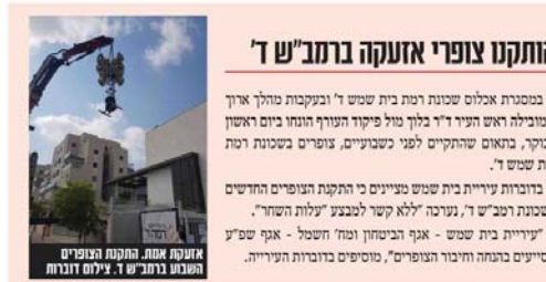
החוקן צופרי אזהרה ברמ"ש ד' המבנה ברמ"ש ד' יציום דוברת

תושבים דיווחו על שלושה פיצוצים שנשמעו הטב במסגרת רבות בבית שמש. על פי ההערכות, כיפת ברזל ירטה 2 רקטות שנורו לעבר אזור ירושלים. פיקוד העורף פירסם את היישובים בהן הופעלו באזור בית שמש האזעקות: אנקה ראשונה בשעה 8:13 בבסלון, רמת רזאל. בשעה 8:16 הופעלו בקריית יערים, מעלה החמישה, אבו-גוש, די השמונה, קריית