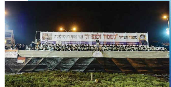
לשמור ולעשות. הכנס שנערך בדואטמ רבני עירוד בחדש אב תשפ"ב. צילום יעקב לרדמן

על הצעה המבוקשת שהם זכו לעשות בעקבות כך. אותו דבר גם בנוגע לברכת המזון, המבשרי סמוך היא אני באמצע מצוה דאורייתא. אני רגיל לומר שיקשה לי לדימוין מצב שבהן גדול עומד בבית המדרש באמצע שחיתת קרבן מוציא את הסלולרי מהמים ואומר לתלואי שמעבר לשמורת: 'נו, נו' עדין עומד דקות, אני עוסק עשיתי... ומינין ובה' יש לי הרבה מצוות דאורייתא במשך היום אז קשה להשיג אותן... מה אעשה... והאמת מי שצריך אותו ברבא, נכיר את השעות בהם אני זמין, והיכן אני נמצא. עוד נקודה אחת בעניין זה. הרי כשלומוס הילנות הפילה עיניו על כמה העניין תמוה, אפי' נחש על עקבו לא פסיק, כמו כן אסור להיכנס ל' אמות של המתפלל, כל ארבע דברים המורים נכתבו בעניין זה בספרי ההלכה, ואם כן בירור שמי שנכנס עם מכשיר ללוק ומזמין לעצמו את האפשרות להיות מופרע כל הזמן באמצע התפילה ע"י המכשיר, הרי זה ההיפך מכל מה שכתבו בשר"ע א"ח ובמשנה ברורה חלק א'. אמרת לישירו: התבונן כמה אנו מופלסים במכשירי תאר לך קבוצת בוביק, אחת כבר עומד בתחנה מבית שמש לכוון ירושלים, ופתאום נכרת ששכת את התפילין בבית, הרבה פעמים בפרט אם הזמן לחוץ אתה חושב לעצמך, כבר נסתדר, נשאל תפילין מתברר או מסתם אדם. אבל מה קורה אם אדם שם לב שהוא שכח את הטלפון בבית, או אז הוא אומר מעטשש' (לא בן אדם), הוא רץ הביתה כל עוד נשמתו באפו להיות בטוח שהמכשיר אותו. פשוט השתגענו לגמור... וכל זה במגשיש כשר והגל, אבל כשצאו מדברים בעת על הסטארטפון, אספר עוד דבר קטן: הייתי לאחורונה בבית חולים לחולי פשע, אני מירוד עם עם חלק המטופלים, והם פשוט הראו לי על כמה אנשים שירדו מדעתם אך ורק בגלל השימוש שלהם במכשיר הסטארטפון... ירחם ה'!