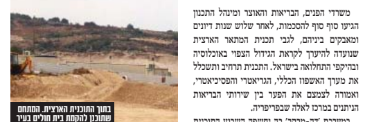
בתוך התוכנית הארצית המחמם שתוכנן להקמת בית חולים בבית שמש

משרדו הפנים, הבריאות והאוצר ומיטל התכנון הגישו סוף סוף להסכמות, לאחר שלוש שנות דיונים ומאבקים ביניהם, לגבי תכנית המתאר הארצית שנועדה להיערך לקראת הגדול הפופי באוכלוסייה ובקיפת התחלואה בישראל. התכנית תרחיב ותשכלל את מערך האשפוז הכללי, הריאטרי והפסיכיאטרי, האמורה לצמצם את הפער בין שירותי הבריאות הניתנים במרכז לאלה שבפריפריה. במערכת 'זה-הוקר' בה נחשפה השבוע התוכנית החדשה, נכתב כי יישומה של התכנית כרוך בהשקעה של מיליארדי שקלים ובהקמת שטונה בתי חולים חדשים, מוקדי רפואה ואשפוז בקהילה. כן יוקמו 19 מרכזים ריאטריים במענה להזקנות האוכלוסייה וכן יתרחבו מוקדי חירום בפריפריה. התכנית תתקבל במהלך רב שנות. לפי התוכנית: מוערך האשפוז יגדל מ-16,300 מיטות כיום ל-30,650 בשנת 2048. השלמת התכנית תשפר את שירותי האשפוז מיחס של 1.78 מיטות ל-1,000 נפש כיום ליחס של 1.95 ב-2048. התכנית קובעת כי בתי חולים הנוספים יוקמו בבאר שבע, כרמיאל, בצומת גלעם (קרית אתא), בבית שמש, בנתניה, בקריית גת ובמודיעין. 17 בתי החולים הקיימים יוגדלו כאמור ויכללו יותר מ-1,000 מיטות כל אחד. שירותי הרפואה המוקדמים בפריפריה יתוגברו באמצעות מוקדים רפואיים שיקומו בקריית שמונה, חתון, קצרין, כפר קריע, דימונה ועוד. החלטה נוספת שנויה להתקבל על הקמת מוקד חירום רפואי במצפה רמון. במקביל קופות החולים ירחיבו את שירותיהן בקהילה. מוערך האשפוז בקהילה, שיגיע בתדונה ל-15% מכלל המאושפזים האקוטיים יחוסך את הוצרך להקים בתי חולים נוספים בדיקתם ורחבתם. ראש מיטל התכנון במשרד הפנים, דליה זילבר,