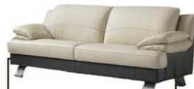
תלת מושבי מעור רק 590X10 ₪

כמו בכל שנה בית אלברט - המתחם לעיצוב הבית מזמין אתכם לסייל מיוחד לתקופת בין הזמנים! מערכות ישיבה מתצוגות ומלאי היבואן CALIA