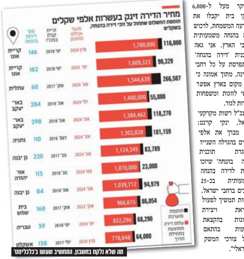
מה שלא נלקח בחשבון, התחשיב שעשו ב"כלכליסט"