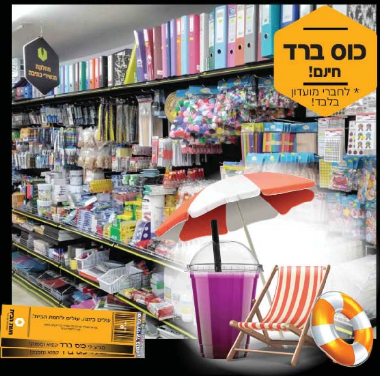
*כאן כפל מבצעים | חלק מהמבצעים מוגבלים בתשלום ריביל בלבד ולא בתשלום

אצלינו הופכים את החזרה ללימודים לחוויה הצטיידו במיטב המוצרים ממחלקת מכשירי כתיבה - קבלו כוס ברד חנים לכל ילדי המשפחה בסופר דניאל*