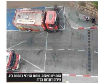
המחיים בשלום. כוחות הכיבוי במתחם ביג' צילום דוברות כ"ה

סגור לשעה 15: בוקר נתקבל דיווח בגורו השליטה של תחנת כיבוי האש בבית שמש, על שריפת חדר בגורו רפואי בביג'. 3 צוותי כיבוי ומטף הוזנקו לזקום, בהגיעם לזקום נרכז הצוותים סריקת למציאת מקור האש ותחבינו בעשן שיובא מהתקנה האקוסטית, וכבו את האש שיצאה מתוך חידית המיוז. וזו אקוזה דוכי תענה אורזית בית שמש, מתוז ירשלים, מטר כי לחתמי האש אאוורזו את המקום ועורכי סריקת, ולא מנצאו נפגעים. אין לנדרים או נפגעים.