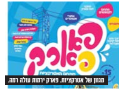
מנון של אטרקציות. פארק ירמות עולה רמה.