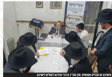
הישיבה והבנייה העצמית. מרון הגר"ג דברי הדרכה לעולים לישיבה.

שאלה: כמה בחור צריך לחפש קשר עם הרבנים? והשיבה? מרון שליט"א: חשוב מה שיותר.