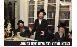
בעלזא. הרה"צ רבי שלום רוקח במשא.