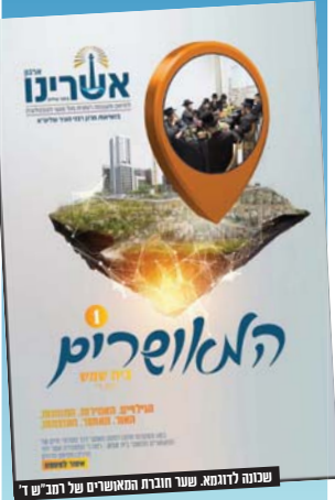
שכונה לדוגמא: שער חוברת המאשרים של רמב"ד

היה זה לפני כמה שנים וכינוי לרבי באתא הסעודות שנערכה בארשת המעפיש הר"צ רבי אלימלך בירדמן שליט"א, דוברתי שם על חומר העיון, וכמאה אברכים קיבלו על עצמם לא להיכנס עם טלפון סלולרי לזמן לזמן בית הנבטא... ועד היום אני מקבל ידידות שלום מאנשים שהתחזקו בגלל זה ומודים לי