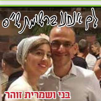
בני ושמריית זוהר לך אלול ברלימ ל"ס