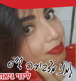
ליני גיטת למני מזביר ל"ס