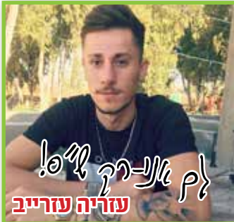
עזריה עזרייב לך אני-רק ל"ס!