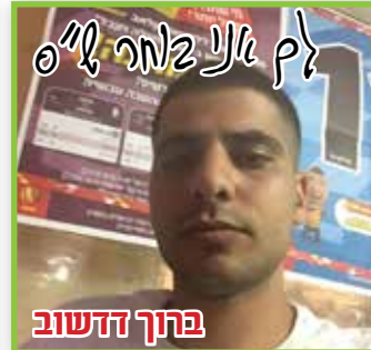
ברוך דדשוב לך אני בחור ל"ס