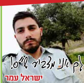
ישראל עמר לך אני מזביר ל"ס