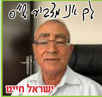
ישראל חייט לך אני מזביר ל"ס