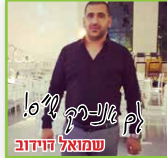
שמואל הידוב לך אני-רק ל"ס!