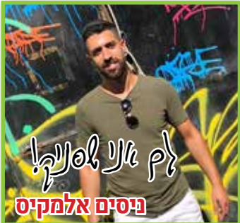
ניסים אלמקיס לך אני לסנק!