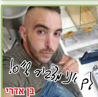
בן אדרי לך אני מזביר ל"ס!