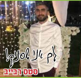
ססס רבייב לך אני לסנק!