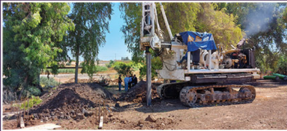
תחילת חפירת היסודות במתחם קריית החינוך

וכך, רגע לפני מעמד 'שירו למלך' במלאת עשור להקמת עפולה, אנו מתבשרים על תחילת העבודות בשטח. ת"ת 'ישועות משה' אשר שוכן מזה כשמונה שנים במבנים ארעיים - יעבור למבנה קבע מפואר ומהודר, מושלם בתכלית בס"ד. כאן יעלו ויבואו מדי יום ביומו מאות ילדי תשב"ר, להתחנך בדרך התורה והחסידות, עפי" מסורת רבוה"ק זי"ע ולהבחיל"ח תחת נשיאות מרן אדמו"ר שליט"א, שבשומעו את הבשורה ניכרה קורת רוח רבה על פניו.