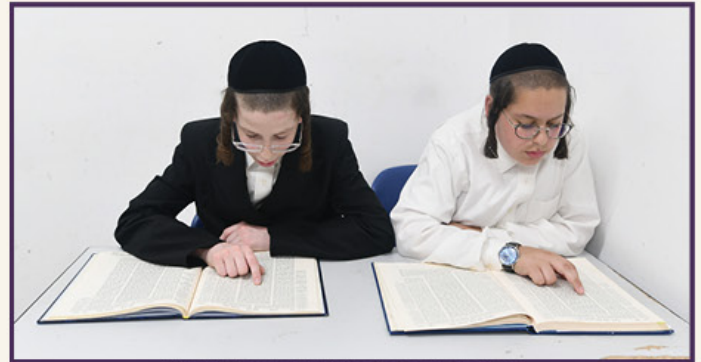
תלמידי כיתה ח' בתלמוד תורה. תשפ"א