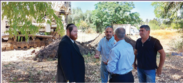
ראש העיר בסיור במתחם העבודה