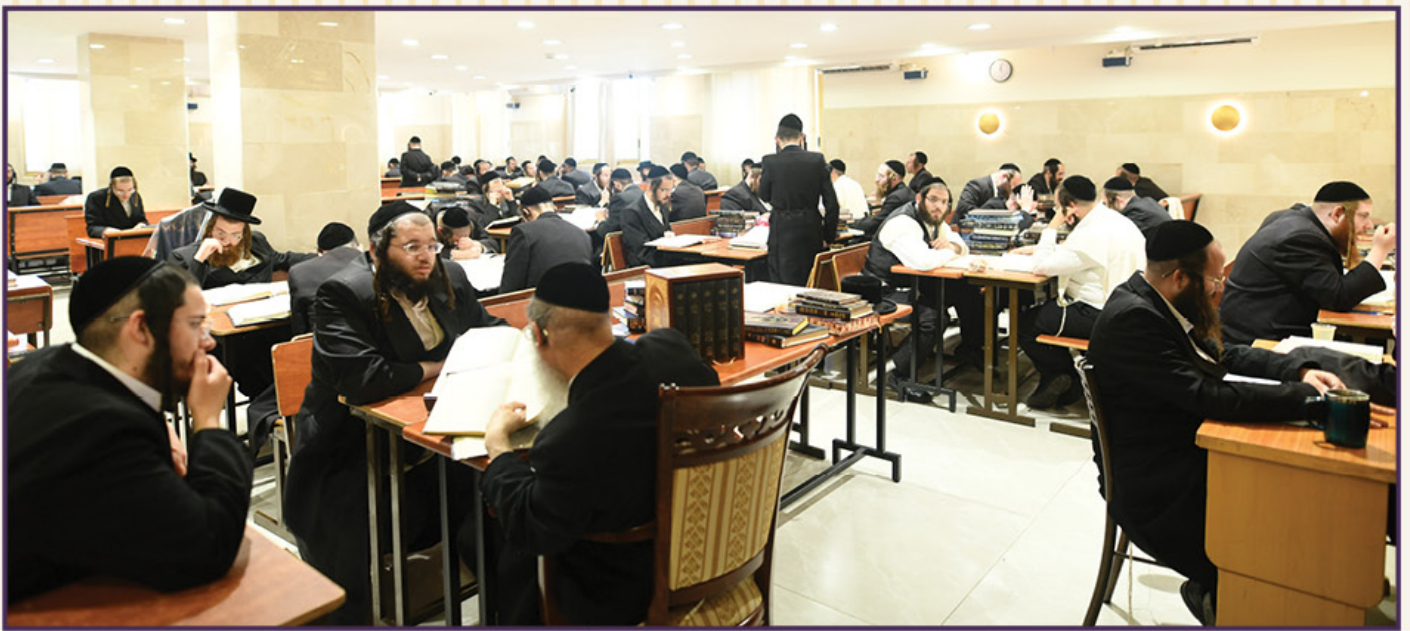
אברכי הכולל כיום בעפולה

מחלום רחוק, נבואה עתידית, מה שנראה כדמיון פורה, חזיון לא מבוסס -