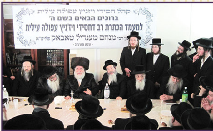
הכתרת מורינו הרב. תשע"ב