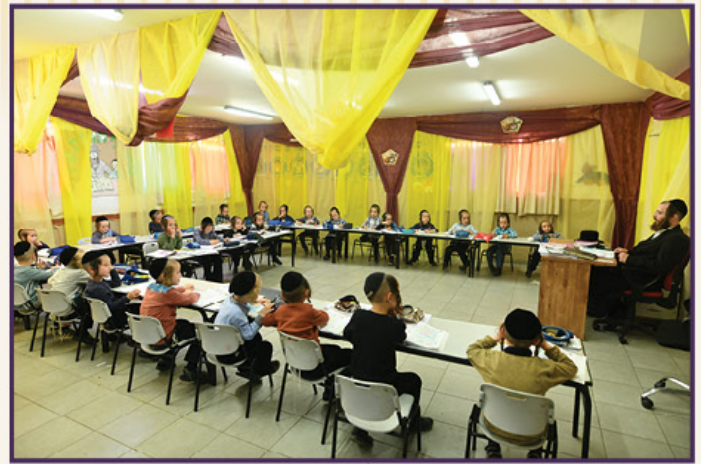
כיתה א' בתלמוד תורה. תשפ"א

מרן אדמו"ר שליט"א עזב הכל, ובא לשבות בעפולה, בקרב צאן מרעיתו. אם בעבר היה מרבה לחזק את עפולה, הרי שהפעם בא 'לטעום' את עפולה, להרגיש אותה, לחיות אותה עם בני הקהילה במשך שבת שלימה, כשהוא מוסיף לעודד את