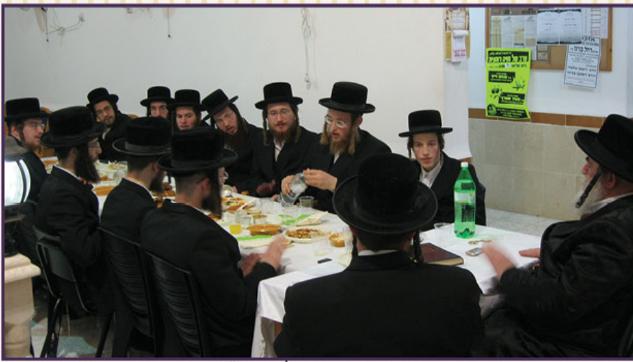
היץ הראשון בעפולה. תשע"ב

אין לתאר את קורת הרוח של מרן אדמו"ר שליט"א בשומעו על כך, בראותו כי חזונו הגדול מתחיל להתממש. עוד נכונו לה לעפולה עלילות, אבל העניין מתחיל לעלות על דרך המלך!