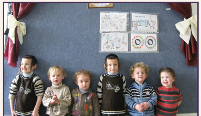
תמונת המחזור הראשונה