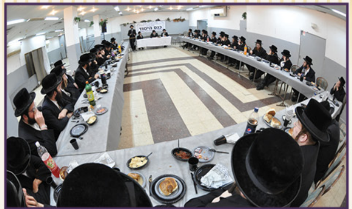
כינוס יסוד עפולה, תשע"ב