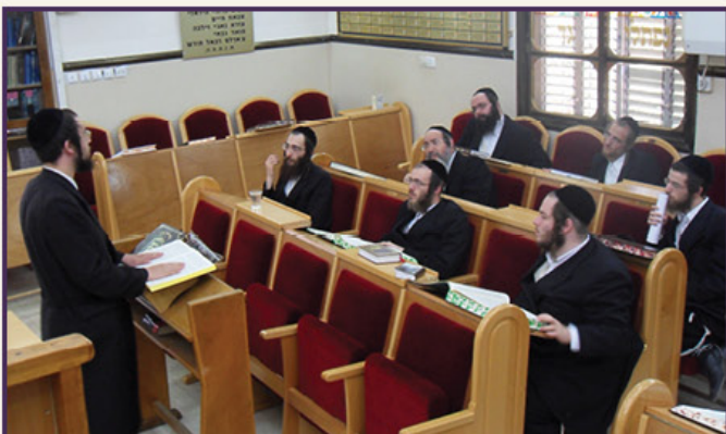
פתיחת הכולל בעפולה