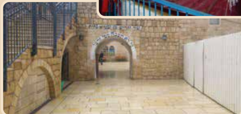
ציון התנא רבי שמעון בר יוחאי זיע"א

"מיהו המנהג - בימי השובב"ם - ליתן בעד כל יום תענית כסף לנדבה שוה סעודה אחת, העני לפי עניו והעשיר לפי עשרו" (כף החיים).