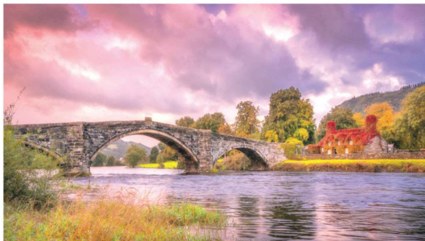
להשיג ולחשמו. משום שהגשר עלול ומסוגל להוביל למחוזות אין בהם חפץ, ואין מהם חזון, חלילה...

וכן התלקחה המלחמה בין בעלי "חדש אסור מן התורה" ובעלי "הוראת שעה שאני", וכל צד היו לו סנגוריו ומתנגדיו.