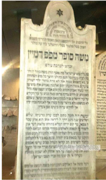
ציון ה'חיים סופר' ז"ע. הוא ניצח...

באותו ראיון הוא גם ערער, כאמור, על תאוריית שנייה האקלים. בתשובה לשאלה האם לשינוי האקלים