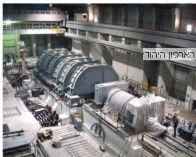
כור גרעיני באיראן. חרדת 'התחדדות' החברה הישראלית מדאינה חילוניים רבים שחלקם אף וואים בכך סננה קיומת לא פחות מהאיום האיראני

עבור החרדיים, שדוגלים בהיבדלות, יזומה של מפגשים בין חרדיים וחילוניים הייתה מהלך רגיש. "הבנו שגם בתוך המגזר החרדי יש אתגר במשכור את החומות. זה היה תהליך של שנה עד שהצלחנו להכין תוכנית אופרטיבית", מספר דרור. לרפפורט דרור יש ביסס להאמין, כי הפרויקט אכן עשוי לשנות את פניה של ישראל. הסטודנטים שהם בחורים הם בעלי אופי מנהיגותי, כאלה שיש בהם איכותיות שעשויה להפוך אותם לסוכני שינוי בחברה שלהם. "בעוד 10-20 שנה הבוגרים של הפרויקט שלנו יהיו מנכ"לים בעבודת השפעה בכירות, והם ישקלו אם להעסיק חרדי או לא. המפגש הזה ישפיע על ההחלטה שלהם", אומר רפפורט. בחורה לשמואל. הוא כבר הספיק להקים באוניברסיטה העברית תא סטודנטים חרדי, שמונה עשרות צעירים חרדיים. כששואלים אותו מה הוא רוצה להיות כשהיה גדול, התשובה שלו מגיעה מאותו עולם הערכים של הפרויקט שבו הוא משתתף כיום. "אני רוצה להיות חלק מהמנהיגות החרדית שמייצרת שינוי", הוא אומר בהתלהבות. "השוב לי מאור שיהיו ישיבות וכוללים, אבל חשוב לי גם לדאוג לאנשים שתקונים בבולף ולא יבוליים לצאת משם חאשכ"ח ולעבוד. צריך לתת אלטרנטיבה – ויותר חשוב לתת הכרה, כדי שיהיו שיש שרף ביציאה לעבודה".