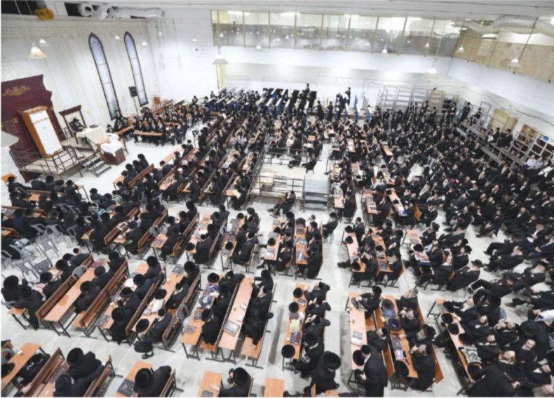
לומדים תורה בערגה. ואת זאת, יש המבקשים, חלילה לבטל. היל"ת. ובין השאר, באמצעות...אקדמיה

"אבא שלי נולד ביפו. הוא דיבר ערבית כל חייו, שלש גם בנים הפלמטיני וגם בנותי. עבדו אצלו ואתו ערבים מישראל לפני מלחמת ששת הימים, ופלמטינים אחרים. הוא באמת הכיר את הערבים, את אורח חייהם ומנהגיהם, והמיר נתן כבוד, וכמוכן זכה לכבוד" – כך מספר השבוע בעיתונו, רן קופמן, בטור נוסף שנאת חרדים.