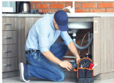
עדיף להיות שרברב

וכך נשמע מי שהיה שר הכלכלה, נפתלי בנט, בישיבת הוועדה לענייני ביקורת המדינה שנערכה בל' אב תשע"ג: "ממשלת ישראל מקצה דרך המשרד שלי חצי מיליארד שקלים על פני חמש השנים הקרובות, לשילוב החרדים במעגל העבודה. העיקרון שאני מנחה את כל המשרד שלי היא הגמישות... ההוראה שלי... מה יהיה עוד ארבע-חמש שנים זה עוד ארבע-חמש שנים, כרגע יש חצי מיליארד. יש את