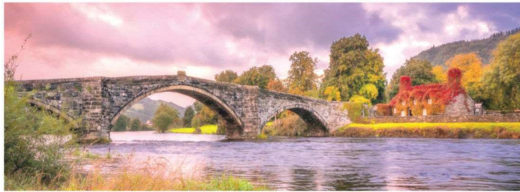
להשיג ולהשמור. משום שהגשר עלול ומסוגל להוביל למחוזות אין בהם חפץ, ואין מהם חזון, חלילה...