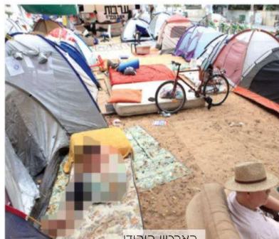
הארכיון היהודי אהלי המחאה בשד' רוטשילד בתל אביב בקיץ 2011

התמריץ הכלכלי הגדול שניתן לכל מוסדות ההשכלה הגבוהה, שהצטרפו במהירות לתוכנית המפתח, היה המניע הראשי של תוכנית המח"רים. בנוסף על שכן הלימוד הגבוה והתקציב הרגיל שמקבלים המוסדות על כל תלמיד שהוא, הקצה המל"ג 180 מיליון ש"ח (!) נוספים לתקצוב המח"רים. כתוצאה מכך, נתחו המוסדות ההשכלה הגבוהה בתחרות על לבם של הצעירים החרדיים, תוך שהם מקימים מערכות פרסום ושיווק, שנועדו למשוך אליהם כמה שיותר נרשמים. כך צמח לו מערך תעמולה רב עוצמה שקרא לציבור החרדי