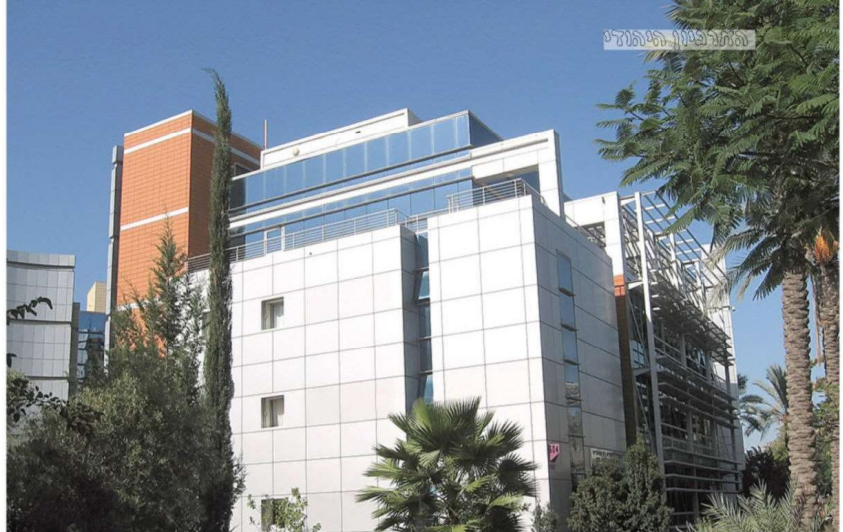
הספרייה והארכיון היהודי

בהמשך היא נדרשת לביקורת שהטוחה בה, אודות צנורה שהופעלה בכיכול במכללה שלה, נגד שיטותיו הכפרניות של פרויד, אחד המדענים המשפיעים והבולטים בתחום הפסיכולוגיה. צנורה על אדם זה, עשויה להיחשב כ'חטא' כל יכופר בעולם האקדמיה. בתגובה היא מודה שאין בכלל אפשרות לצנור זאת: "הטענה... ש'עדיף לא ללמד את פרויד'