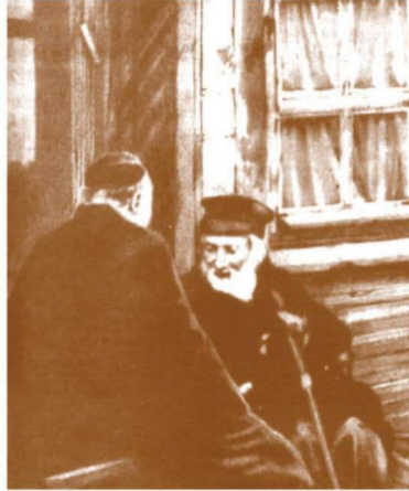
דמות דיוקנו מרגא ורבנא ה'חפץ חיים' זי"ע ו'זוהו חילול בית מקדשנו ותורתנו הקדושה אשר לא נשמע מעולם כמותו, אוי לאוזניים שכן שומעות..."

את התרגשותם העולה על גדות, ביטאו המייסדים בהמנון האוניברסיטה העברית, שחובר במיוחד לרגל המאורע והורש או לראשונה. להלן טעימה ממנו, הממחישה את יחסם לאותו אלייל אקדמאי, המשתווה על ידם, להבדיל, כמו אל בית המקדש: צָאוּ רַגְעֵי, קָפוּ, רַב, כִּי בָּרַךְ, כִּי קָם הַדְּבִיר!