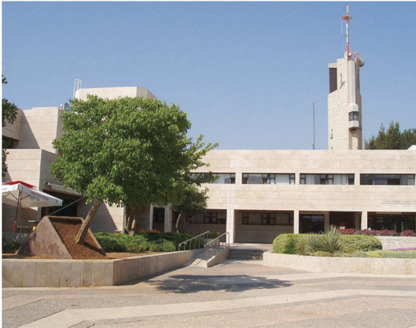
בנין האוניברסיטה העברית בהר הצופים