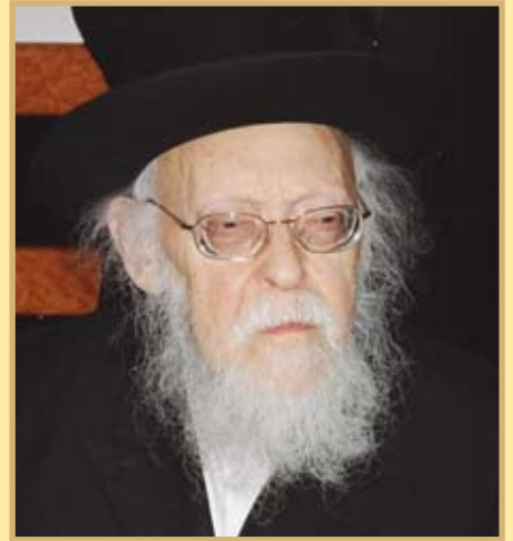
מרן פוסק הדור הגרי"ש אלישיב שליט"א:

הנני מכירו אישית כוונתו רצויה ומעשיו מוכיחין