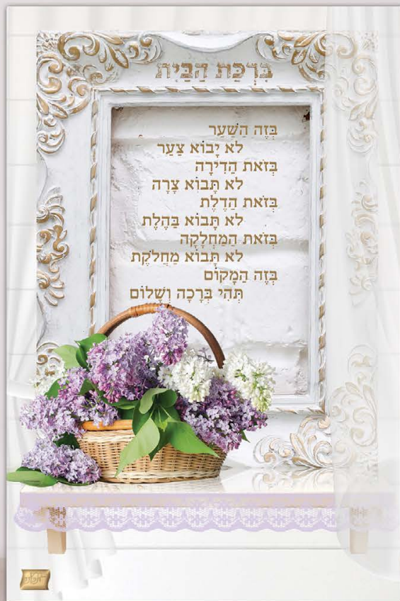
גודל התמונה: 30-20 ס"מ