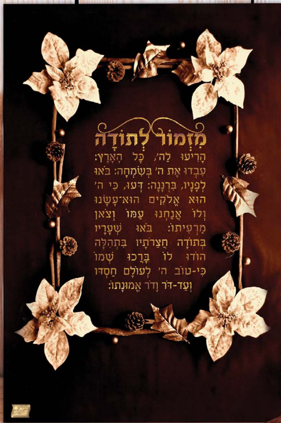
גודל התמונה: 20-30 ס"מ