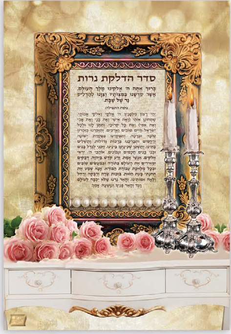
גודל התמונה: 20-30 ס"מ