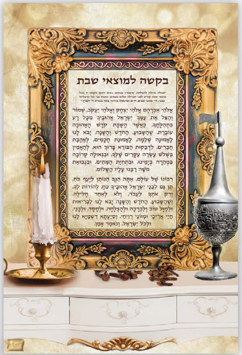
גודל התמונה: 30-20 ס"מ