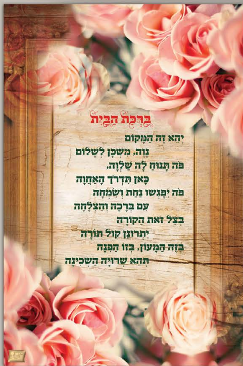
גודל התמונה: 20-30 ס"מ