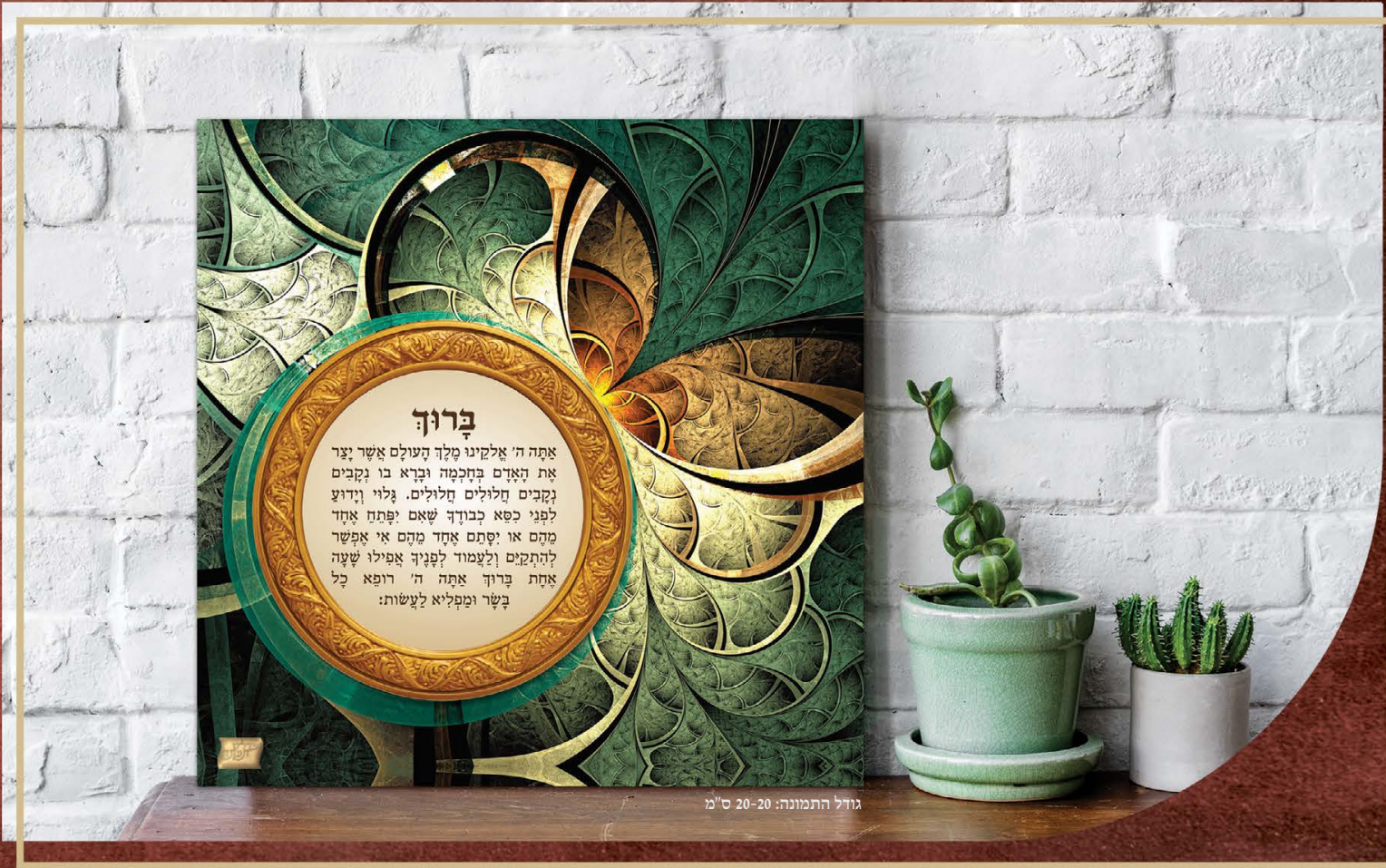
גודל התמונה: 20-20 ס"מ