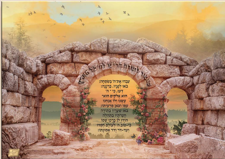
גודל התמונה: 25-35 ס"מ