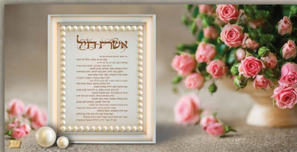
גודל התמונה: 30-60 ס"מ