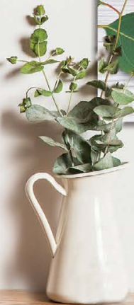
גודל התמונה: 26-30 ס"מ

א-ל עליון קדם שאני מתחיל בעבודתי הקדושה לרפא את יצירי ספיך אני טפיל תנוחי לפני כסא כבודך שתחו לי אמצך רוח תקרר רוב לעשות את עבודתי באהבה ורחמיךה. לבער רוח או שם טוב לא תעשה אתי עיני מראות נבונה וכני להביט על כל סובל הבא לשאל מצעתי בעל אדם כלי הכבד בון עשיר ועני, רדי ושואא איש טוב ורע. את האדם בער לו הראוי רק את האדם. אם רופאים בונים ממני רצעים ללמדני ביה נון לי רצון ללמד מוסם כי תורת הרפואה אין עיר לה. אבל כאשר כסילים ובזוי חוקני אהבתי למצטער תחזק את רוחי טבלי להרשע עם וקנת המלצעים וכבודי רק האמת תהיה לי לדגל כי כל חזון במקצועי יכול להביא בליט וטמלה ליציר כפי. אמן ה' רחום וחנון חזקני האמצעי בנופי ובנפשתי רוח שלום תשע בקרבי.