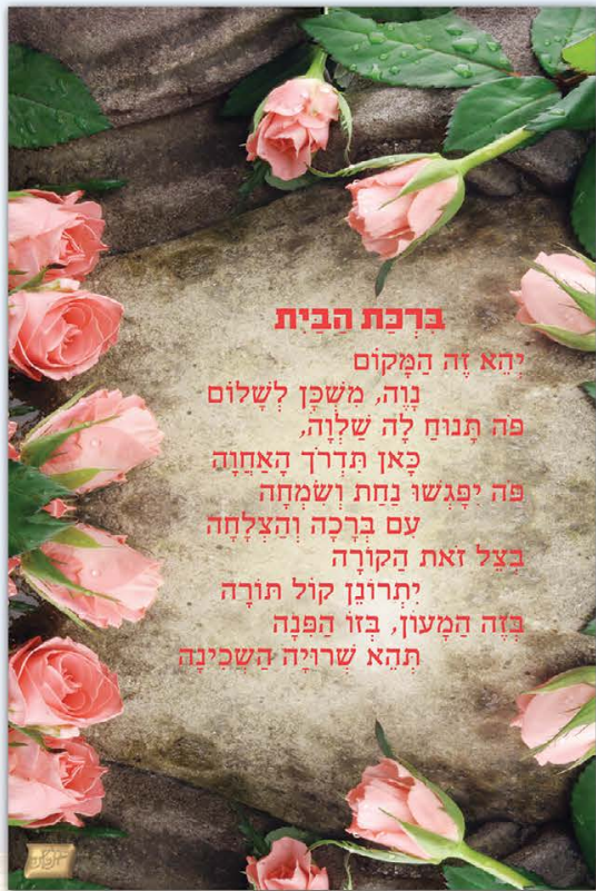
גודל התמונה: 20-30 ס"מ