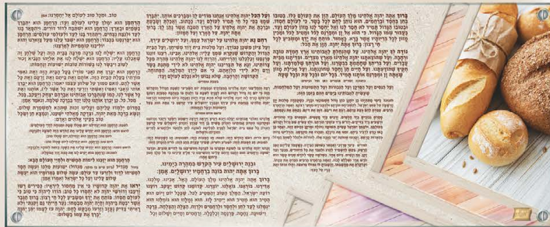
גודל התמונה: 110-45 ס"מ