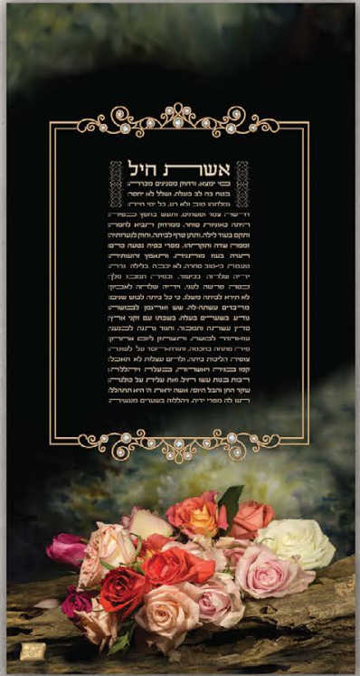
גודל התמונה: 60-30 ס"מ