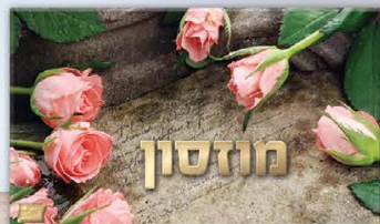
גודל התמונה: 13-22 ס"מ