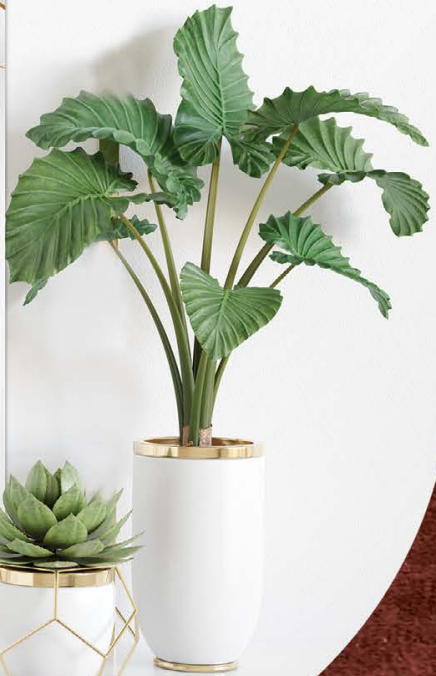
גודל התמונה: 20-20 ס"מ

בְּרוּךְ אֲמָתָה ה' אֱלֹהֵינוּ מְלַךְ הָעוֹלָם אֲשֶׁר יָצַר אֶת הָאָדָם בְּחִכְמָה וּבְרָא בּוֹ נִקְבִּים וְנִקְבִּים חֲלוּלִים חֲלוּלִים. גְּלוּי וְיָדוּעַ לִפְנֵי כִסֵּא כְבוֹדָךְ שָׂאֵם יִפְתַּח אֶחָד מֵהֶם אוֹ יִסְתֵּם אֶחָד מֵהֶם אִי אֶפְשָׁר לְהִתְקַיֵּם וְלַעֲמוּד לִפְנֵיךְ אֶפִּילוּ שְׂעָה אַחַת בְּרוּךְ אֲמָתָה ה' רוֹפֵא כָּל בָּשָׂר וּמַפְלִיא לַעֲשׂוֹת: