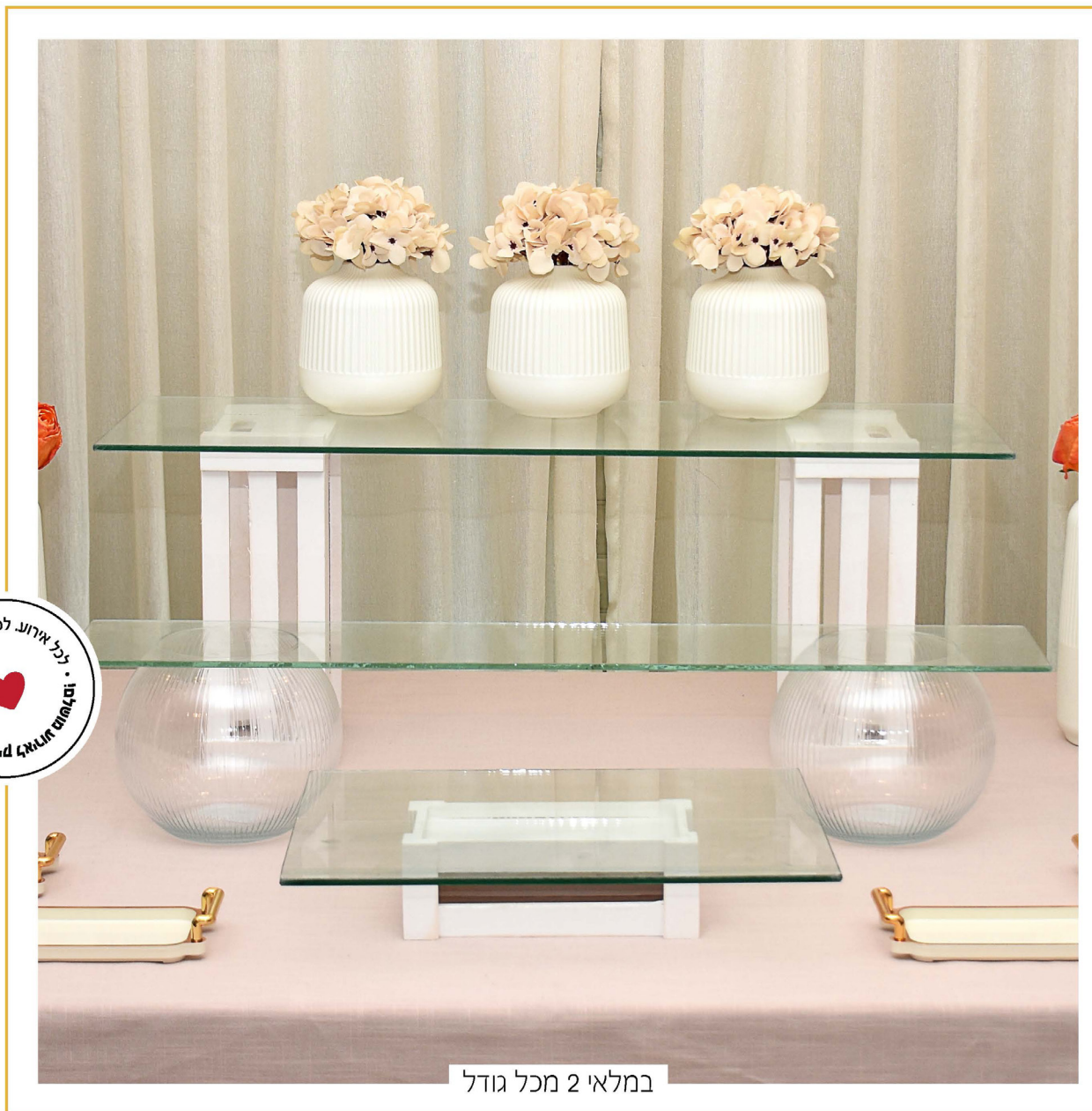
במלאי 2 מכל גודל